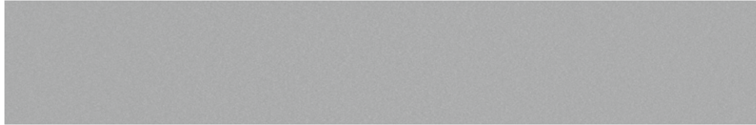
GRIS RADIANT MÉTALLISÉ 6