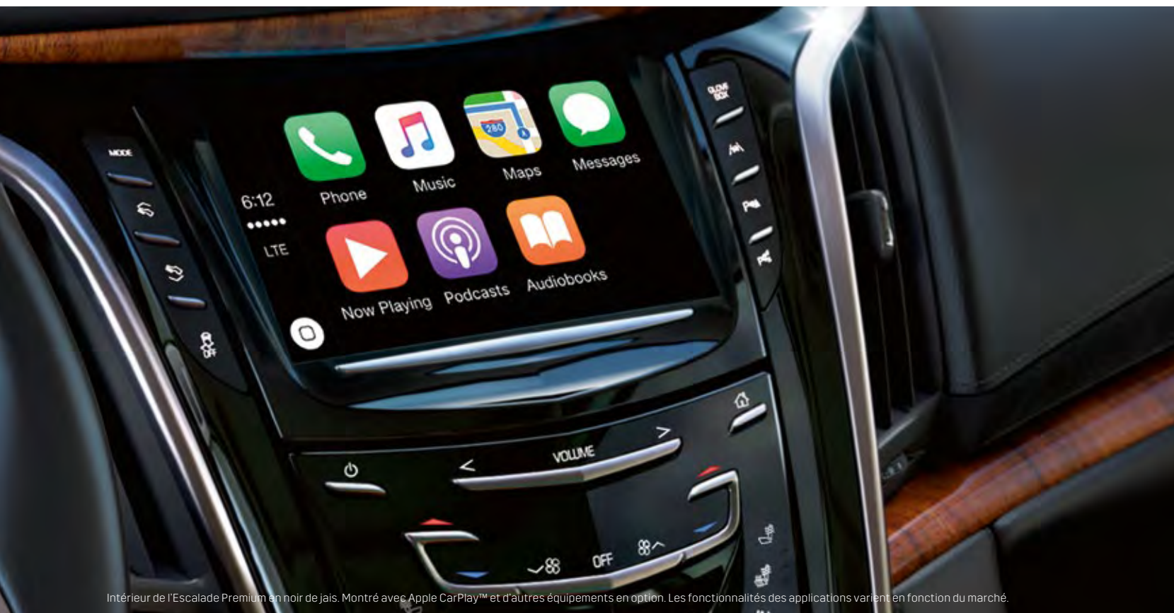
Intérieur de l'Escalade Premium en noir de jais. Montré avec Apple CarPlay™ et d'autres équipements en option. Les fonctionnalités des applications varient en fonction du marché.