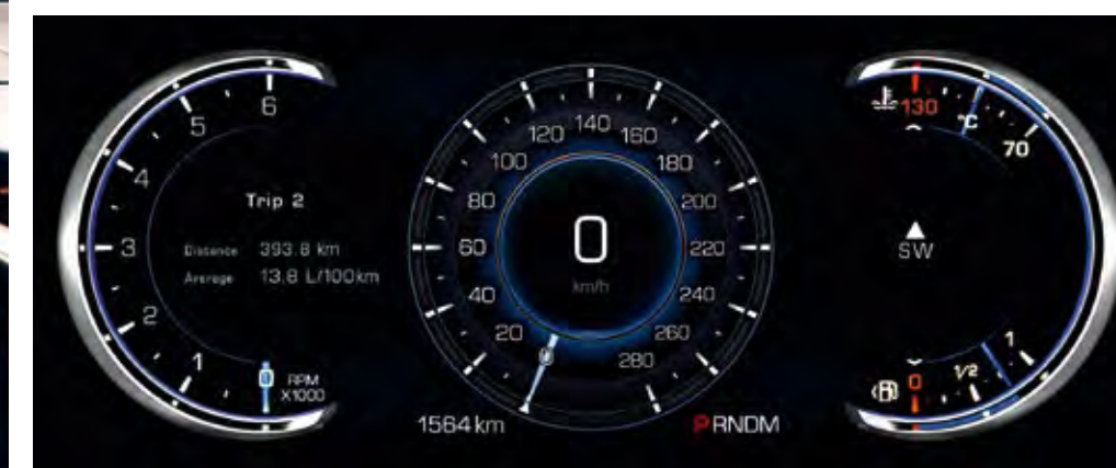
TABLEAU DE BORD NUMÉRIQUE RECONFIGURABLE 12,3"

Un tableau de bord à votre goût. Personnalisez le tableau de bord LCD de 12,3" en choisissant l'un des deux thèmes combinant les données du véhicule, de navigation et de divertissement avec d'impressionnantes images en 3D du véhicule.