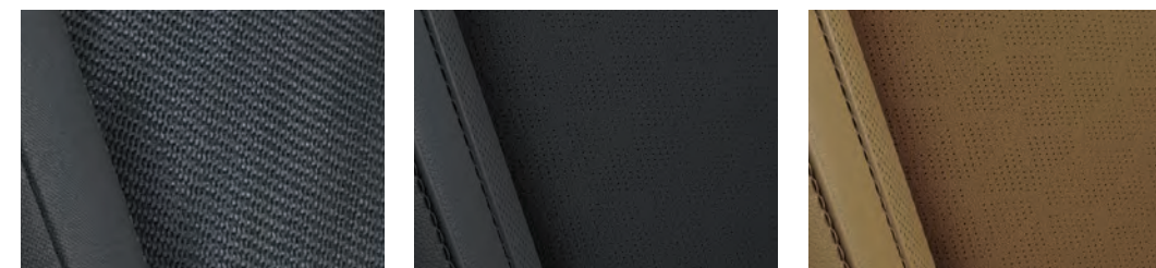
LX Tissu noir