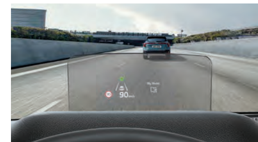
L'affichage tête haute (HUD) 1 projette subtilement les informations de conduite importantes sur un écran secondaire placé au-dessus du volant.