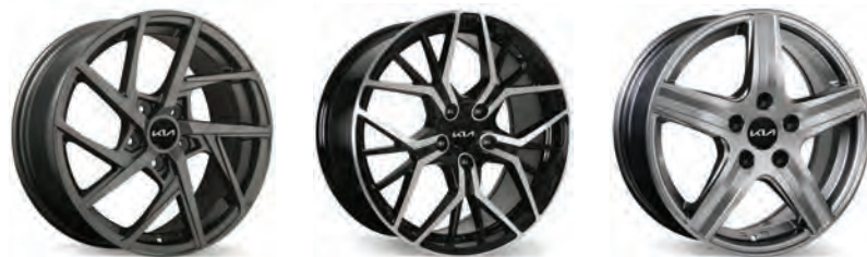
Choix de jantes

La disponibilité des accessoires peut varier. Images à titre d'illustration uniquement. Les articles et la sélection proposés peuvent varier. Veuillez demander tous les détails à votre concession.