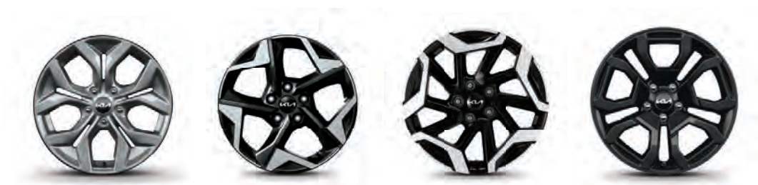
LX et EX Jantes en alliage de 17 po