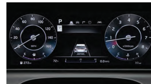
Le tableau de bord Supervision avec écran ACL/TFT de 10,25 po 1 affiche les informations importantes en vous permettant de rester concentré sur la route.