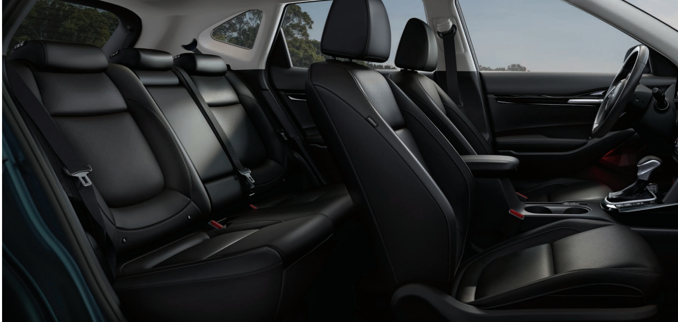
Modèle Ex Premium illustré.