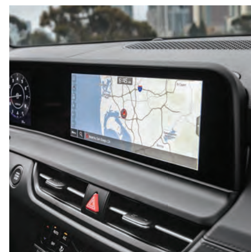
L'interface multimédia de 10,25 po 1,4 inclut un navigateur intégré à écran tactile.

L'habitacle du Seltos est conçu pour sublimer le plaisir de conduite. Le design minimaliste, l'excellente visibilité et les commandes conviviales vous assurent le contrôle sur chaque aspect de votre expérience.