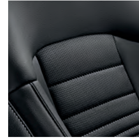
EX Premium, SX Cuir noir piqué (synthétique)