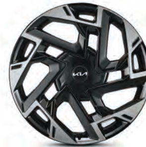
Jantes en alliage de 19 po