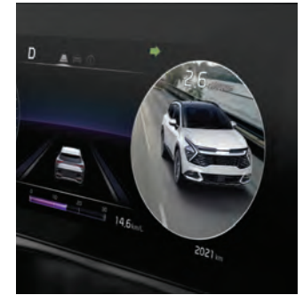
L'écran de surveillance des angles morts affiche l'angle mort du côté où vous avez mis votre clignotant.*