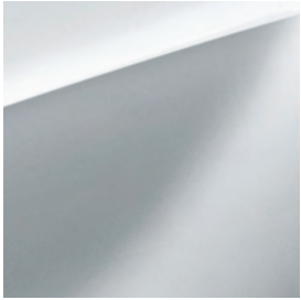
Blanc neige nacré