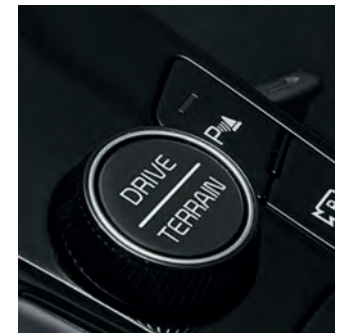
Le mode Terrain améliore l'adhérence et le contrôle dans la boue, sur la neige et sur le sable.