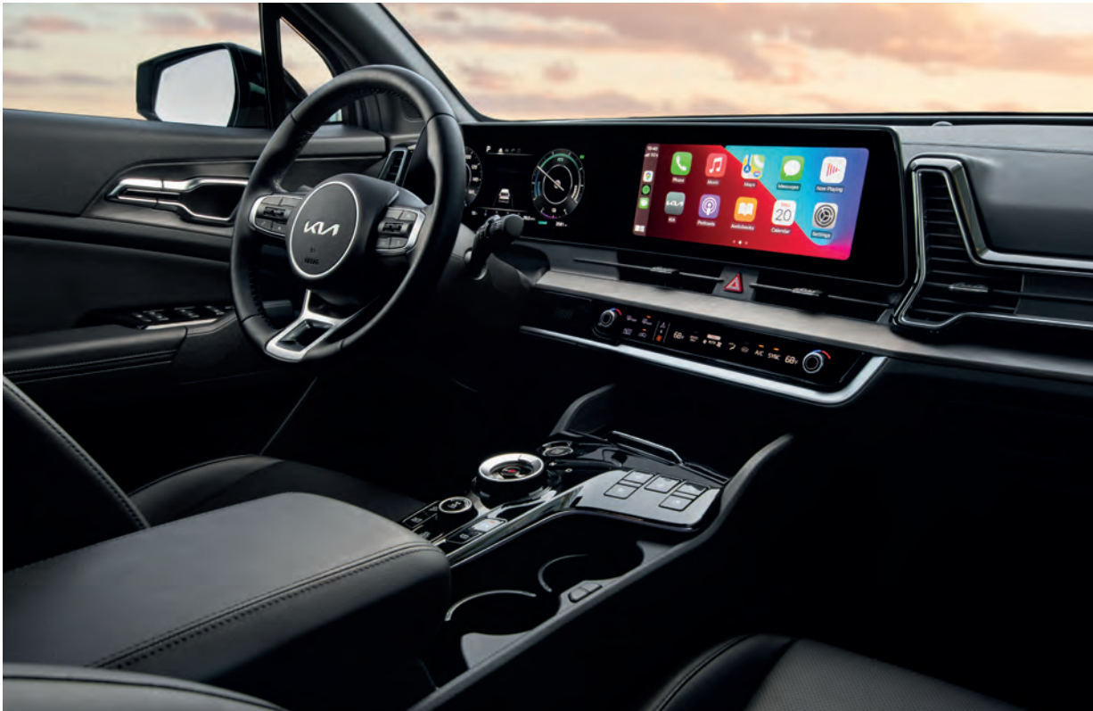
L'écran multimédia de 12,3 pouces affiche le navigateur, les commandes audio et autres fonctions du véhicule.