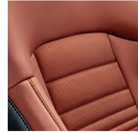
SX Cuir rouge carmin piqué (synthétique)