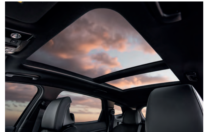
Le toit ouvrant panoramique illumine et agrandit l'habitacle.