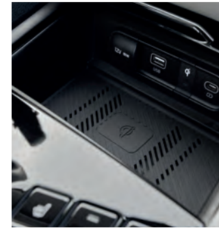
Gardez votre téléphone intelligent chargé sur la route, grâce au chargeur sans fil.