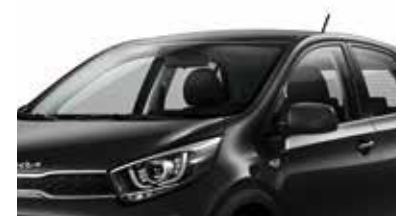
Noir Ébène [ABP] (1)