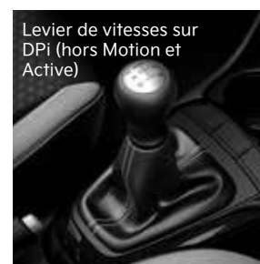
Levier de vitesses sur DPi (hors Motion et Active)

ISG (Idle Stop & Go). La technologie ISG vise à réduire la consommation de carburant et les émissions en coupant le moteur lorsque le véhicule est à l'arrêt.