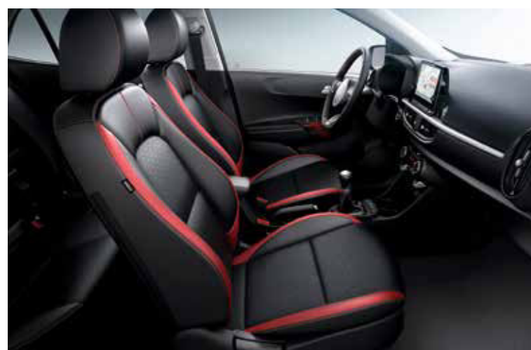
Sellerie en matière synthétique noir et rouge et inserts finition noir laqué avec sérigraphies rouges GT-line Premium