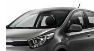
Gris Météore [M7G] (1)