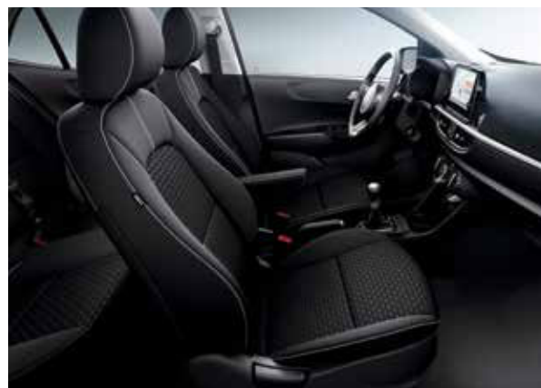
Sellerie tissu noir Comet GT-line