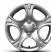
Jantes en acier 14" avec enjoliveurs (Motion et Active)