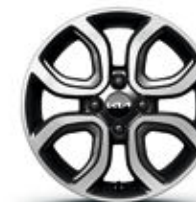
Jantes en alliage 15" (GT-line)