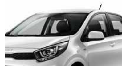
Blanc Céleste [UD]