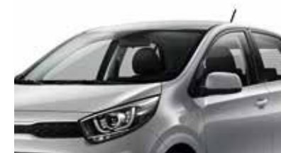
Gris Acier [KCS] (1)