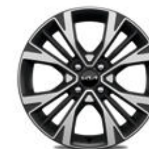
Jantes en alliage 16" (GT-line Premium)