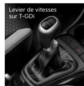
Levier de vitesses sur T-GDi