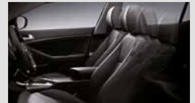
3. Siège conducteur à réglage électrique 8 directions

Fantastique pour les longs trajets : le support lombaire électrique du siège conducteur fonctionne sur simple pression d'un bouton.