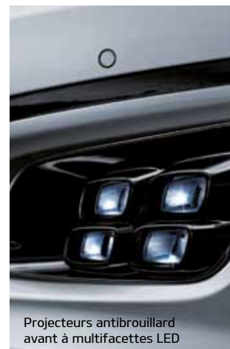
Projecteurs antibrouillard avant à multifacettes LED