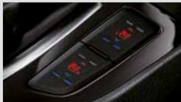
1. Sièges avant ventilés et chauffants (disponible selon les finitions)

Vos sièges s'adaptent à vos besoins : grâce à la diffusion d'air frais les jours de chaleur estivale et d'air chaud les matins glaciaux.