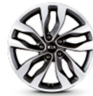
Jantes alliage 18" Mercure (Premium)

Retrouvez plus d'informations sur le label des pneumatiques sur www.kia.com