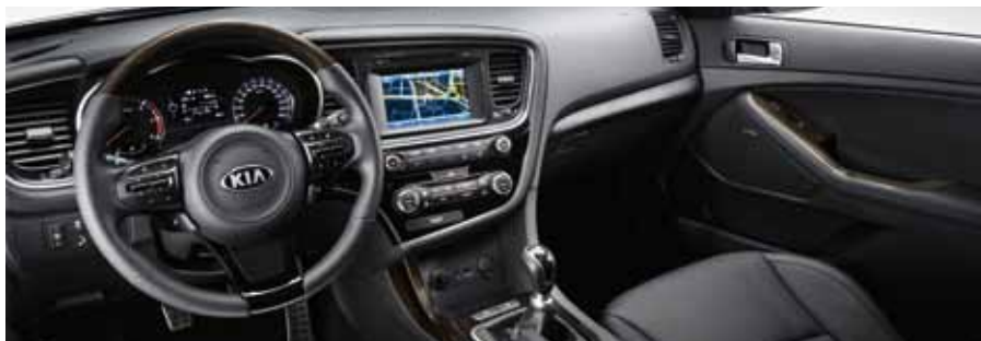
Sellerie cuir Lounge et applications type bois.