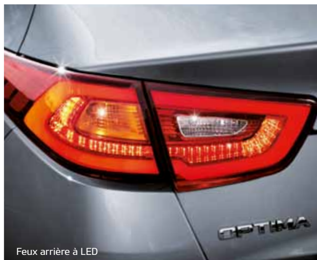
Feux arrière à LED

Les nouveaux optiques ultra sophistiquées de la nouvelle Kia Optima renforcent son look sportif, pour une expérience de conduite inoubliable.