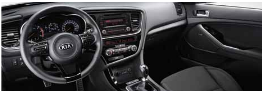
Sellerie simili cuir et tissu noir Club et applications noir laqué