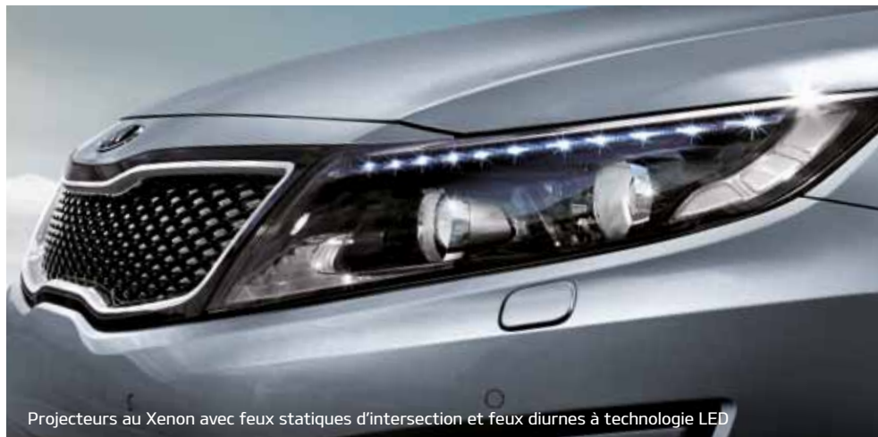
Projecteurs au Xenon avec feux statiques d'intersection et feux diurnes à technologie LED