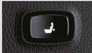
2. Support lombaire du siège conducteur

Vos sièges s'adaptent à vos besoins : grâce à la diffusion d'air frais les jours de chaleur estivale et d'air chaud les matins glaciaux.