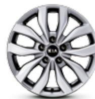
Jantes alliage 17" Césium (Active)