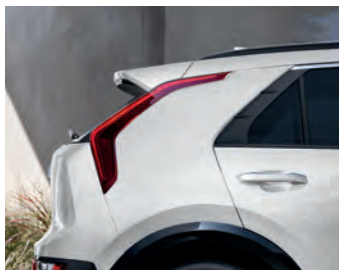
Blanc neige nacré