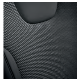
Tissu et cuir synthétique charbon