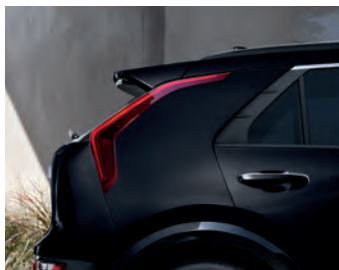
Noir aurore nacré