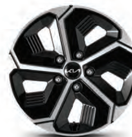
Jantes en alliage de 16 po