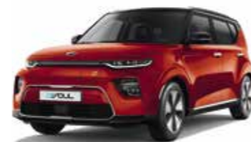
Orange Fusion / Toit Noir Abyssinie (SE3)*

* Teintes nacrées ou bi-ton disponibles en option