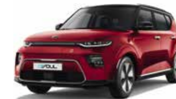
Rouge Inferno / Toit Noir Abyssinie (AH4)*