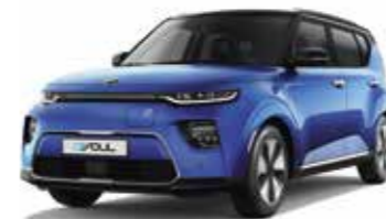
Bleu Neptune / Toit Noir Abyssinie (SE2)*