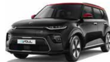
Noir Abyssinie / Toit Rouge Inferno (AH5)*