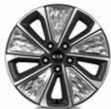
Jantes en alliage de 17" finition diamantée

Le Kia e-Soul entend célébrer la nature et la technologie dans la joie et l'harmonie. Il offre une large palette de coloris extérieurs comprenant 3 teintes mono-ton d'une grande élégance et 4 combinaisons bicolores (carrosserie et toit + rétroviseurs) associant des teintes métallisées à l'éclat incomparable. Ainsi, quel que soit votre choix de coloris, vous profiterez d'une livrée totalement exclusive, que vous ne manquerez pas d'apprécier jour après jour.