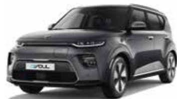
Gris Gravité (KDG)