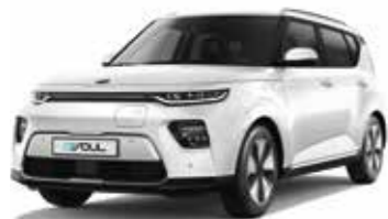
Blanc Nacré (SWP)*