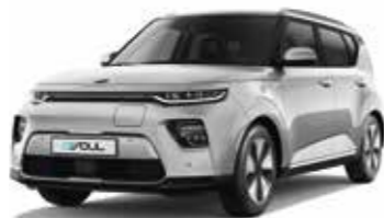
Gris Acier (KCS)