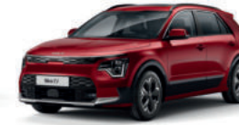
Rouge Magma (CR5)