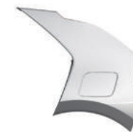
Gris Comète (KLG)