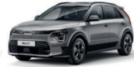
Gris Comète (KLG)