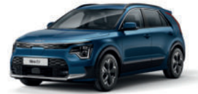
Bleu Minéral (M4B)