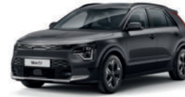
Gris Cosmique (AGT)