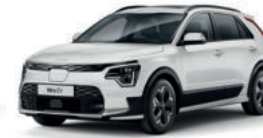
Blanc Nacré (SWP)