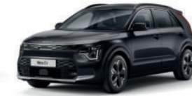
Noir Ebène (ABP)