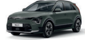
Vert Aventurine (CGE)