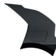
Noir Ebène (ABP)