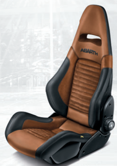
Cuir/Alcantara® Sabelt marron avec coque de siège en carbone