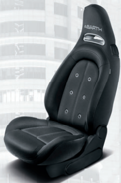
Tissu Abarth noir (de série sur 595)