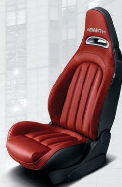
Cuir Abarth rouge (de série sur 595 Turismo)