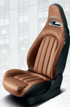
Cuir Abarth marron (de série sur 595 Turismo)