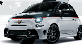
Noir Scorpione / Blanc Gara