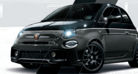
Noir Scorpione / Gris Record