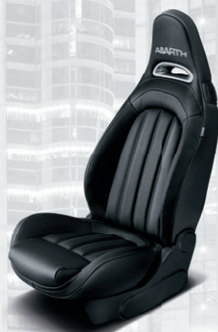
Cuir Abarth noir (de série sur 595 Turismo)