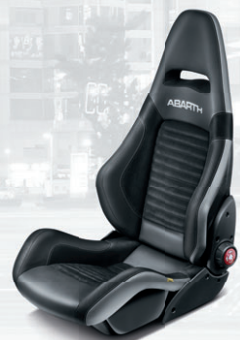
Cuir/Alcantara® Sabelt noir avec coque de siège en carbone