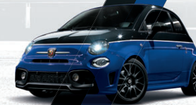
Noir Scorpione / Bleu Podio