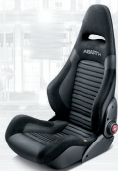
Tissu Sabelt noir (de série sur 595 Competizione)