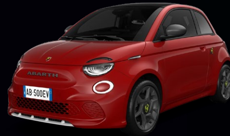
111 ROUGE ADRÉNALINE* 850 €