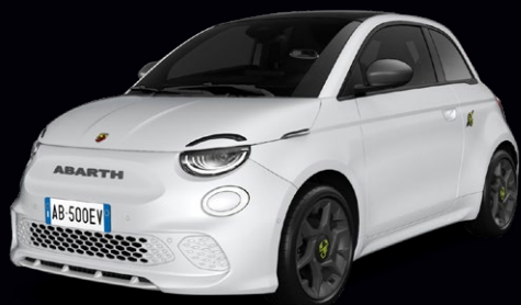
NOUVELLE ABARTH 500e PACK