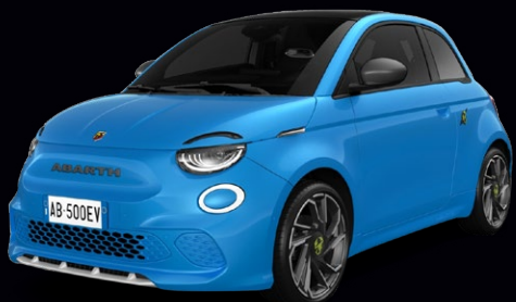
NOUVELLE ABARTH 500e TURISMO