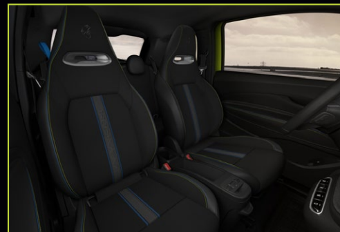
869 / 872 Tissu en technoprène avec logo Scorpion brodé