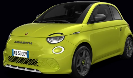
878 VERT ACIDE Gratuit