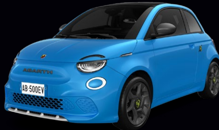
877 BLEU POISON* 850 €