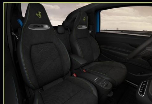
804 / 805 Sport Cuir et Alcantara®