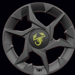
OR2 JANTES ALLIAGE 17"