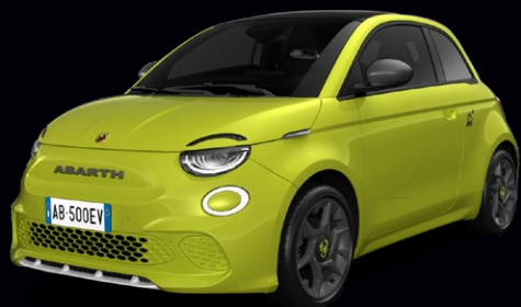
NOUVELLE ABARTH 500e