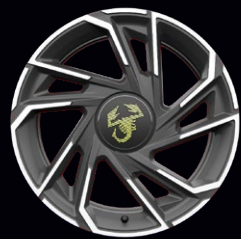
OR4 JANTES ALLIAGE 18" GRIS TITANE DIAMANTÉES