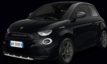
601 NOIR VENOM* 850 €