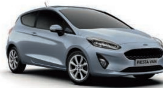
Bleu Freedom Peinture métallisée*