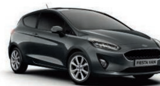
Gris Magnetic Peinture métallisée*