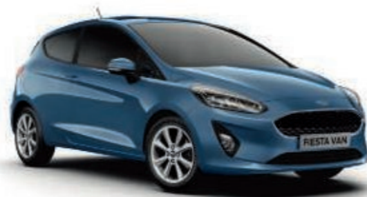
Bleu Azur Peinture métallisée*