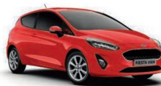
Rouge Racing Peinture non métallisée