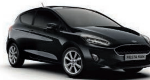
Noir Agathe Peinture métallisée*