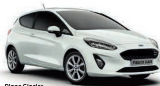
Blanc Glacier Peinture non métallisée