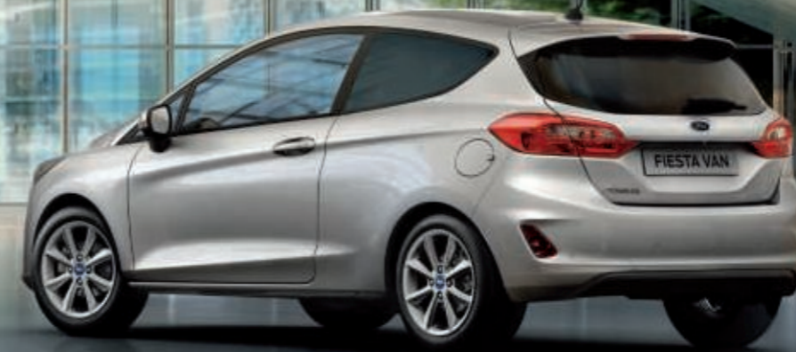
Fiesta Affaires Business avec peinture métallisée Gris Lunaire (option) et jantes alliage 15", 8 branches (option).