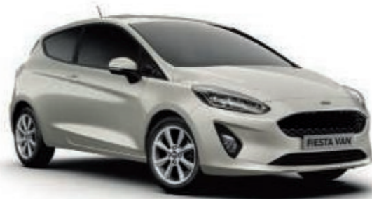
Blanc Metropolis Peinture métallisée*