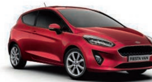
Rouge Candy Peinture métallisée spéciale*