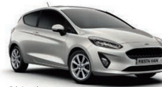
Gris Lunaire Peinture métallisée*