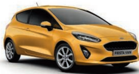
Jaune Luxe Peinture métallisée*