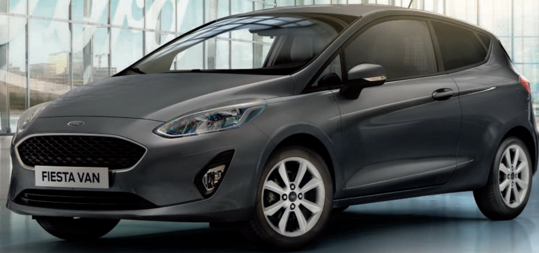
Fiesta Affaires avec peinture métallisée Gris Magnetic (option) et jantes alliage 15" à 8 branches (option).