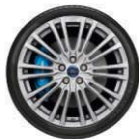
Jantes alliage de série