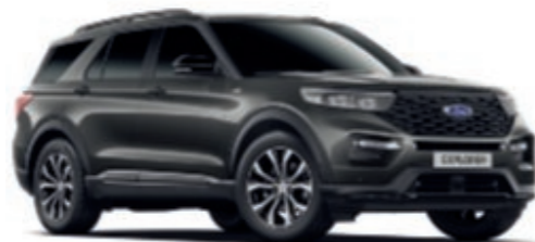
Gris Magnetic Peinture métallisée*