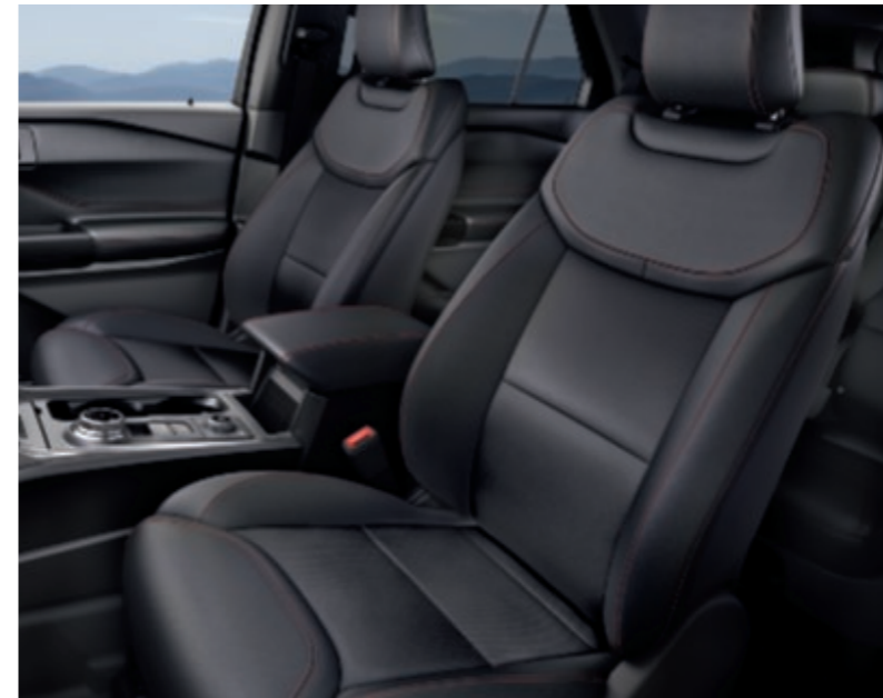
Sellerie cuir noir Salerno micro-perforé avec surpiqûres rouges (De série sur ST-Line)

L'élégance et la qualité s'unissent pour vous donner le meilleur au sein du Nouveau Ford Explorer. L'aspect et la sensation au toucher des matériaux de très haute facture vous permettront d'apprécier pleinement l'habitacle aux dimensions généreuses, que vous vous trouviez assis derrière le volant ou installé aux places passagers.