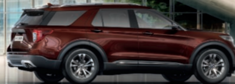
Ford Explorer Platinum , teinte métallisée Fahion Brun Cuivré (en option) avec jantes en alliage 20 pouces finition Dark Tarnish (de série).

Scannez les QR codes pour accéder aux contenus supplémentaires.