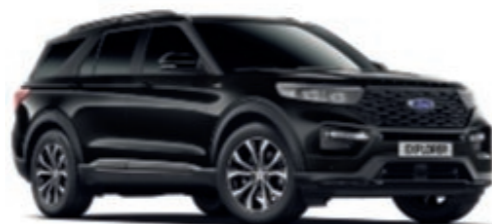
Noir Agate Peinture métallisée*