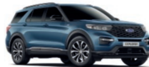
Bleu Chrome Peinture métallisée*