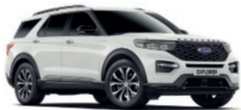
Blanc Oxford † Peinture non métallisée