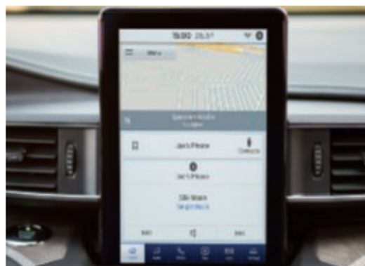
Écran tactile LCD TFT de 10,1 pouces en format portrait