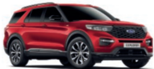
Rouge Lucid Peinture de carrosserie métallisée Fashion*