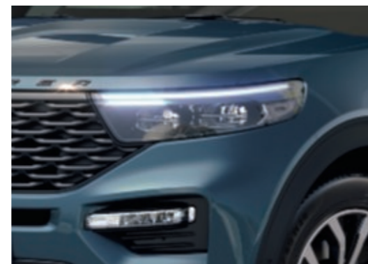
Phares à LED sport - contours noirs