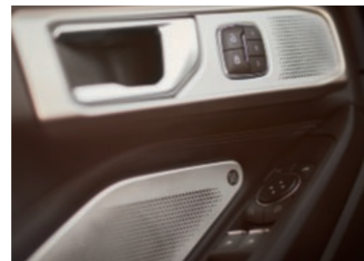
Système audio B&O avec 14 haut-parleurs (980 watts)