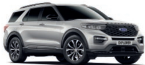
Gris Iconic Peinture métallisée*