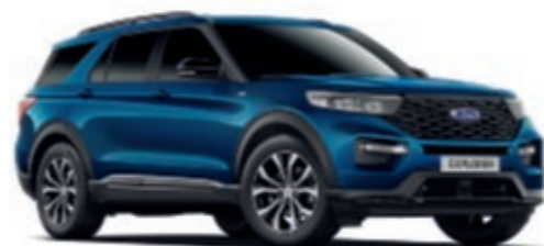
Bleu Atlas † Peinture métallisée*