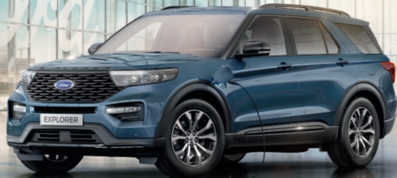
Ford Explorer ST-Line , teinte métallisée Bleu Azur (en option) avec jantes en alliage 20 pouces finition Noir Brillant (de série).