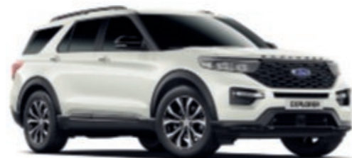
Blanc Star Peinture métallisée Premium*