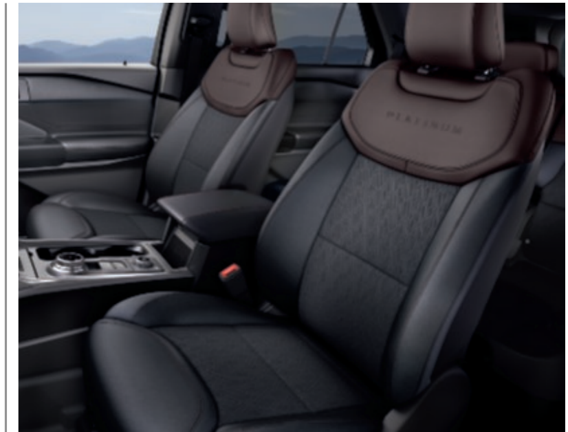
Sellerie cuir noir Geneva & Brunello à motifs Platinum (De série sur Platinum)