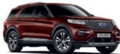
Brun Cuivré # Peinture de carrosserie métallisée Fashion*