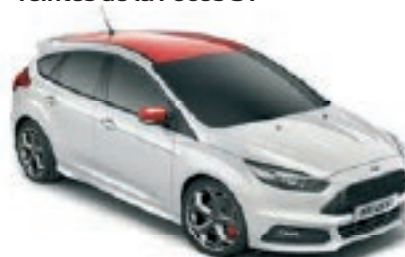
Blanc Glacier Peinture non métallisée Avec toit contrasté et coques de rétroviseurs Rouge Racing