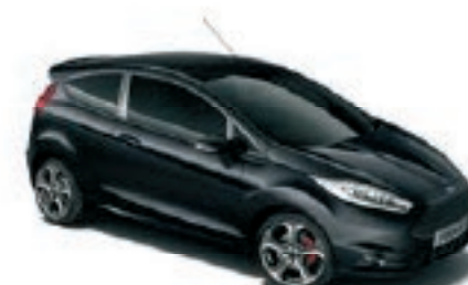
Noir Shadow Peinture Mica