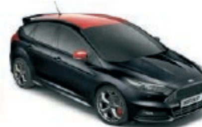
Noir Shadow Peinture Mica Avec toit contrasté et coques de rétroviseurs Rouge Racing