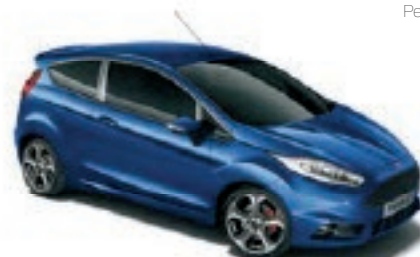
Bleu Performance Peinture métallisée spéciale