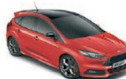
Rouge Racing Peinture non métallisée Avec toit contrasté et coques de rétroviseurs Noir Shadow