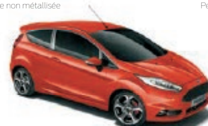
Molten Orange Peinture métallisée spéciale

Note : Certaines peintures sont en option. Se référer au tarif en vigueur ou au site www.ford.fr