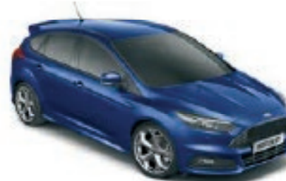
Bleu Impact Peinture métallisée