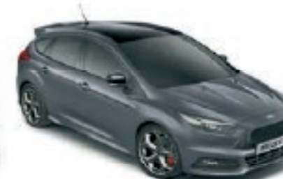
Gris Stealth Peinture non métallisée Avec toit contrasté et coques de rétroviseurs Noir Shadow