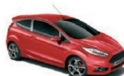
Rouge Racing Peinture non métallisée