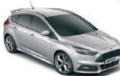
Gris Lunaire Peinture métallisée