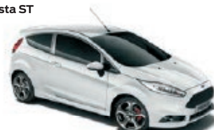
Blanc Glacier Peinture non métallisée