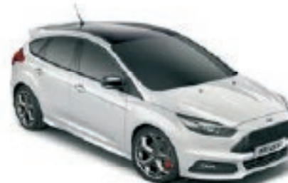
Blanc Glacier Peinture non métallisée Avec toit contrasté et coques de rétroviseurs Noir Shadow