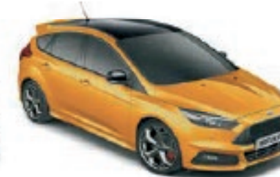
Tangerine Scream Peinture métallisée trois couches Avec toit contrasté et coques de rétroviseurs Noir Shadow