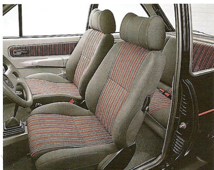
Sièges baquet, appuis tête réglables.

Laissez-vous étonner par la nouvelle Fiesta XR2. Cette petite boule de nerfs