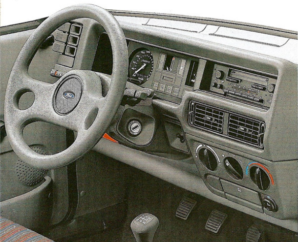
Volant sport, tableau de bord fonctionnel, radio-cassette en option.