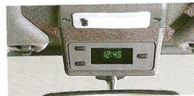
Montre analogique multifonctions

Comme toutes les Fiesta, la nouvelle XR2 est une vraie quatre places avec beaucoup d'espace à l'avant comme à l'arrière. Pour vous donner plus de place encore, les sièges arrière se rabattant asymétriquement et découvrant un coffre de près d'1m 3 .