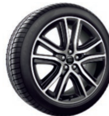
20" Jantes alliage 5x2 branches Indisponibles