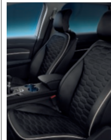
Cuir perforé premium Windsor Ebony (Sur Vignale)