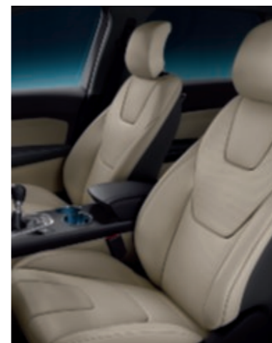
Cuir micro perforé Salerno (Non disponible)