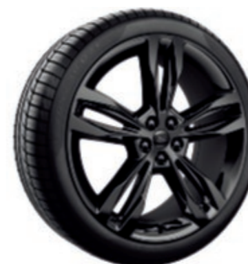
21" Jantes alliage 5x2 branches noires De série sur ST-Line (Montage avec pneus 265/40)