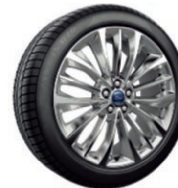
20" Jantes alliage 5x3 branches De série sur Vignale (Montage avec pneus 255/45)