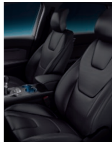
Cuir micro perforé Salerno (Non disponible)