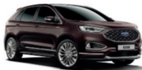
Ametista Scura ®