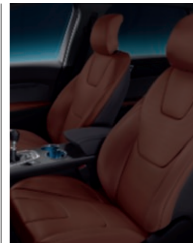
Cuir micro perforé Salerno (Non disponible)