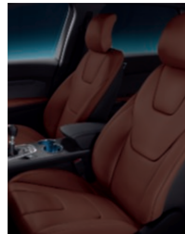
Cuir Salerno (Non disponible)