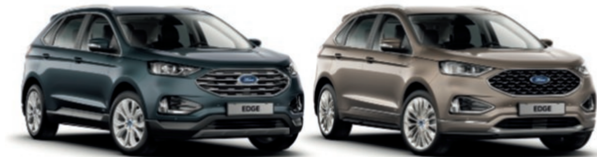
Titanium (non disponible)

Disponible en deux versions aux personnalités bien marquées, quelle que soit votre préférence, il y a un Nouveau Ford Edge qui vous convient.