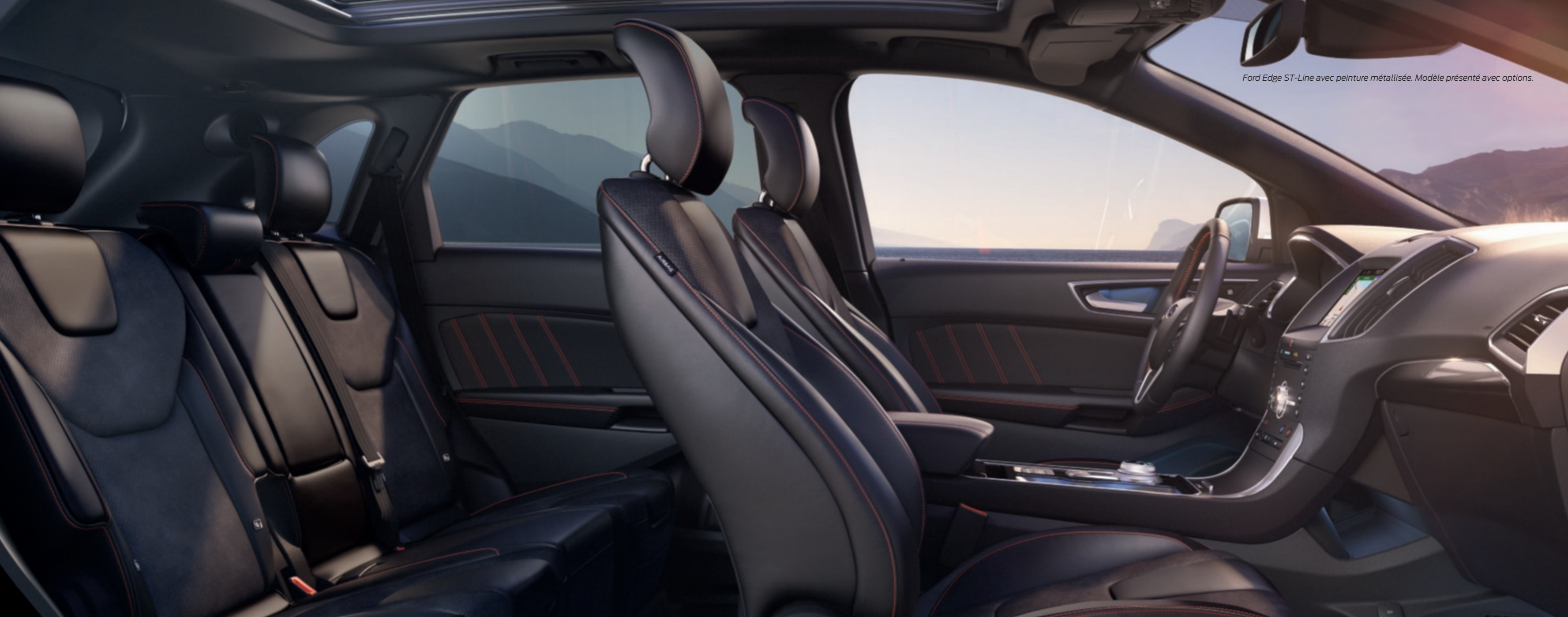
Ford Edge ST-Line avec peinture métallisée. Modèle présenté avec options.