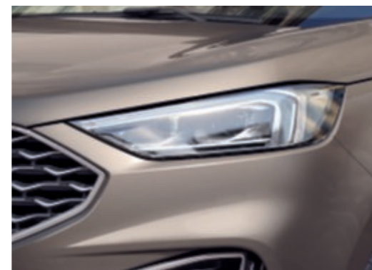
Phares adaptatifs Bi-LED avec fonction anti-éblouissement