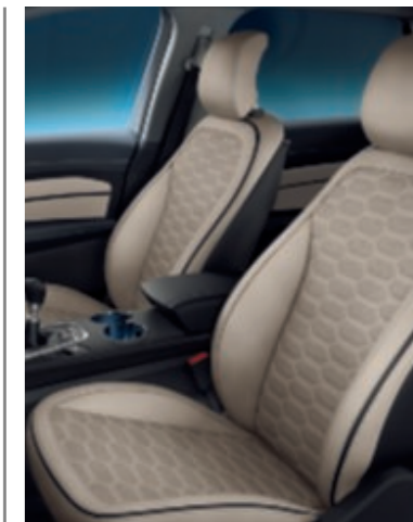
Cuir perforé premium Windsor Cashmere (Sur Vignale)