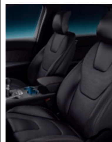
Cuir Salerno / suédine perforée Miko Ebony (De série sur ST-Line)