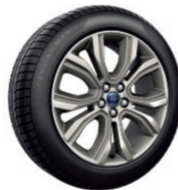
19" Jantes alliage 5x2 branches Indisponibles