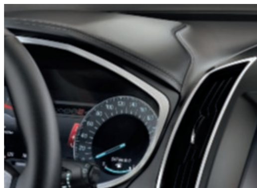
Tableau de bord garni de cuir