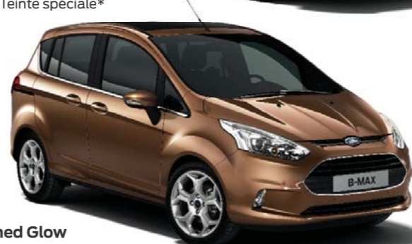
Burnished Glow Teinte spéciale*