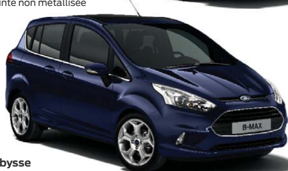
Bleu Abysses Teinte non métallisée