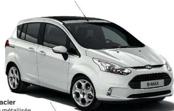
Blanc Glacier Teinte non métallisée