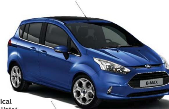
Bleu Nautical Teinte métallisée*