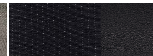
Titanium Garnissage des renforts latéraux Cuir*Torino, teinte Ebony* Garnissage des sièges Tissu New York, teinte Ebony*