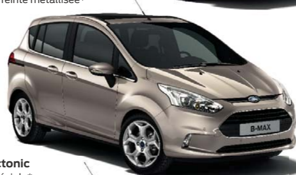
Gris Tectonic Teinte spéciale*