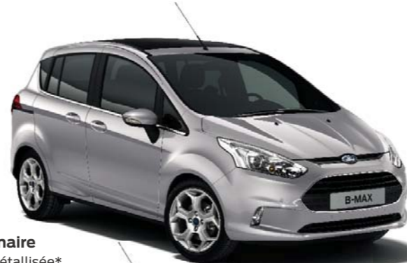
Gris Lunaire Teinte métallisée*