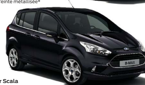
Noir Scala Teinte métallisée*

*Peintures métallisées et garnissages cuir/ou cuir*/tissu disponibles en option moyennant supplément, hormis la sellerie cuir* de série sur la finition Titanium X. *Retrouvez sur www.ford.fr plus de détails sur le cuir utilisé dans nos véhicules. Le Ford B-MAX est couvert par la garantie antiperforation Ford pendant 12 ans à compter de la date de livraison effective au client. Certaines conditions s'appliquent. Remarque : Les images utilisées ont pour seul but d'illustrer les teintes de carrosserie et peuvent ne pas correspondre aux spécifications réelles. Les teintes et garnissages visibles dans cette brochure peuvent être différents des teintes réelles du fait des limites des processus d'impression utilisés.