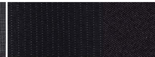
Titanium Garnissage des renforts latéraux Lux, teinte Ebony Garnissage des sièges New York, teinte Ebony