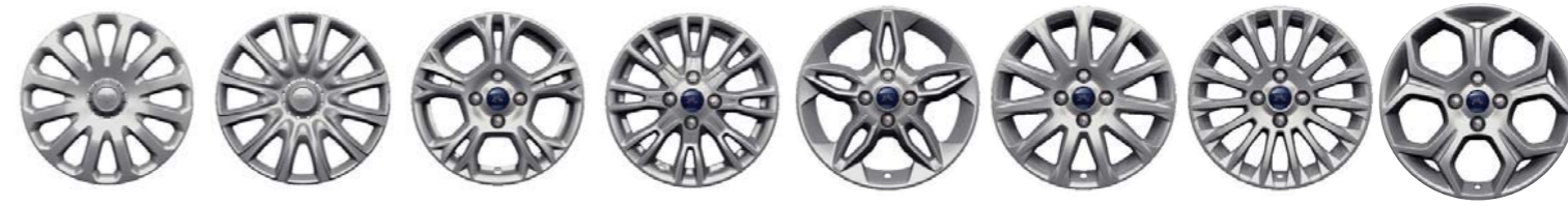
Enjoliveurs 15 pouces 12 branches (Série sur Ambiente) | Enjoliveurs 15 pouces 12 branches (Série sur Trend) | Jantes alliage 15" 5 branches (Option sur Trend) (Non disponible en France) | Jantes alliage 16" 5 branches (Série sur Titanium X) | Jantes alliage 16" 11 branches (Option sur Trend) | Jantes alliage 16" 15 branches (Série sur Titanium) | Jantes alliage 17" 5 branches (Option sur Titanium et Titanium X)

Quatre niveaux de finition et un large choix de couleurs et de garnissages pour vous permettre de choisir à coup sûr le B-MAX dont vous rêvez.