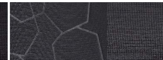
Trend Garnissage des renforts latéraux Gecko, teinte Ebony/Sterling Grey Garnissage des sièges Hexagon, teinte Sterling Grey