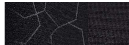
Ambiente et Trend Garnissage des renforts latéraux Gecko, teinte Ebony Garnissage des sièges Hexagon, teinte Ebony