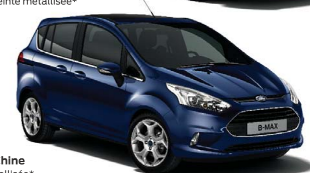
Bleu de Chine Teinte métallisée*