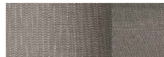
Titanium Garnissage des renforts latéraux Lux, teinte Medium Light Stone Garnissage des sièges New York, teinte Medium Light Stone