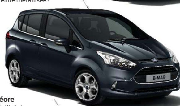
Gris Météore Teinte métallisée*