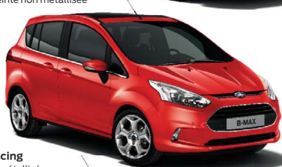
Rouge Racing Teinte non métallisée