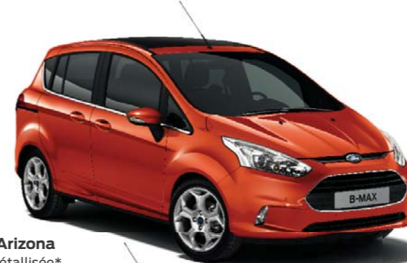
Rouge Arizona Teinte métallisée*