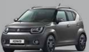
MINERAL GRAY MÉTALLISÉE