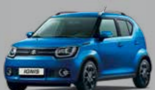
SPEEDY BLUE MÉTALLISÉE