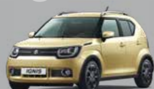
HELIOS GOLD PEARL MÉTALLISÉE