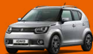
PREMIUM SILVER MÉTALLISÉE