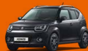
SUPER BLACK PEARL MÉTALLISÉE