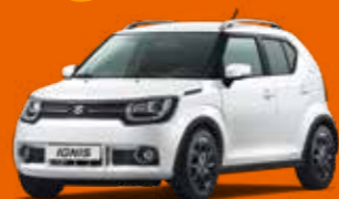
PURE WHITE PEARL MÉTALLISÉE