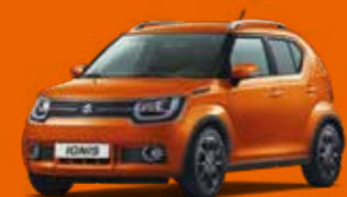
FLAME ORANGE PEARL MÉTALLISÉE