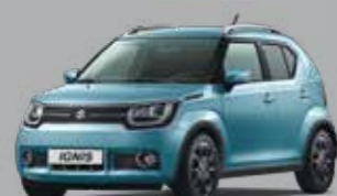
NEON BLUE MÉTALLISÉE