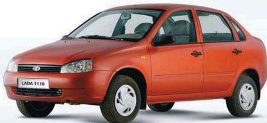
Kalina 4 portes (Non commercialisée)