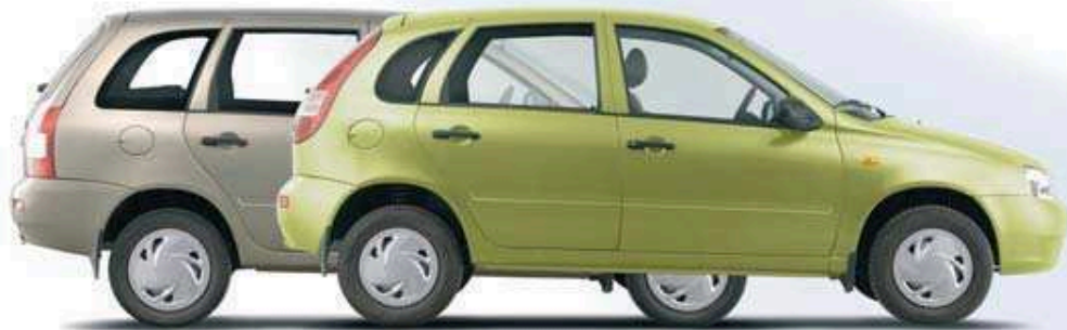
Kalina 5 portes