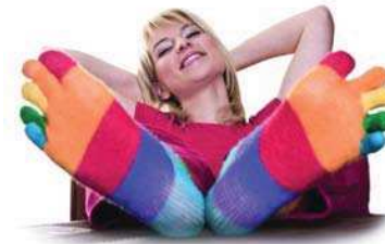
Palette des couleurs