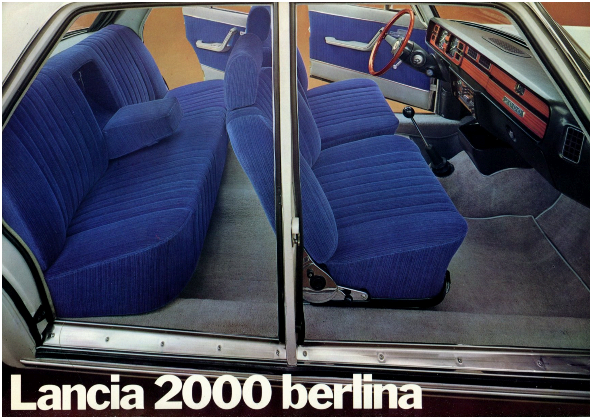
Lancia 2000 berlina