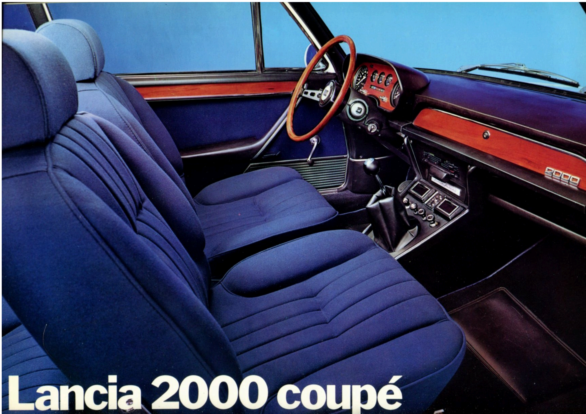
Lancia 2000 coupé