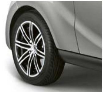
Jantes diamantées 15" en option.