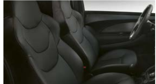
Sellerie «GT» simili cuir avec surpiqûres rouges de série.