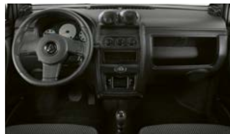
Planche de bord ergonomique, rangements astucieux.