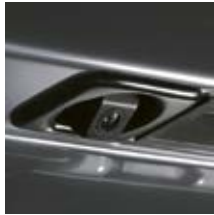
La caméra de recul* sur les tablettes s'enclenche avec la marche arrière.