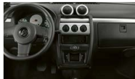
Boîte à gants, porte-gobelet, vide-poches portières et central.