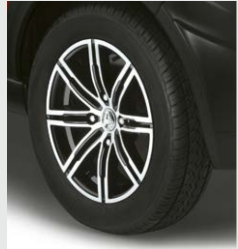
Jantes diamantées 15" en option

Le break adopte un style puissant. Crossline Premium présente une habitabilité confortable et fonctionnelle. Le pavillon surélevé assure un confort supplémentaire et offre à Crossline une habitabilité audacieuse. La garde au sol rehaussée et les roues à flancs hauts invitent à l'aventure. Crossline est prêt à suivre vos instincts de baroudeur. La finition Premium arbore des finitions soignées grâce au pack chrome.