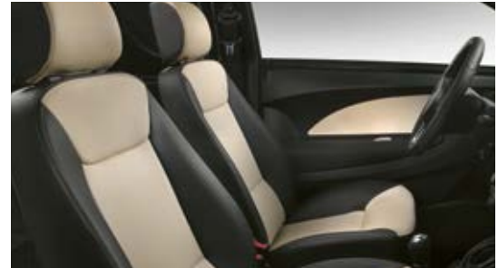
Sellerie simili cuir bicolore noir/ivoire de série.