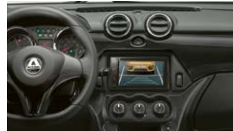
Inserts décoratifs « carbone look » en option.

(4) Exemple de LLD* d'une City GTO, hors options sur 48 mois et 30 000 km, 1 er loyer de 2248 € et 47 loyers mensuels de 170,08 € (Hors assurances et prestations facultatives). Après paiement du dernier loyer, vous restituez le véhicule à votre concessionnaire (selon les conditions prévues par votre contrat liées à l'usure et au kilométrage annuel). * Location Longue Durée. Tarif LLD valable sur les prix de vente de l'année 2018. Voir conditions auprès de votre Distributeur en cas de changement de tarif et nouvelles dispositions légales.