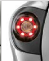
PHARES ARRIÈRE À LED