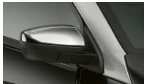
Coque de rétroviseur chromé (en option).