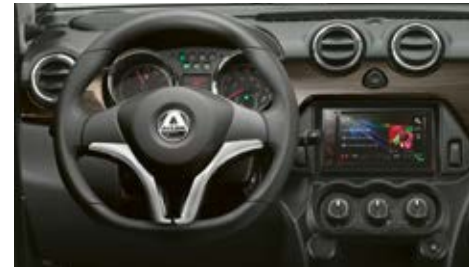
Volant à pan plat et inserts décoratifs « bois d'ébène noir ».