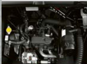
NOUVELLE MOTORISATION KUBOTA CERTIFIÉE EURO 4