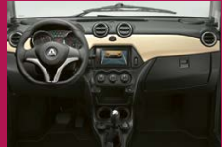
PLANCHE DE BORD ÉTUDIÉE

(10) Exemple de LLD* d'un Crossline PREMIUM GT avec ABS, hors options, sur 48 mois et 30 000 km, 1 er loyer de 2 248 € et 47 loyers mensuels de 207,64 € (Hors assurances et prestations facultatives). Après paiement du dernier loyer, vous restituez le véhicule à votre concessionnaire (selon les conditions prévues par votre contrat liées à l'usure et au kilométrage annuel).* Location Longue Durée. Tarif LLD valable sur les prix de vente de l'année 2018. Voir conditions auprès de votre Distributeur en cas de changement de tarif et nouvelles dispositions légales.