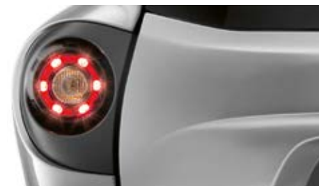
Phares arrière à LED.