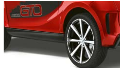
Décoration latérale et jantes GT 16" en option.

170 € 08 10 /MOIS AVEC APPORT OFFRE LLD*