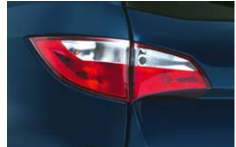
Feux arrière « Horizon ».