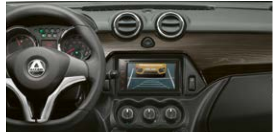
Inserts décoratifs « bois d'ébène noir » en option.