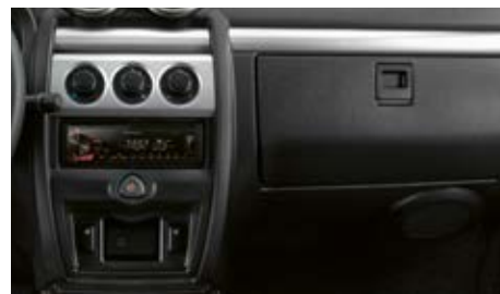
Boîte à gants grande capacité, et autoradio (en option)