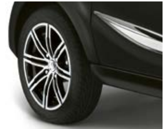
Jantes 15" diamantées en option.

(3) Exemple de LLD* d'une City PREMIUM, hors options sur 48 mois et 30 000 km, 1 er loyer de 2 248 € et 47 loyers mensuels de 158,63 € (Hors assurances et prestations facultatives). Après paiement du dernier loyer, vous restituez le véhicule à votre concessionnaire (selon les conditions prévues par votre contrat liées à l'usure et au kilométrage annuel). * Location Longue Durée. Tarif LLD valable sur les prix de vente de l'année 2018. Voir conditions auprès de votre Distributeur en cas de changement de tarif et nouvelles dispositions légales.