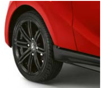
Jantes 15" de série.