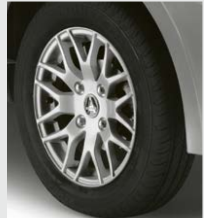
Jantes en option.