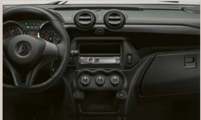
Inserts décoratifs noirs laqués.