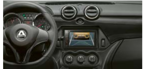
Inserts décoratifs « carbone look » de série.

Bleu marine métallisé Blanc nacré Rouge nacré Noir métallisé Acier mat (en option)