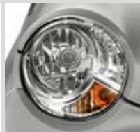
FEUX ET CLIGNOTANTS INTÉGRÉS AUX PROJECTEURS