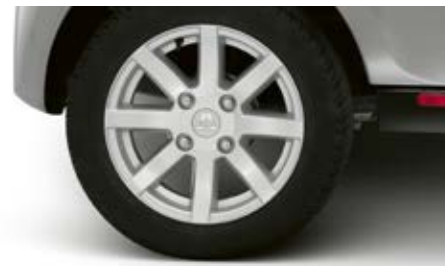
Options jantes alliage 8 branches.