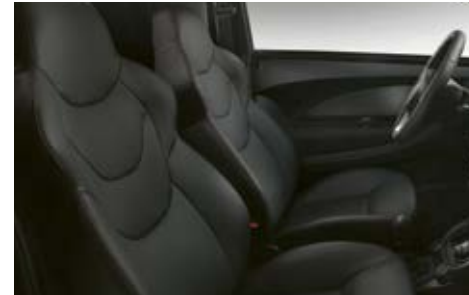
Sellerie "GT" simili cuir avec surpiqûres rouges de série.