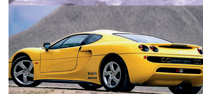
1996 - MEGA MONTE CARLO : supercar sportive destinée à la route et aux 24 heures du Mans