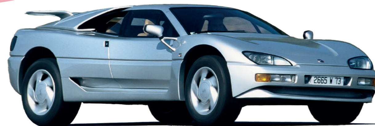
1992 - MEGA TRACK : mastodonte de haute technologie, mélange de 4x4 sportif et d'incroyable Supercar.