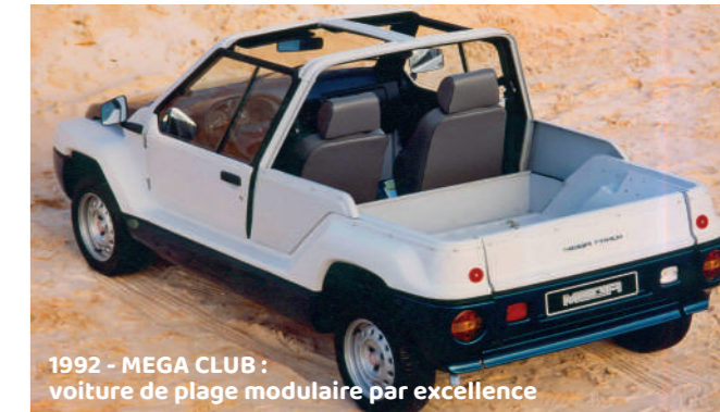
1992 - MEGA CLUB : voiture de plage modulaire par excellence

Le résultat est une vraie marque automobile qui s'appuie sur deux branches : les véhicules de loisirs d'un côté et des véhicules performants et prestigieux de l'autre.