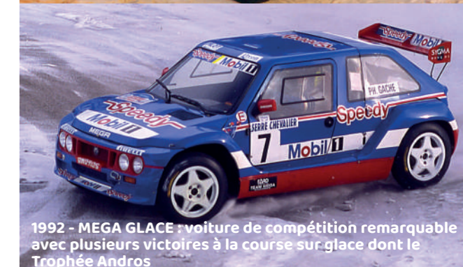
1992 - MEGA GLACE : voiture de compétition remarquable avec plusieurs victoires à la course sur glace dont le Trophée Andros