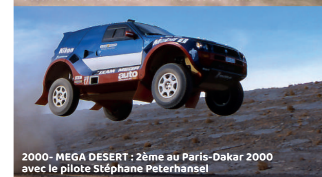
2000 - MEGA DESERT : 2ème au Paris-Dakar 2000 avec le pilote Stéphane Peterhansel