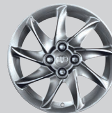
Jante alliage 15" & 16" Podium - Argentée

Les 2 modèles de jantes ci-contre nécessitent un grand centre de roue et un cerclage. Harmonisez vos jantes à la couleur de votre carrosserie et ajoutez d'esthétiques centres de roues qui distingueront votre Yaris.