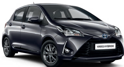
Gris Atlas* (1G3) ▼