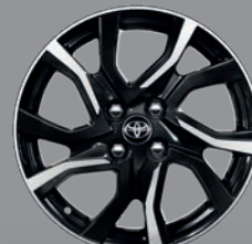
Jante alliage 16" Washiba Yaris Hybride Collection