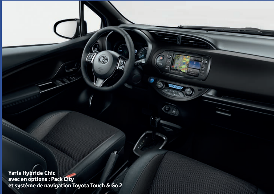
Yaris Hybride Chic avec en options : Pack City et système de navigation Toyota Touch & Go 2