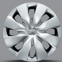
Enjoliveur 14" Kantó Yaris Essence Active