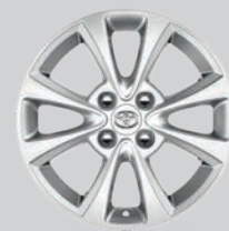
Jante alliage 15" 4 double branches argentée