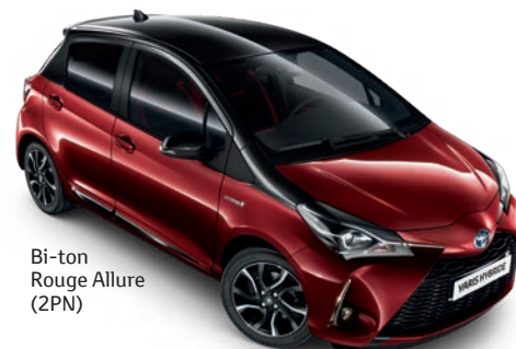
Bi-ton Rouge Allure (2PN)

Modèles présentés : Yaris Collection Hybride.