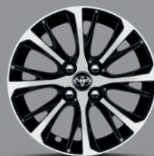
Jante alliage 15" Nagano Yaris Essence Design