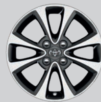
Jante alliage 15" 4 double branches noir mat usiné