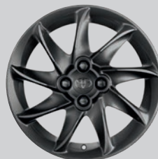
Jante alliage 15" & 16" Podium - Anthracite