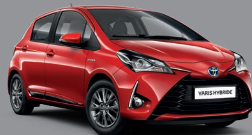
Rouge Chilien* (3P0)