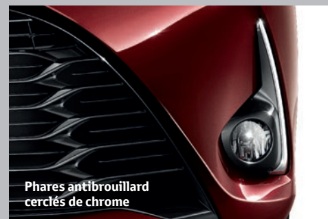
Phares antibrouillard cerclés de chrome