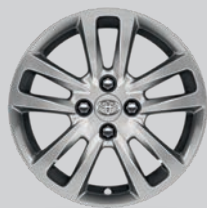
Jante alliage 15" Selena gris aluminium