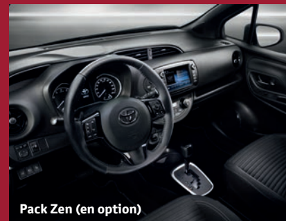
Pack Zen (en option)