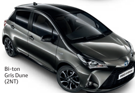
Bi-ton Gris Dune (2NT)