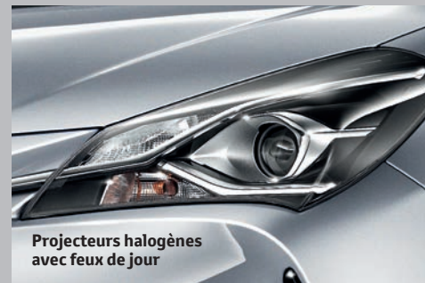
Projecteurs halogènes avec feux de jour