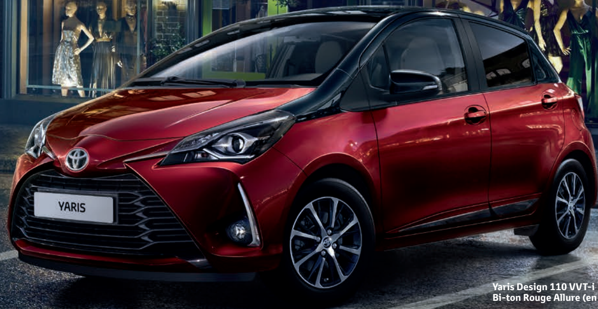
Yaris Design 110 VVT-i Bi-ton Rouge Allure (en option)