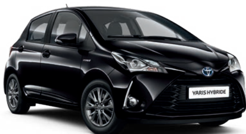
Noir Intense* (209) ▼