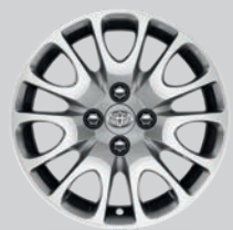
Jante alliage 15" Pavona argentée

Les jantes alliage Toyota disponibles en accessoires donnent à votre Yaris encore plus de personnalité. Ces jantes ont été optimisées pour garantir un poids réduit, une grande résistance et une efficacité à toute épreuve. Les 6 modèles ci-dessous nécessitent un petit centre de roue. Ces ornements sont vendus séparément et sont disponibles dans un large éventail de teintes. Laissez-vous gagner par la couleur !