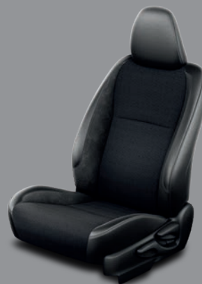
Sellerie noire - tissu, cuir et Alcantara® Yaris Chic