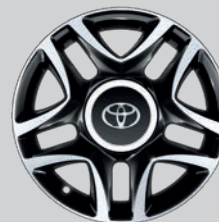
Jante 15" à 5 double branches Noir face polie

Les 2 modèles de jantes ci-contre nécessitent un grand centre de roue et un cerclage. Harmonisez vos jantes à la couleur de votre carrosserie et ajoutez d'esthétiques centres de roues qui distingueront votre Yaris.