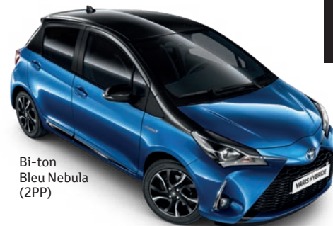
Bi-ton Bleu Nebula (2PP)