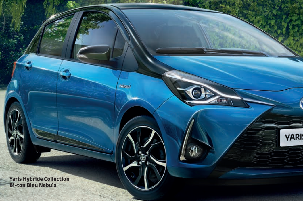
Yaris Hybride Collection Bi-ton Bleu Nebula

Prenez le volant et savourez la douceur de conduite de l'hybride et son incroyable silence.