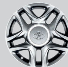
Jante 15" à 5 double branches Gris