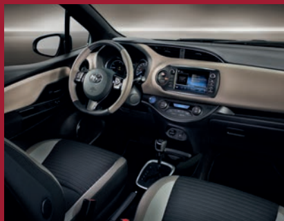
Intérieur Gris Dune Yaris Collection Gris Dune