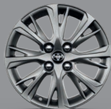
Jante alliage 15" Hokkaido Yaris Hybride Dynamic