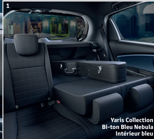
Yaris Collection Bi-ton Bleu Nebula Intérieur bleu

La Toyota Yaris est un modèle compact qui offre une habitabilité et un espace incroyables pour répondre à toutes vos exigences.