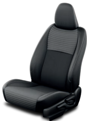
Sellerie tissu - Intérieur noir Yaris Collection Blanc nacré Yaris Collection Gris Manhattan