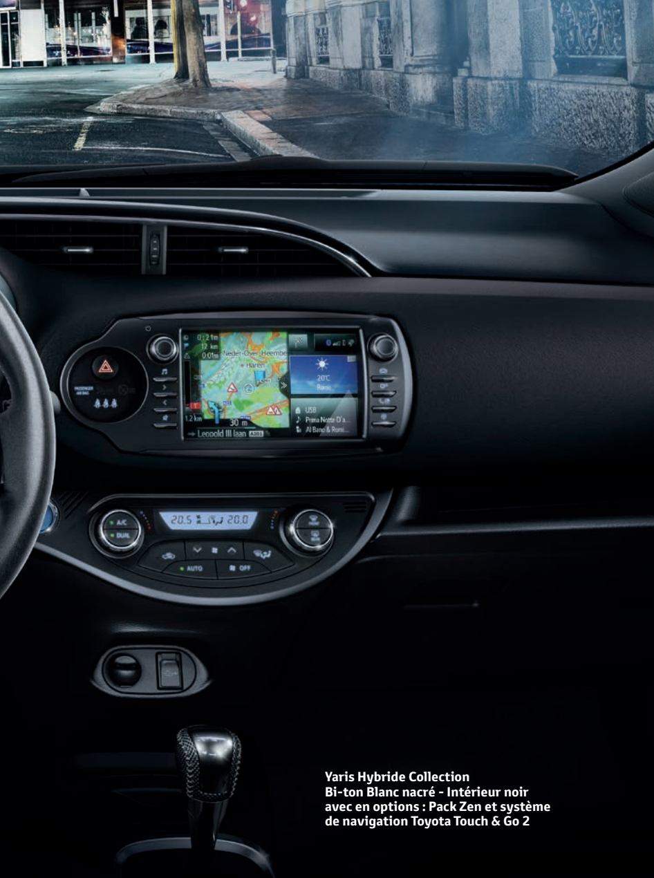
Yaris Hybride Collection Bi-ton Blanc nacré - Intérieur noir avec en options : Pack Zen et système de navigation Toyota Touch & Go 2