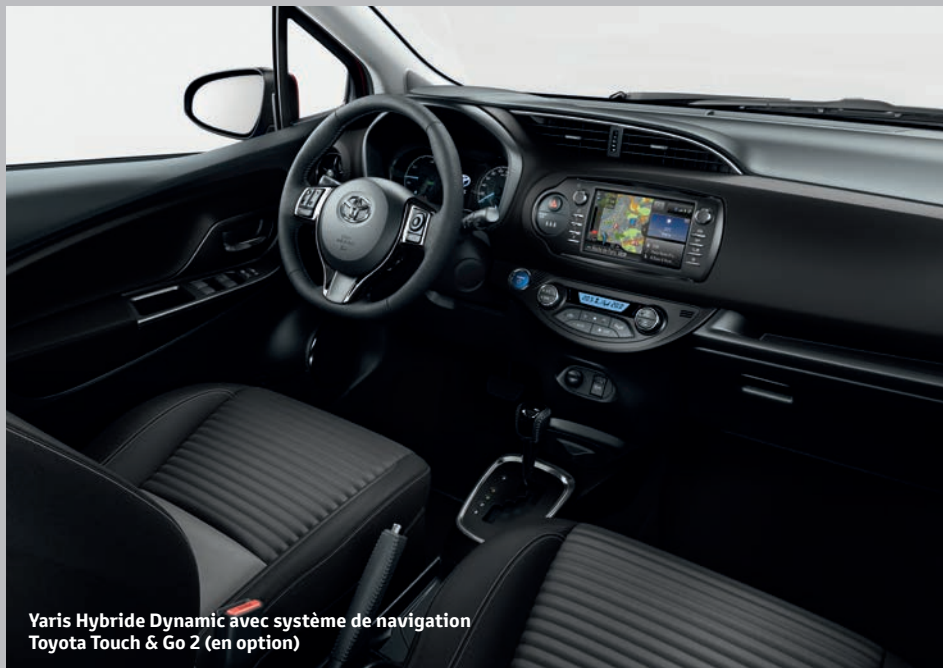
Yaris Hybride Dynamic avec système de navigation Toyota Touch & Go 2 (en option)