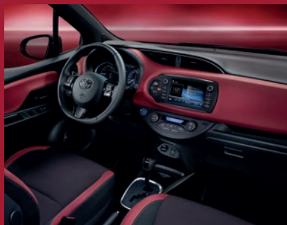
Intérieur rouge Yaris Collection Rouge Allure