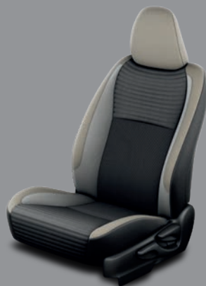
Sellerie tissu - Intérieur Gris Dune Yaris Collection Gris Dune