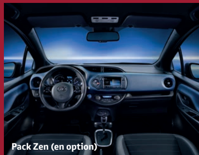
Pack Zen (en option)