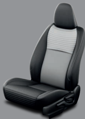
Sellerie tissu Yaris France, Yaris Dynamic et Yaris Design