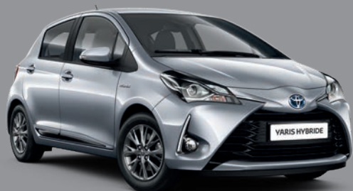
Gris Aluminium* (1F7)

sur Yaris Design Essence (1) et Yaris Collection Hybride (2)