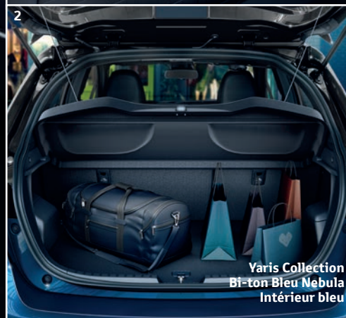
Yaris Collection Bi-ton Bleu Nebula Intérieur bleu

Pour toutes ces occasions où vous devez transporter des objets encombrants, Yaris a la réponse. Sa rangée de sièges arrière se rabat sans effort en quelques secondes, pour laisser toute la place nécessaire à un chargement volumineux.