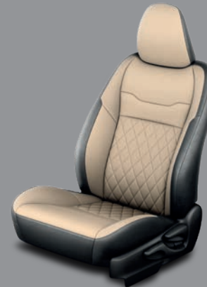
Sellerie cuir intégral En option sur Yaris Chic, Noir Intense, Gris Manhattan et Blanc Nacré uniquement