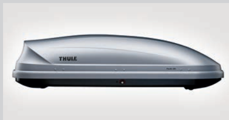
Thule Pacific 700 (gris argenté) - 232 cm L x 74 cm l x 40 cm H