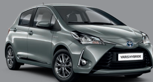
Gris Manhattan* (1H5) ▼