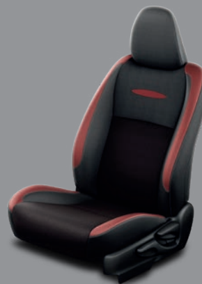
Sellerie tissu - Intérieur rouge Yaris Collection Rouge Allure