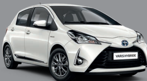
Blanc Nacré* (084) ▼