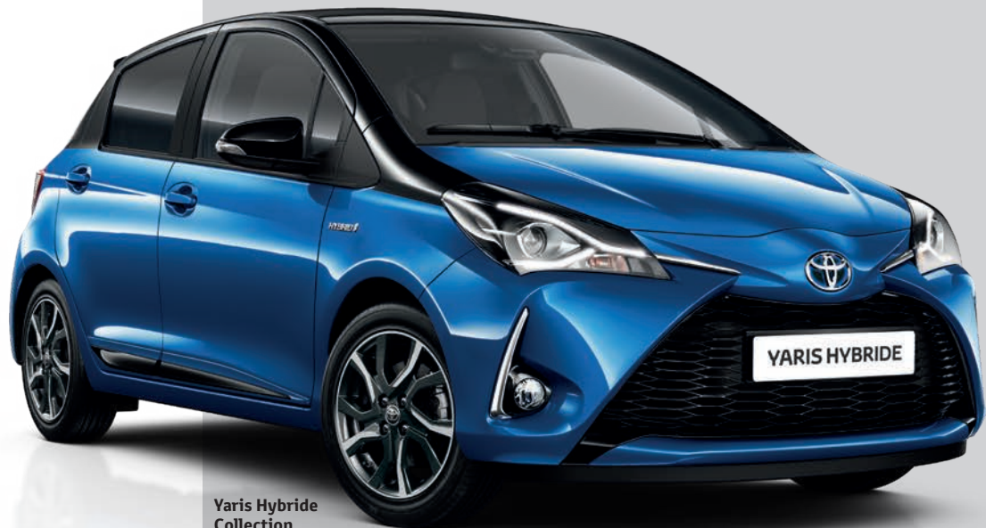
Yaris Hybride Collection Bi-ton Bleu Nebula