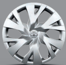
Enjoliveur 15" Kaori Yaris Hybride et Essence France