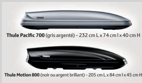
Thule Motion 800 (noir ou argent brillant) - 205 cm L x 84 cm l x 45 cm H