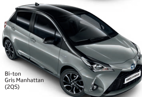
Bi-ton Gris Manhattan (2QS)