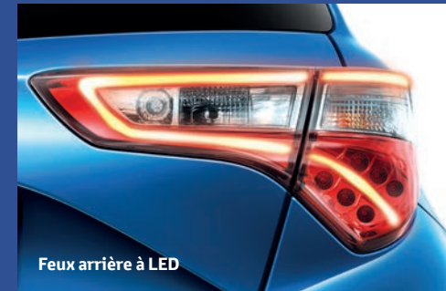
Feux arrière à LED