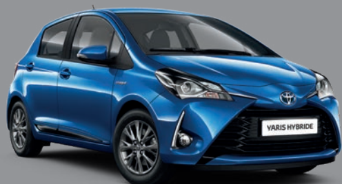
Bleu Nebula* (8X2) ▼