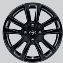
Jante alliage 15" Selena noir brillant