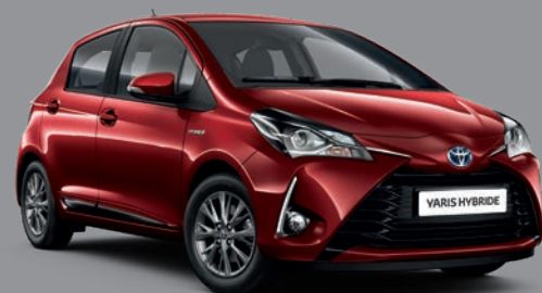
Rouge Allure Nacré* (3T3)