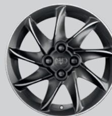
Jante alliage 15" & 16" Podium - Anthracite face polie