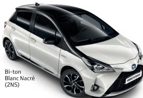
Bi-ton Blanc Nacré (2NS)