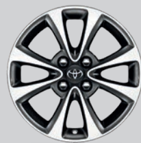
Jante alliage 15" 4 double branches noir brillant usiné