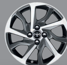
Jante alliage 16" Nara Yaris Hybride Chic