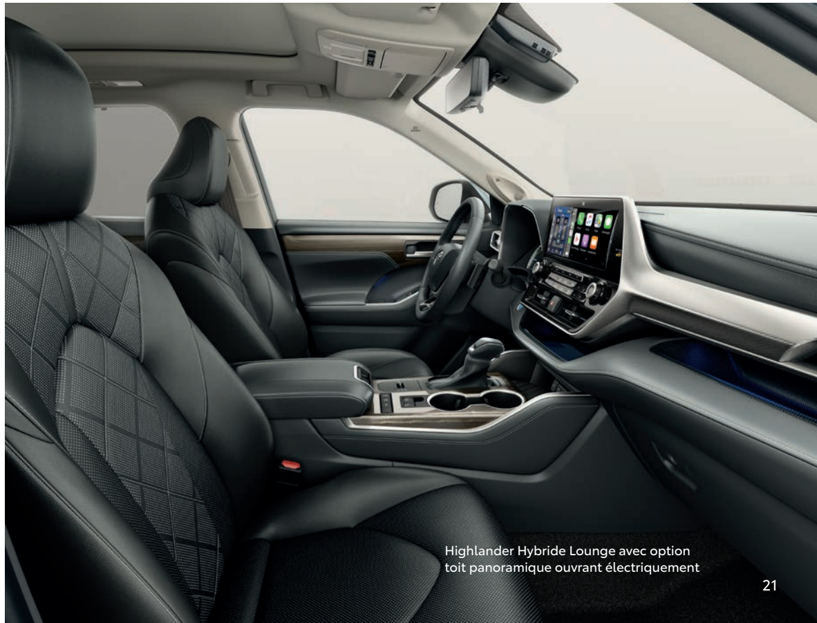
Highlander Hybride Lounge avec option toit panoramique ouvrant électriquement