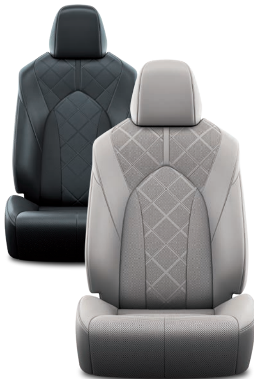
SELLERIE CUIR PERFORÉ NOIR OU GRIS AVEC MOTIF EN LOSANGE LOUNGE