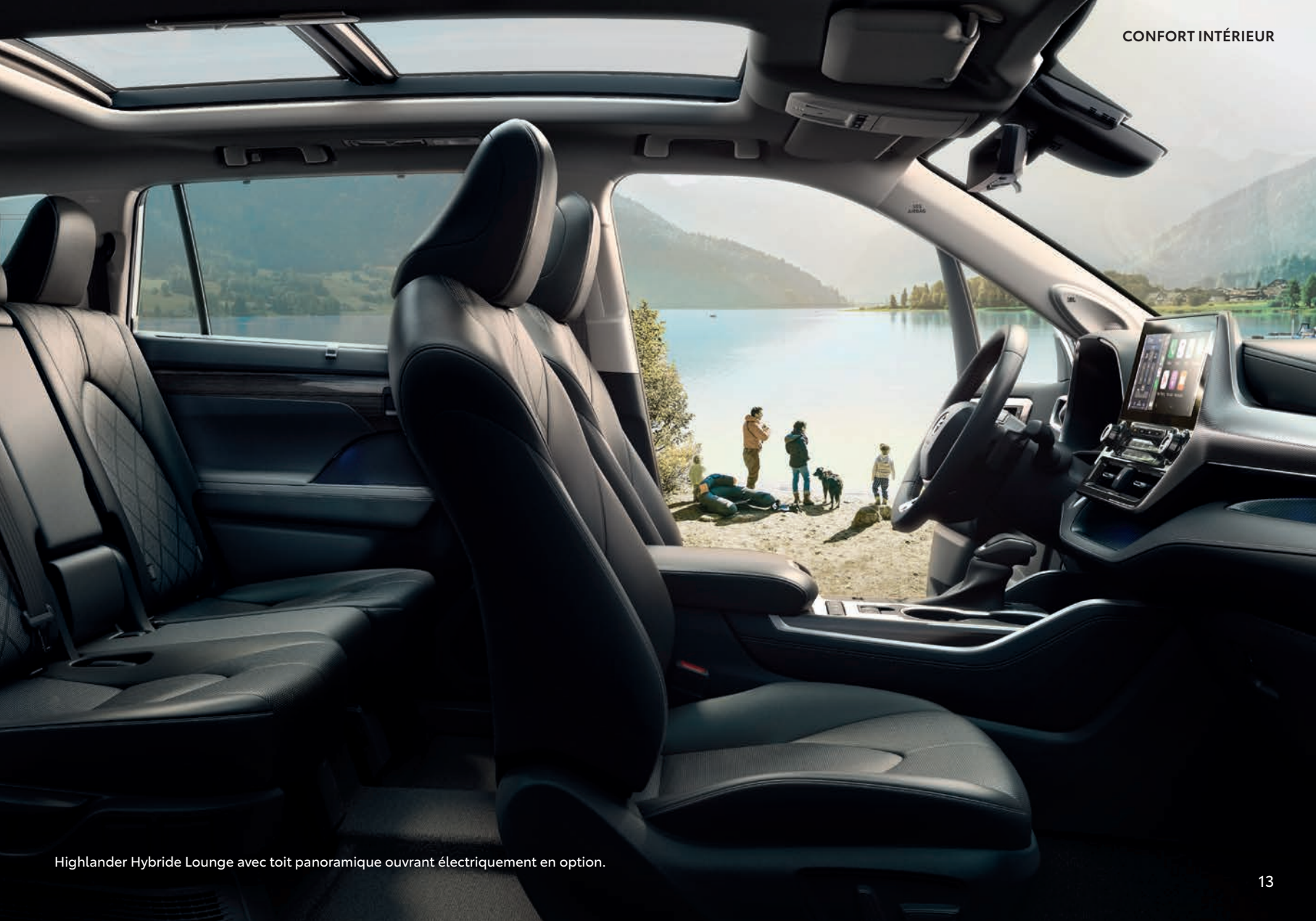
Highlander Hybride Lounge avec toit panoramique ouvrant électriquement en option.