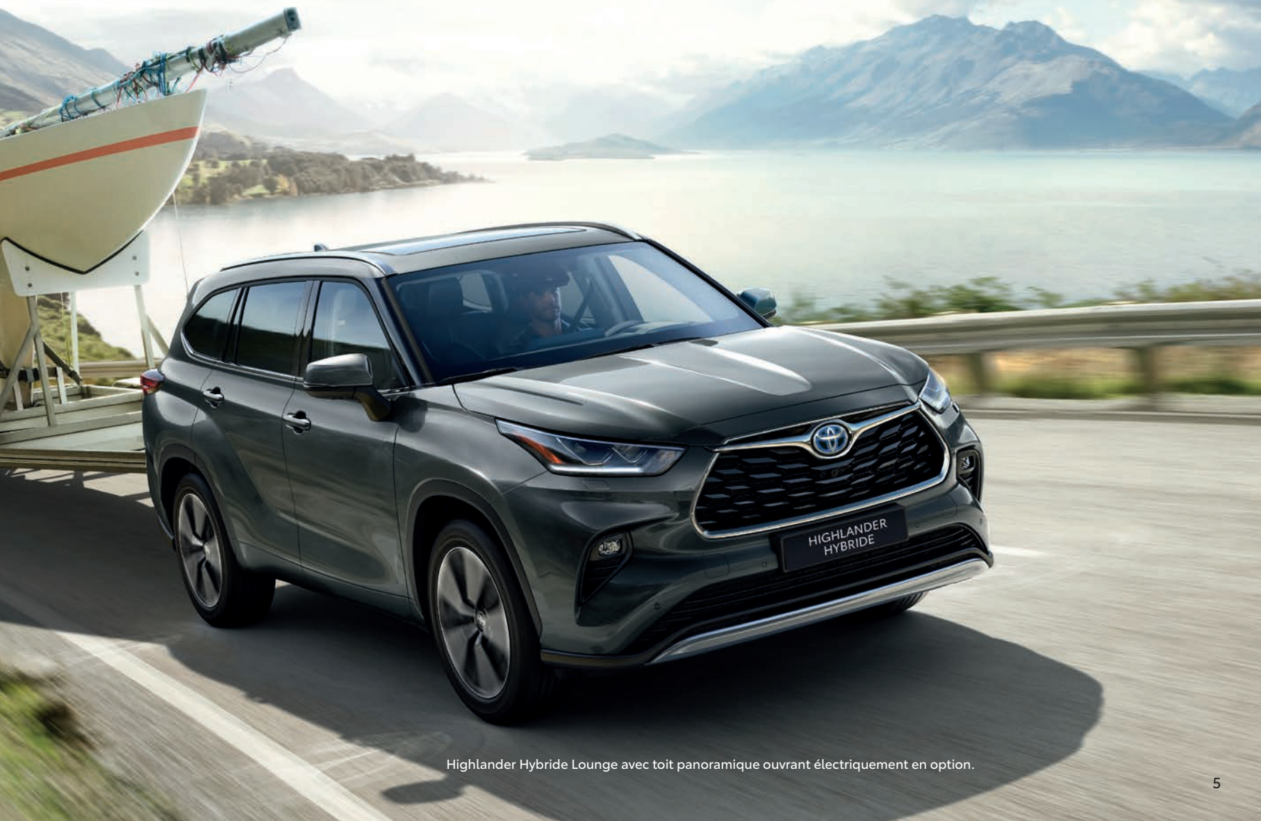
Highlander Hybride Lounge avec toit panoramique ouvrant électriquement en option.