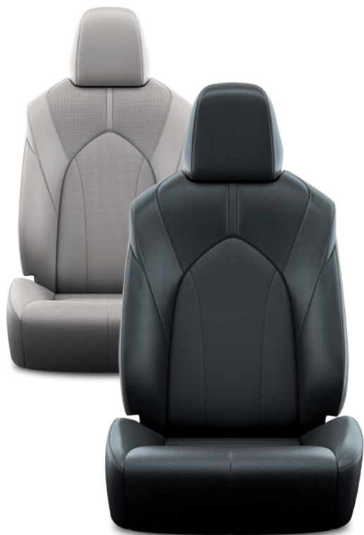
SELLERIE CUIR PERFORÉ NOIR OU GRIS AVEC MOTIF PIQUÉ DESIGN BUSINESS