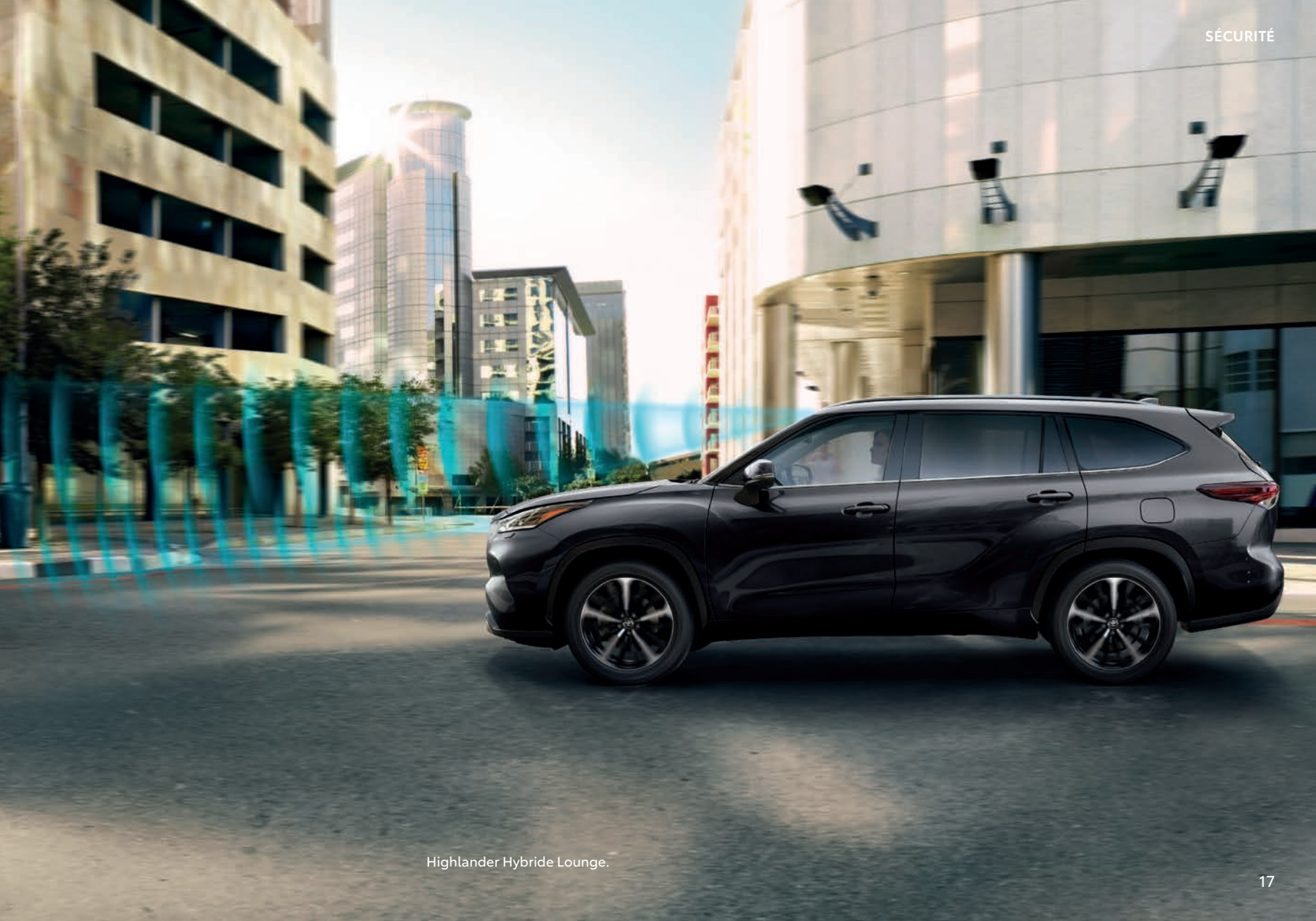
Highlander Hybride Lounge.