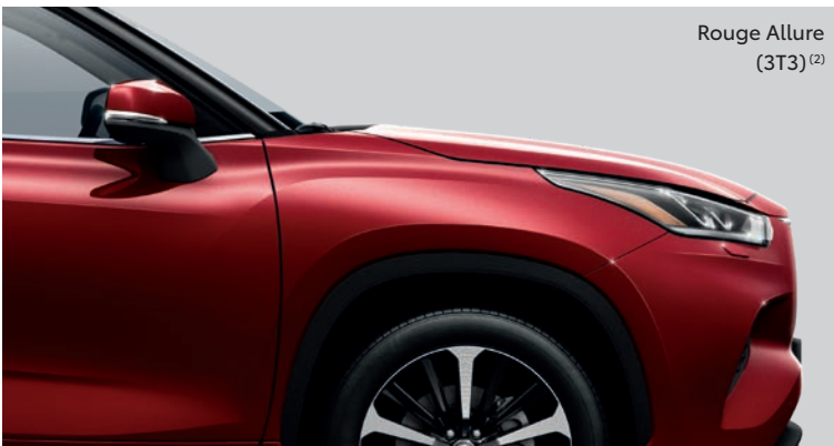
Rouge Allure (3T3) (2)