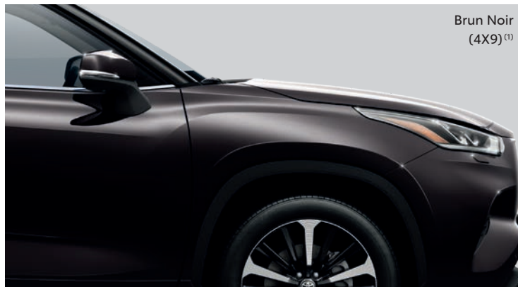
Brun Noir (4X9) (1)