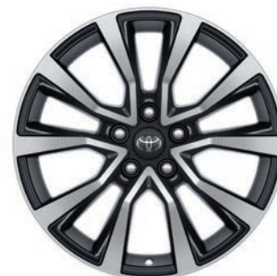
JANTES EN ALLIAGE 18"

En plastique antidérapant avec bords surélevés, il stabilise la position de vos bagages, tout en protégeant la moquette de votre coffre.