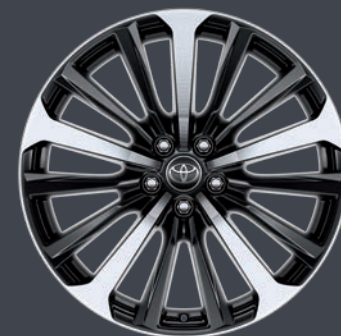
JANTES EN ALLIAGE 20" DAKOTA LOUNGE