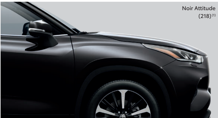
Noir Attitude (218) (1)