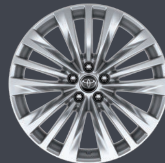
JANTES EN ALLIAGE 20" INDIANA DESIGN BUSINESS