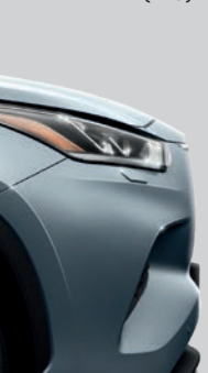
Bleu Horizon (1K5) (2)