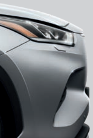
Gris Titane (1J9) (1)