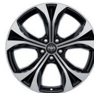
JANTES EN ALLIAGE 20"