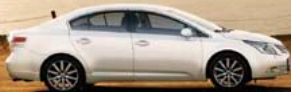
Blanc Pur (040)

10 teintes de carrosserie, quelle est la vôtre ?