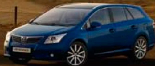
Bleu Pacifique métallisé* (856)