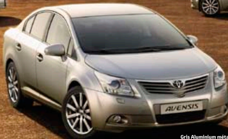
Gris Aluminium métallisé* (1F7)