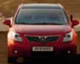
Rouge Persan métallisé* (3R3)