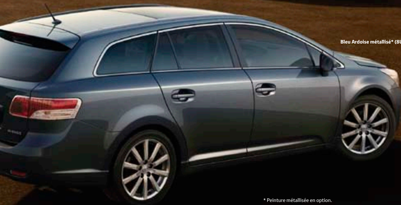
Bleu Ardoise métallisé* (8U5)