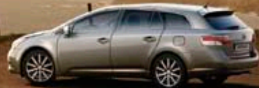
Gris Platine métallisé* (1G6)