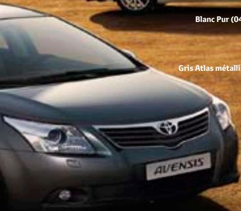
Gris Atlas métallisé* (1G3)