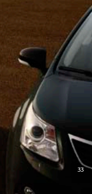
Noir métallisé* (209)