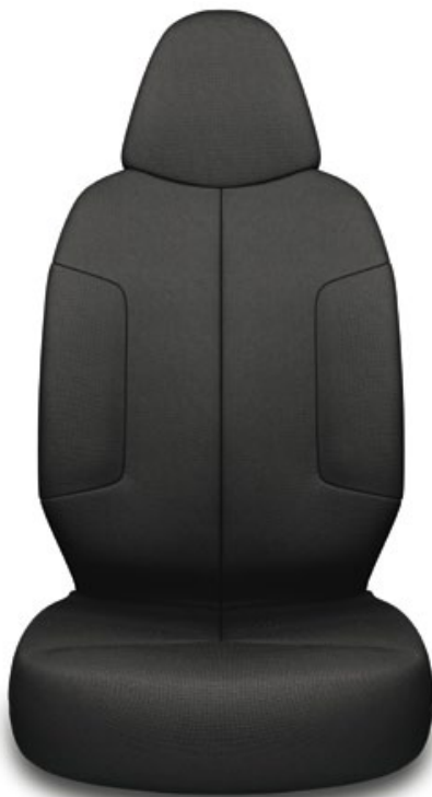
Sellerie tissu Aygo Active.