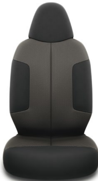
Sellerie tissu Aygo Dynamic.