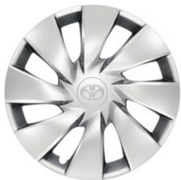
Enjoliveur 14" Aygo Active et Dynamic.