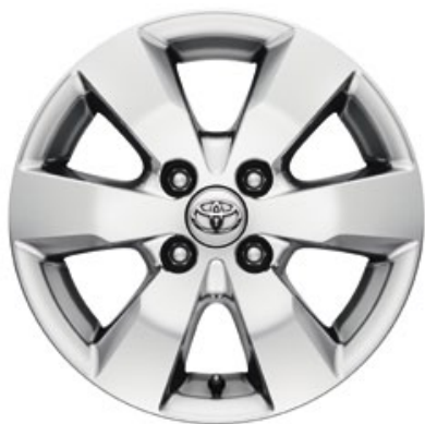
Jante alliage 14" Aygo Style.