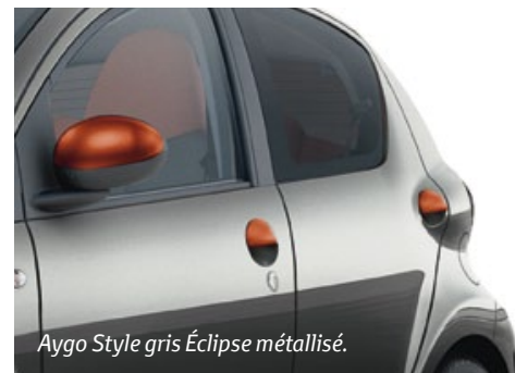
Aygo Style gris Éclipse métallisé.