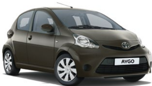
Bronze Clarissimo métallisé* (4T3)