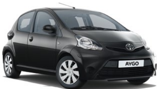
Noir métallisé* (211)