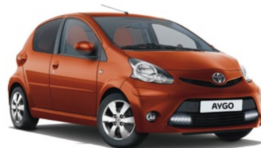
Orange Spice métallisé** (4R8)