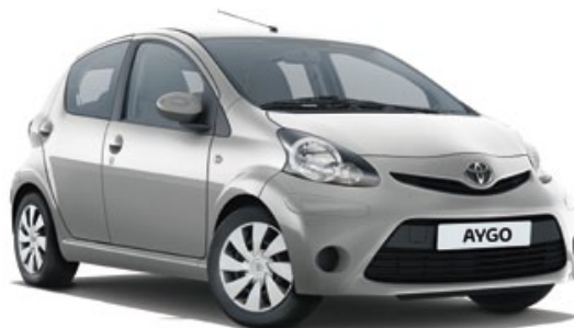
Gris Titane métallisé* (1E7)