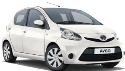
Blanc Pur (068)