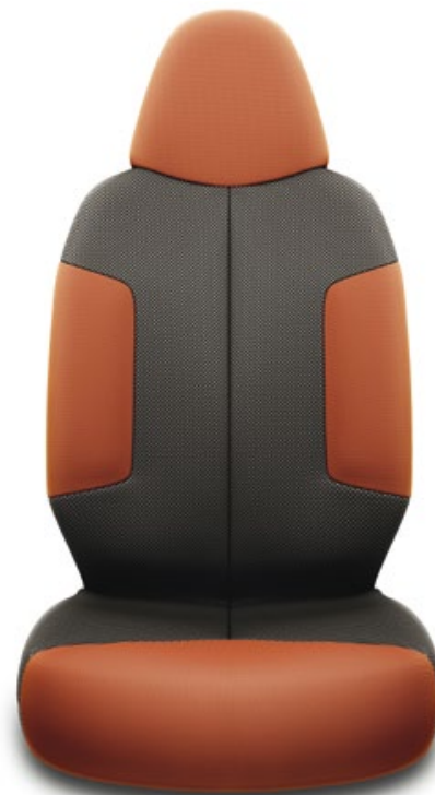
Sellerie tissu Aygo Style.