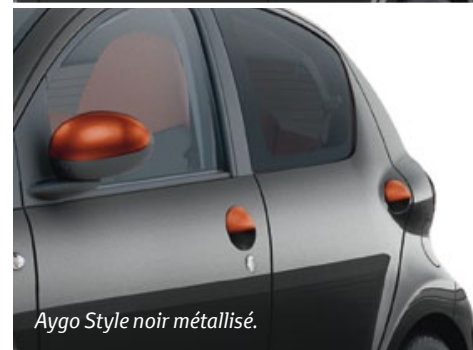
Aygo Style noir métallisé.