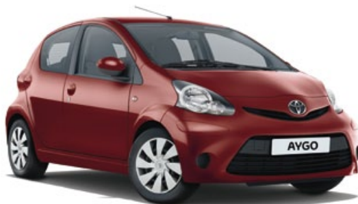
Rouge Chilien (3P0)