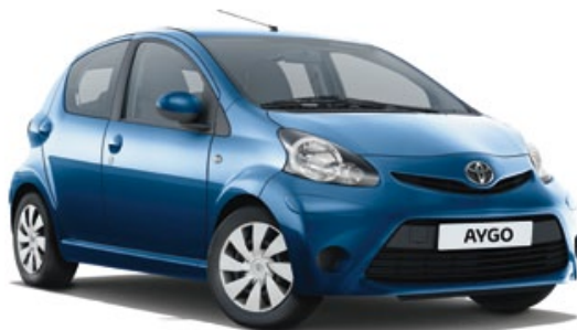
Bleu Comète métallisé* (8U7)