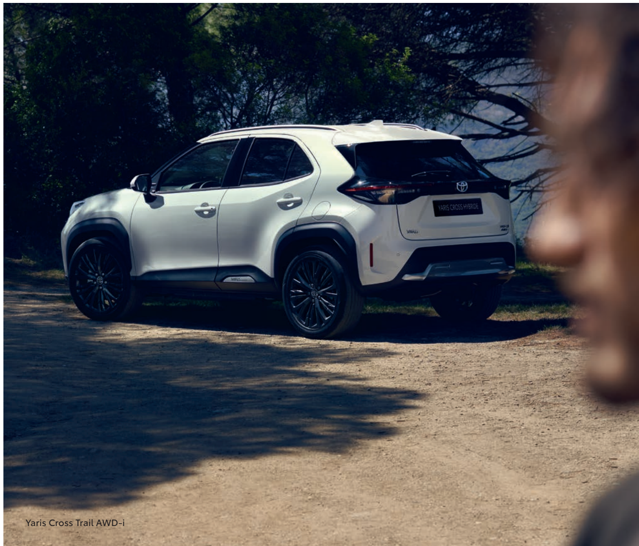
Yaris Cross Trail AWD-i