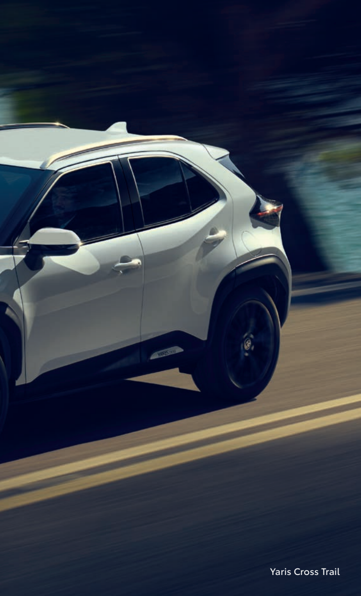
Yaris Cross Trail