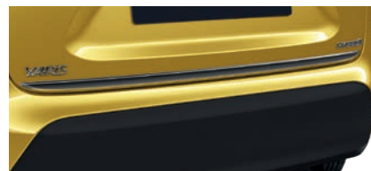
ORNEMENT INFÉRIEUR DE HAYON

Existe en chrome ou en noir (entraîne la suppression du badge AWD-i)