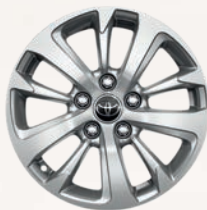
Jantes alliage 16" Yaris Cross Dynamic Business