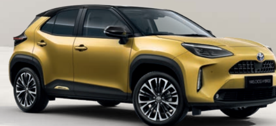
Yaris Cross Collection Or Pur