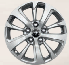
Jantes alliage 16" DYNAMIC BUSINESS