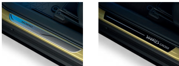
SEUILS DE PORTE AVANT (selon versions)