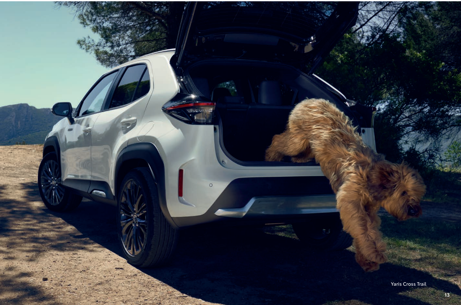
Yaris Cross Trail