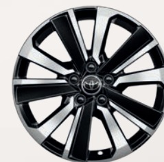
Jantes alliage 18" bi-ton noir et métal Yaris Cross Première