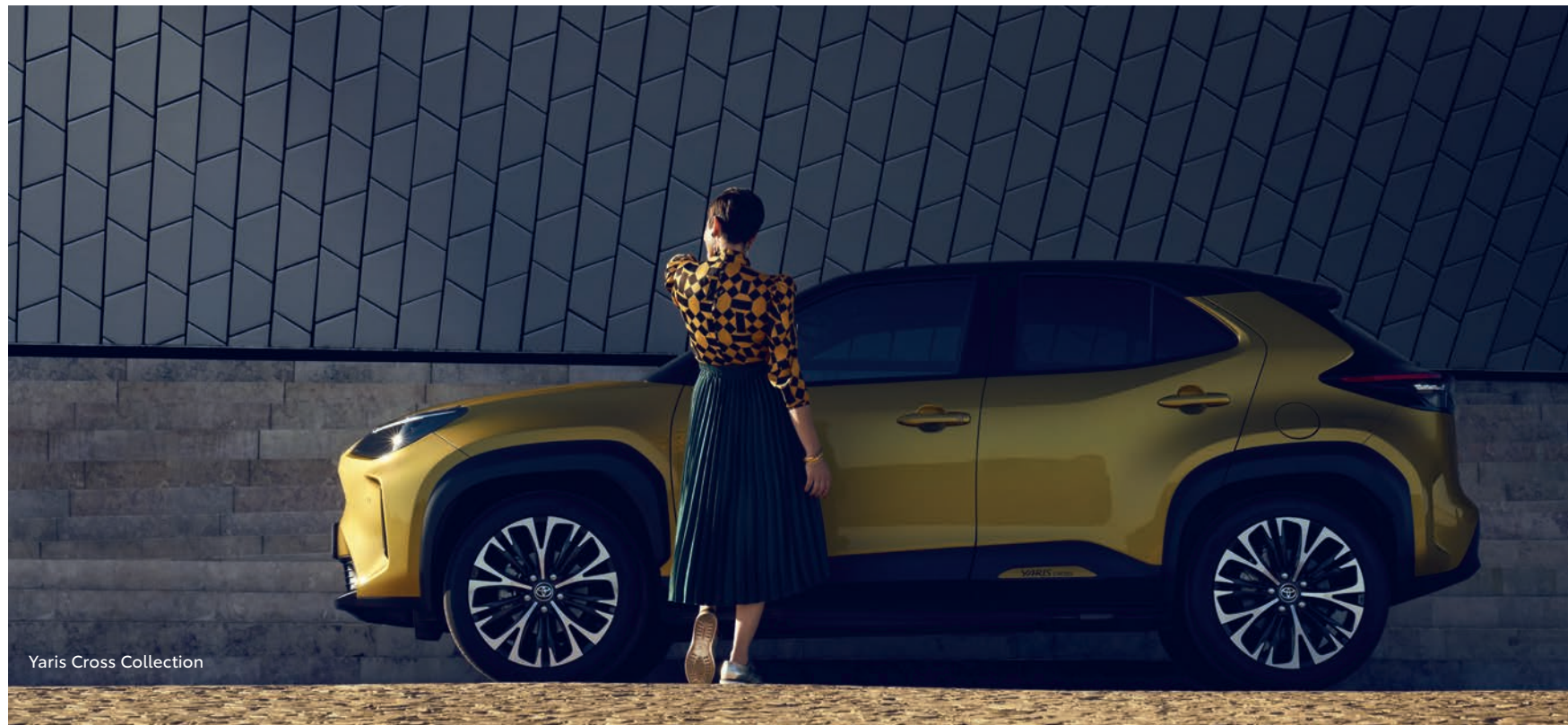
Yaris Cross Collection

Un toit panoramique (1) baigne votre intérieur de lumière et l'éclairage d'ambiance apporte une atmosphère relaxante à la nuit tombée. Dotée d'une climatisation automatique bizona, d'un système audio JBL® 8 haut-parleurs (1) et d'une planche de bord ergonomique, la Nouvelle Yaris Cross Collection offre un rare confort et un formidable plaisir de conduite.