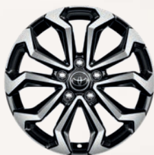
Jantes alliage 17" (5 doubles-branches) Yaris Cross Design