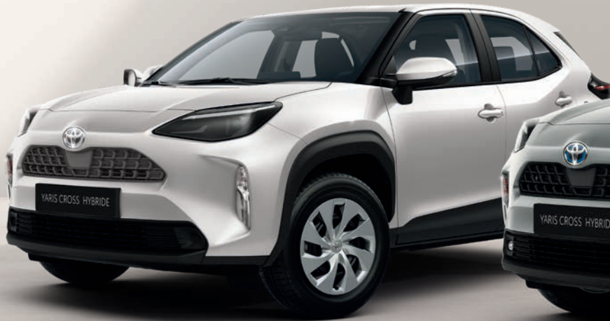
Yaris Cross Dynamic