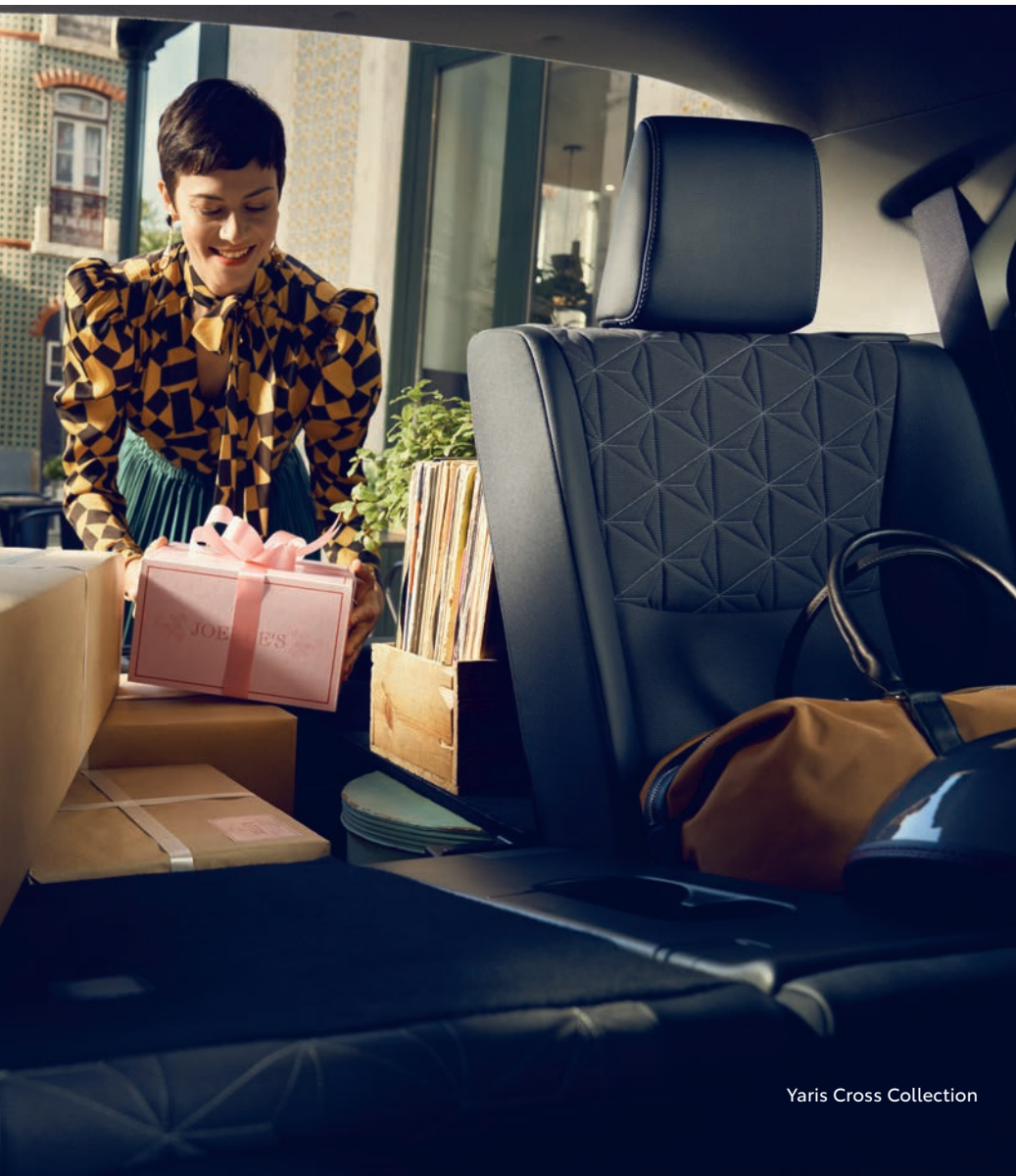
Yaris Cross Collection