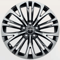
Jantes alliage 18" métal (10 doubles-branches)