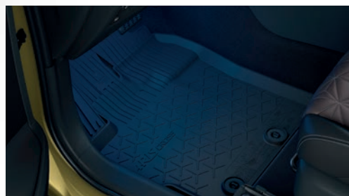
TAPIS DE SOL EN CAOUTCHOUC

(Disponible uniquement pour les versions AWD-i).