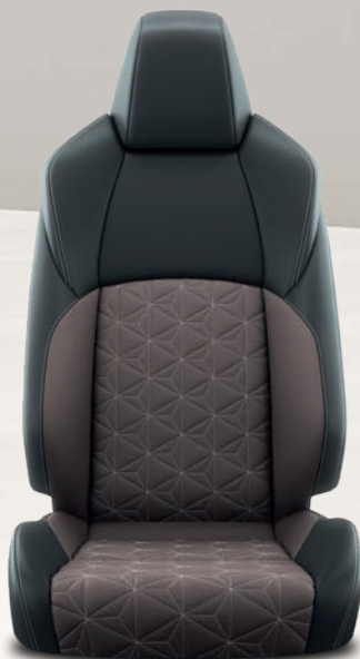
Yaris Cross Collection Sièges avant chauffants