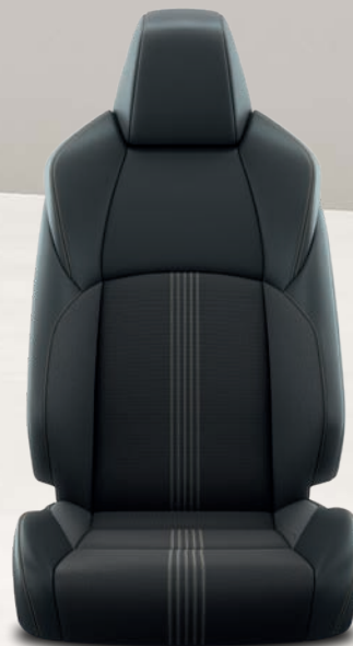
Yaris Cross Trail Sièges avant chauffants