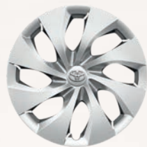
Enjoliveurs 16" Yaris Cross Dynamic