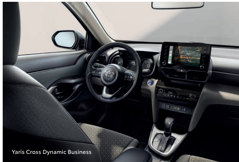
Yaris Cross Dynamic Business