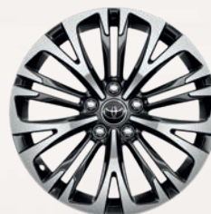
Jantes alliage 18" métal (10 doubles-branches) Yaris Cross Collection