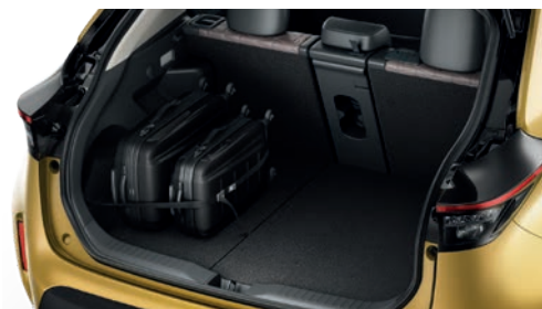
SANGLES DE COFFRE