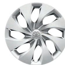
Enjoliveurs 16" DYNAMIC