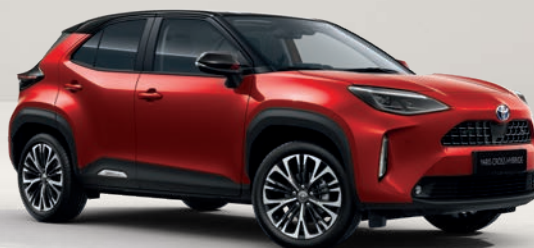
Yaris Cross Collection Rouge Intense