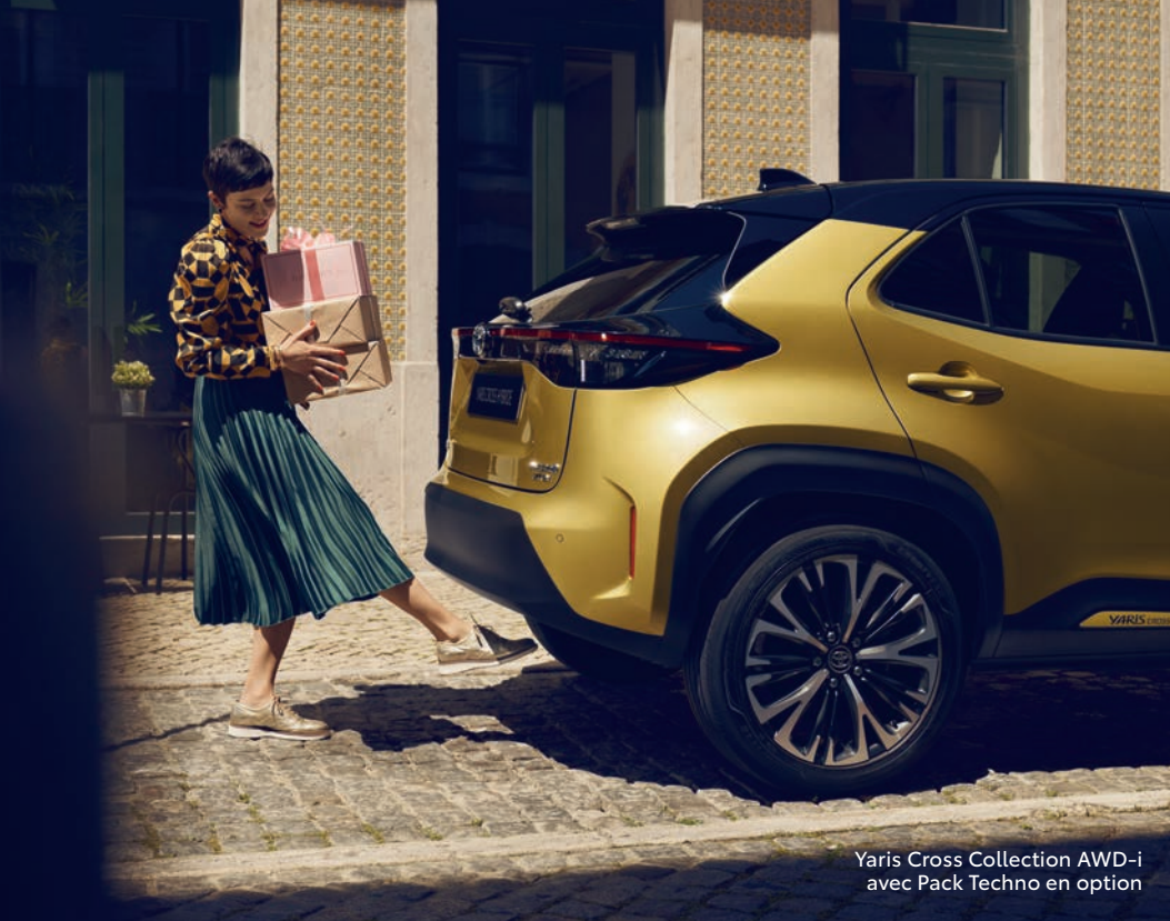
Yaris Cross Collection AWD-i avec Pack Techno en option