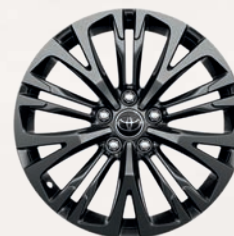
Jantes alliage 18" noires (10 doubles-branches) Yaris Cross Trail