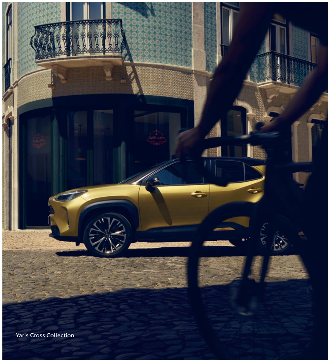
Yaris Cross Collection