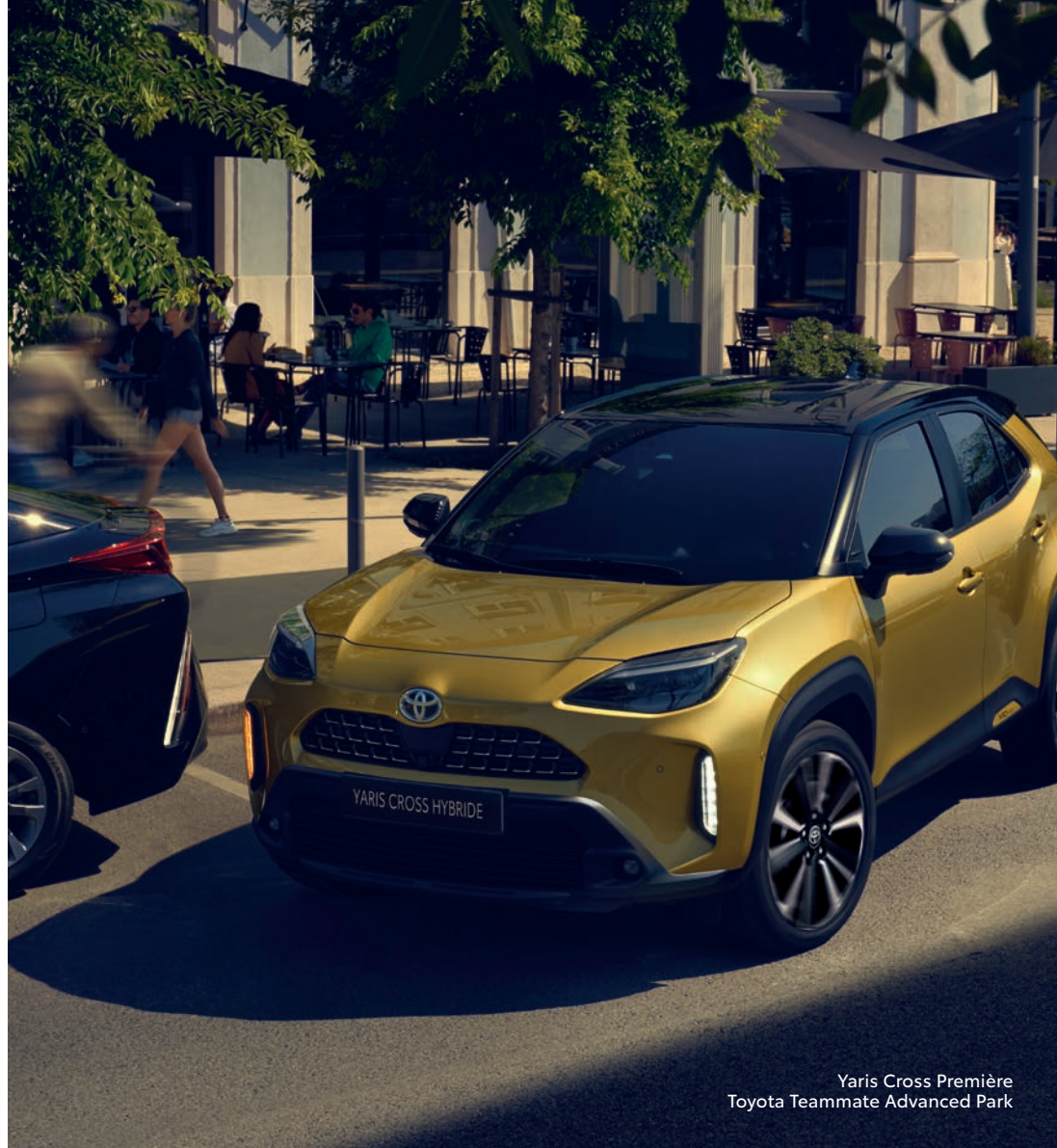
Yaris Cross Première Toyota Teammate Advanced Park