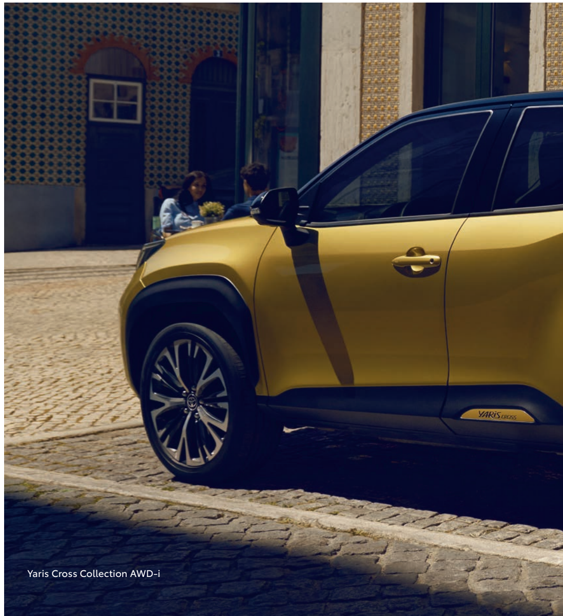
Yaris Cross Collection AWD-i