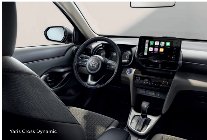
Yaris Cross Dynamic