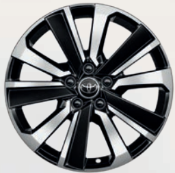
Jantes alliage 18" bi-ton noir et métal