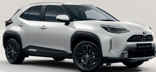
Yaris Cross Trail Blanc Lunaire nacré