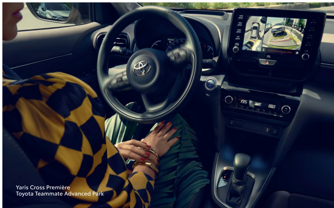
Yaris Cross Première Toyota Teammate Advanced Park

Gagnez du temps et simplifiez-vous la vie, le Toyota Teammate Advanced Park (1) identifie les places disponibles pour vous garer.