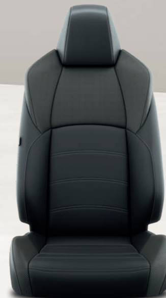
Yaris Cross Première Sièges avant chauffants