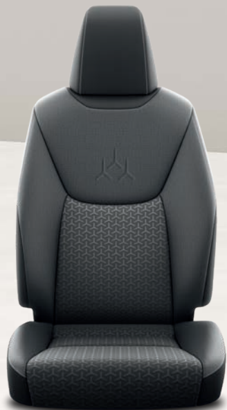
Yaris Cross Dynamic Yaris Cross Dynamic Business Yaris Cross Design