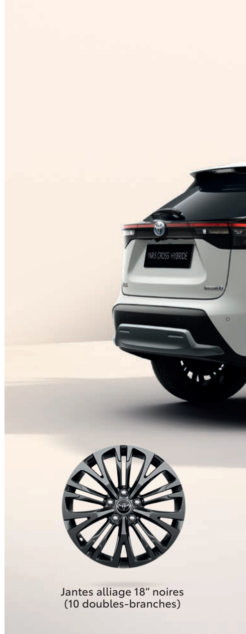
Jantes alliage 18" noires (10 doubles-branches)