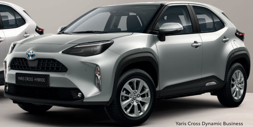
Yaris Cross Dynamic Business