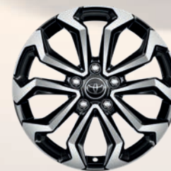
Jantes alliage 17" (5 doubles-branches)