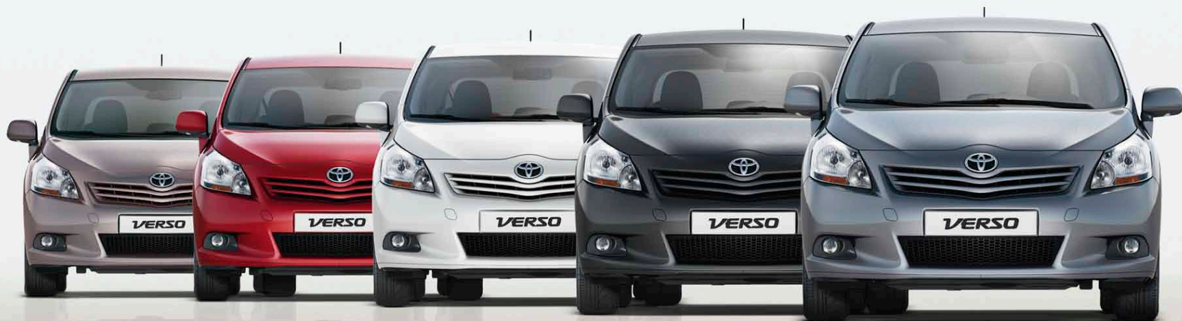
Gris Platine métallisé* (1G6)

Découvrez les 10 teintes de carrosserie disponibles sur Verso et choisissez la vôtre.