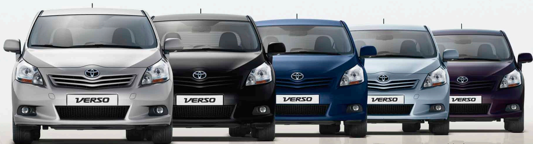
Gris Aluminium métallisé* (1F7)