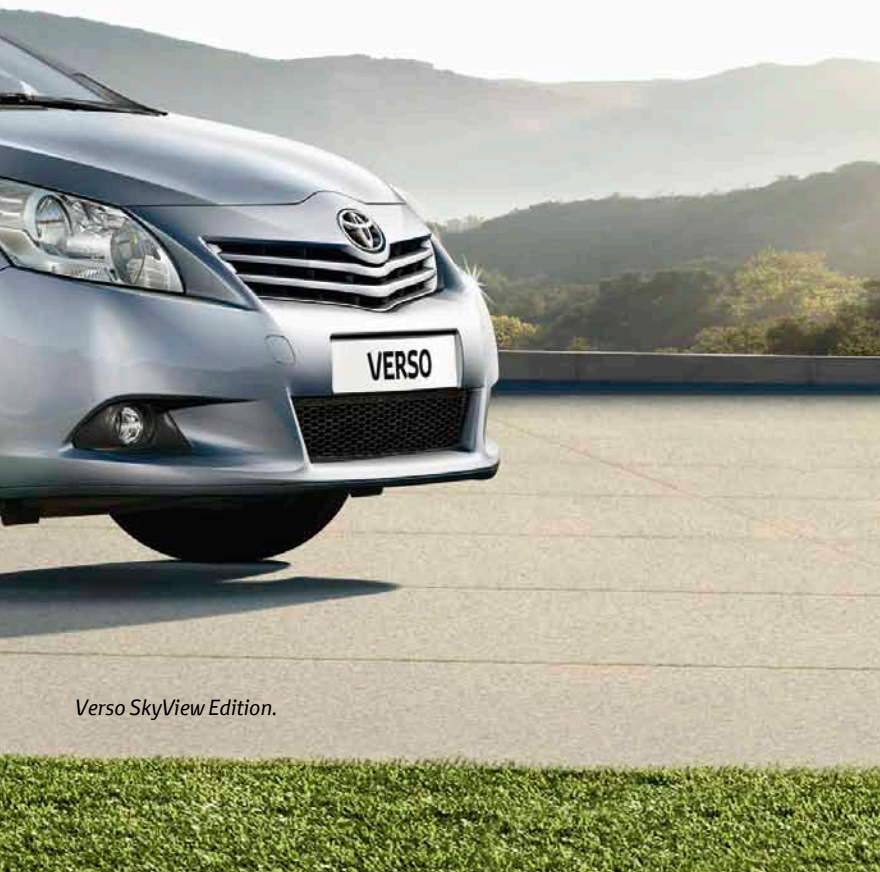
Verso SkyView Edition.

Toyota Verso. Un espace rien que pour vous.