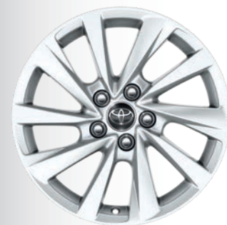
Jantes en alliage 17" Neagari (1) Dynamic Dynamic Business