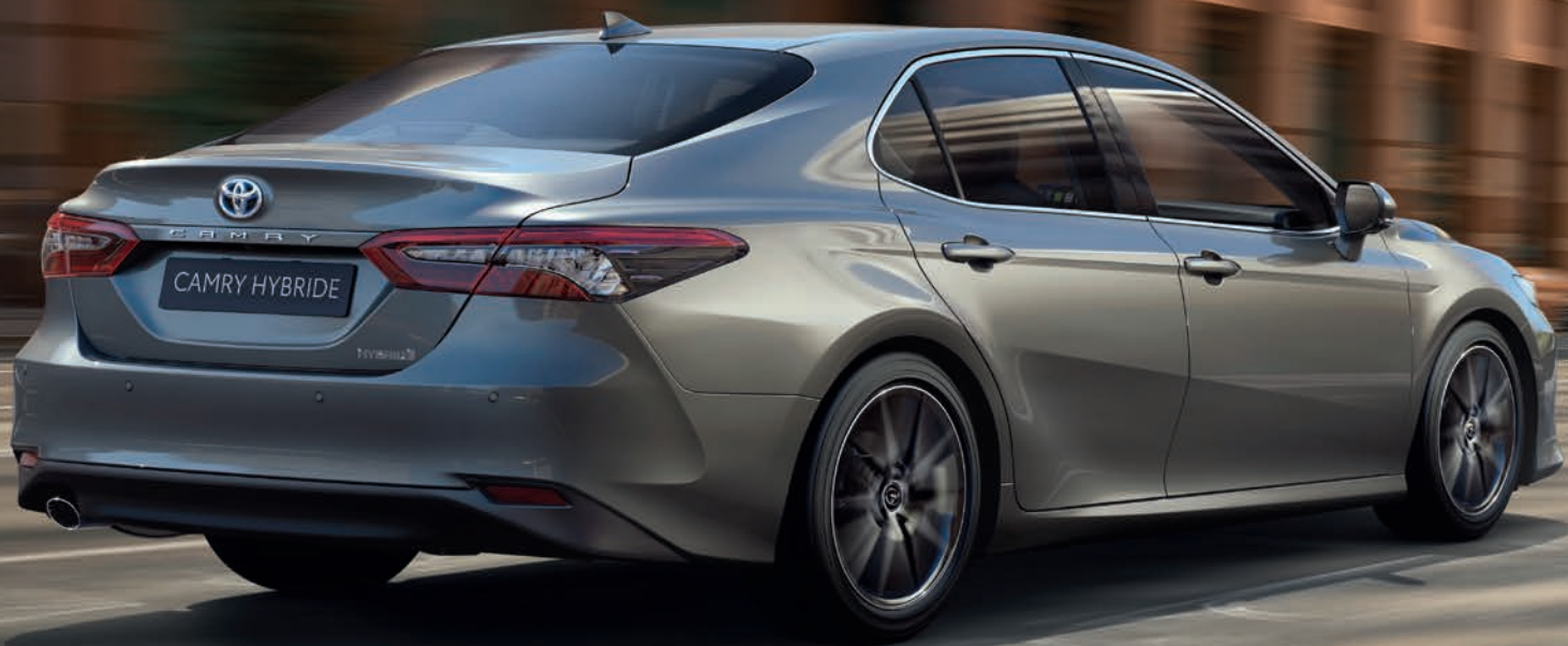
Camry Hybride Lounge