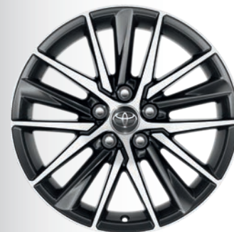
Jantes en alliage 18" Bankan (1) Business Executive Design Lounge