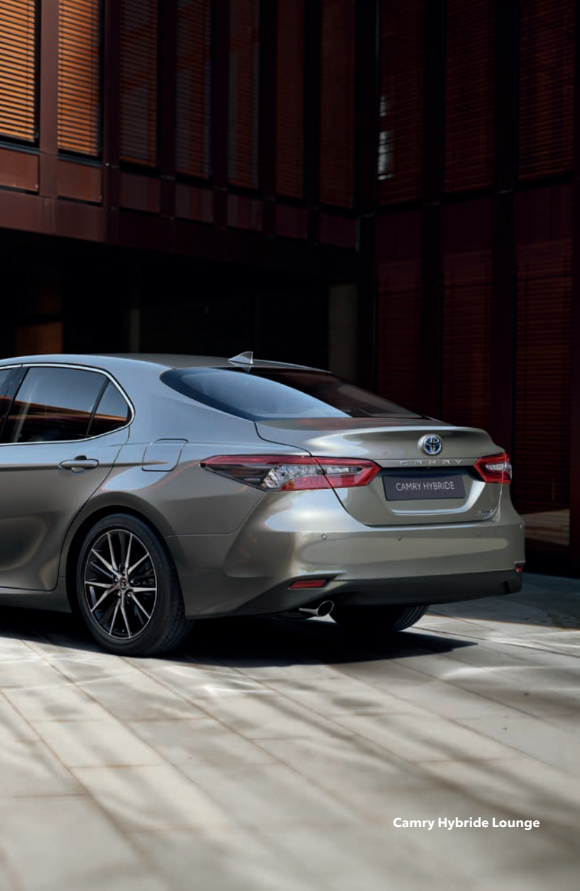
Camry Hybride Lounge