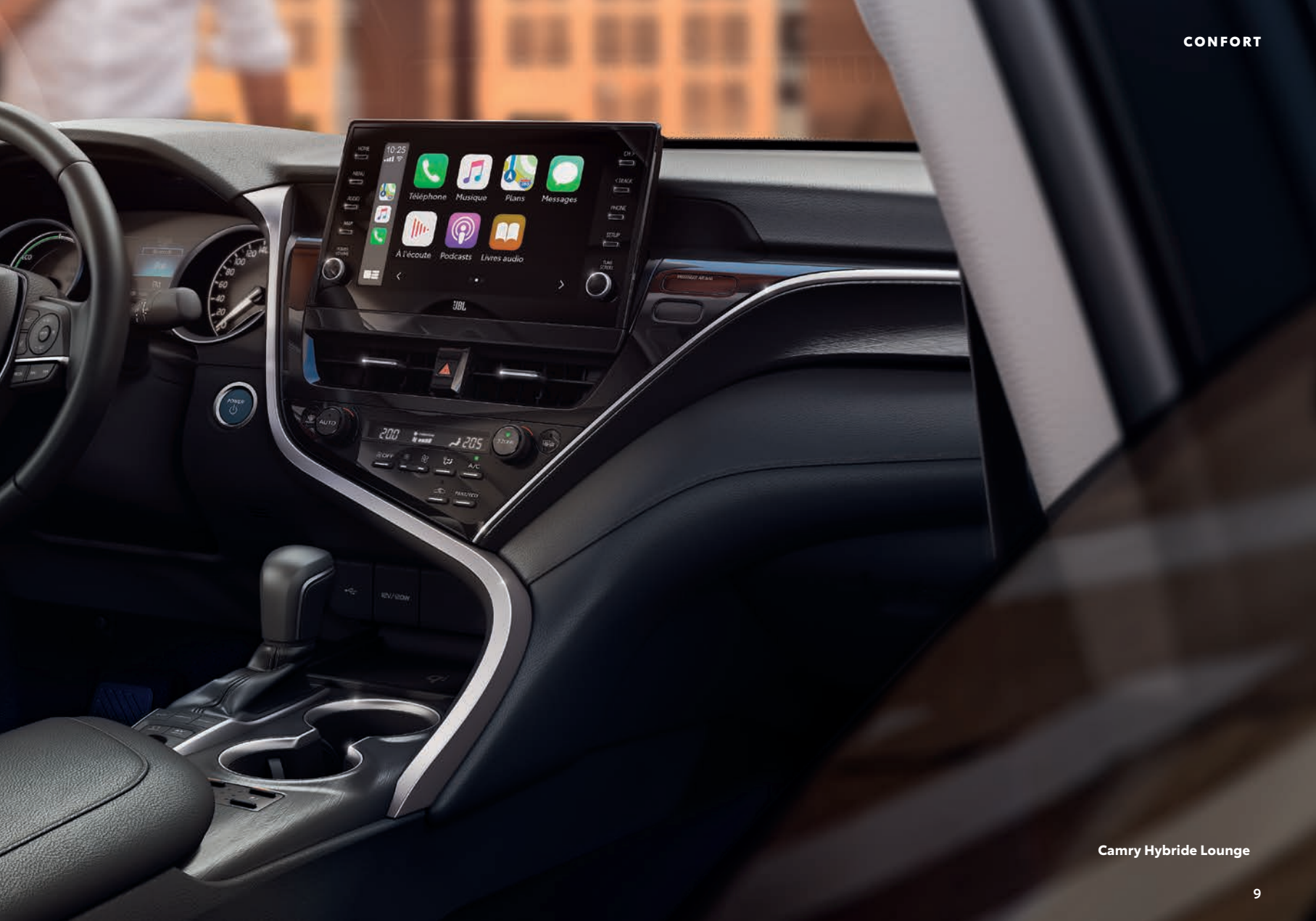
Camry Hybride Lounge