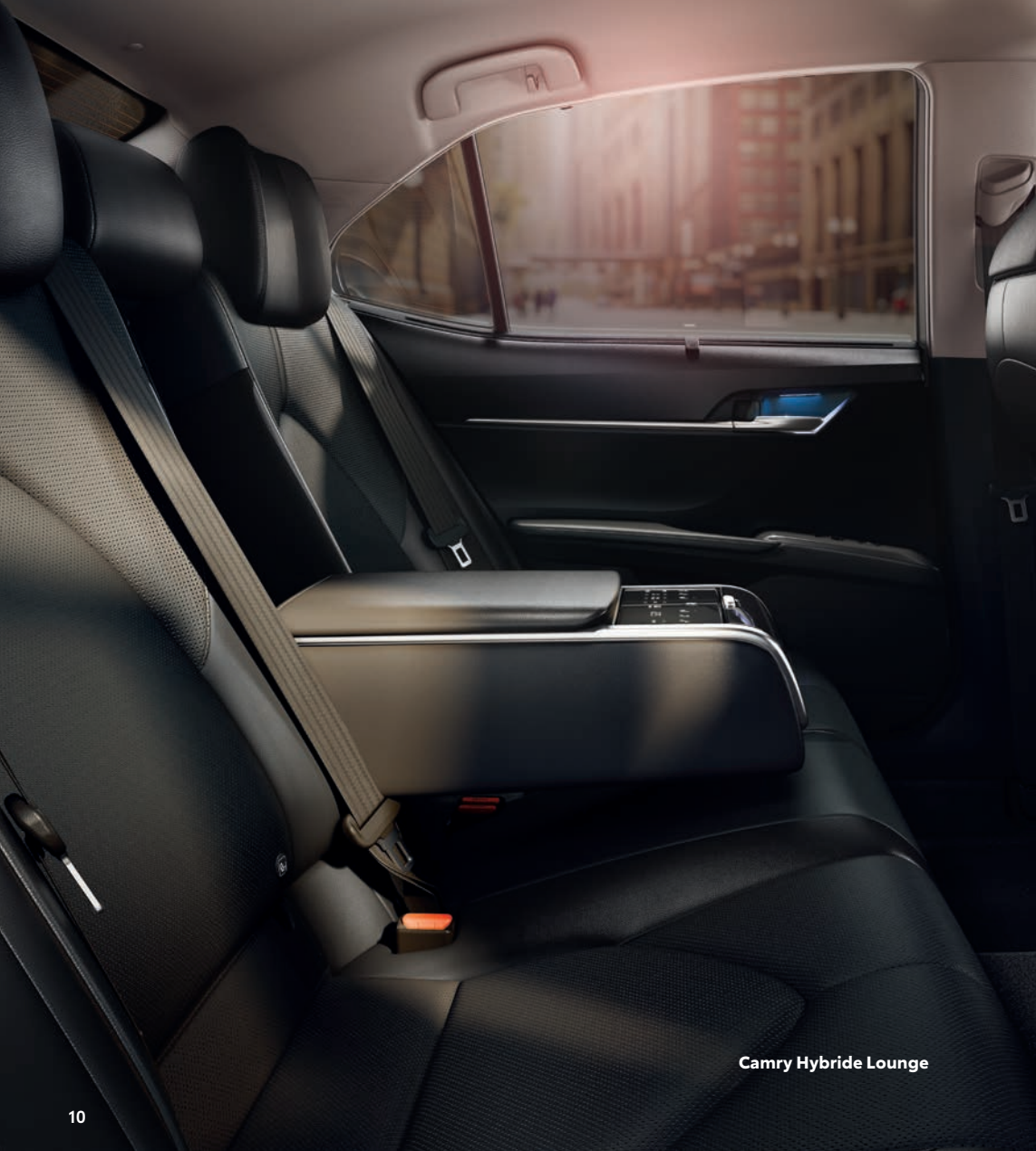
Camry Hybride Lounge