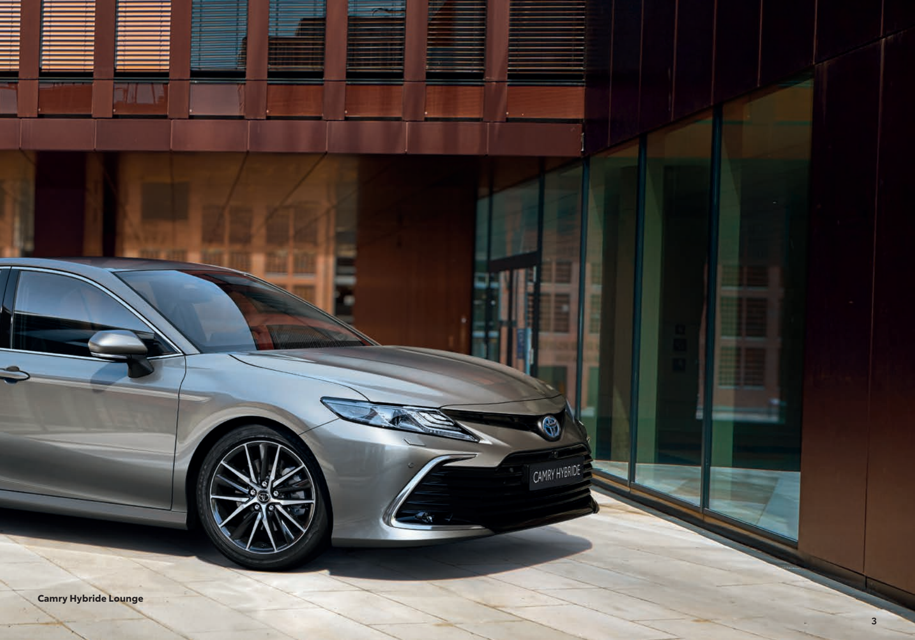
Camry Hybride Lounge