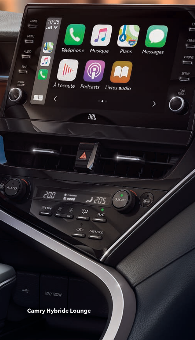
Camry Hybride Lounge