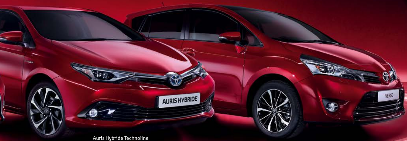
Auris Hybride Technoline avec phares Bi-LED en option