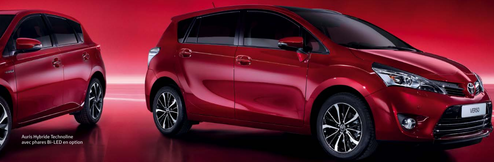
Auris Hybride Technoline avec phares Bi-LED en option