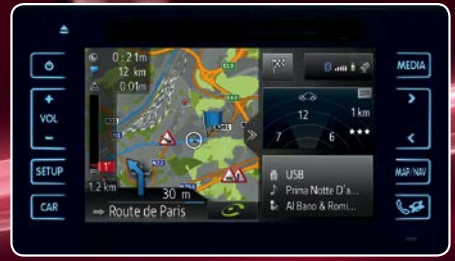
Toyota Touch & Go 2