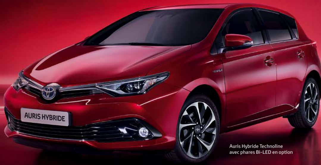
Auris Hybride Technoline avec phares Bi-LED en option