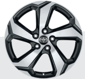
Jantes en alliage 18" Eole DESIGN DESIGN BUSINESS