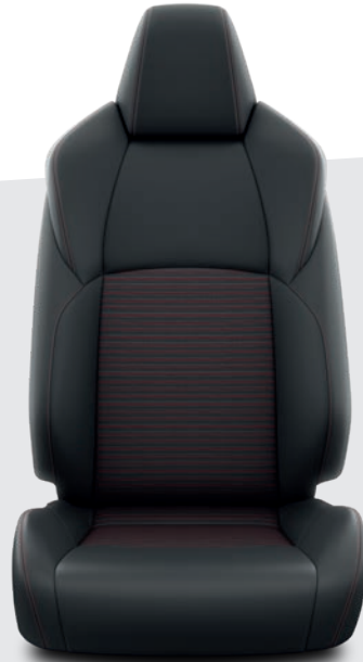
Sellerie en cuir synthétique sport noir avec surpiqûres rouges DESIGN BUSINESS