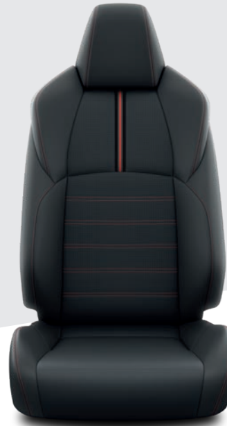
Sellerie en cuir noir avec surpiqûres rouges COLLECTION