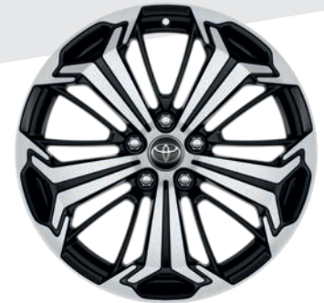
Jantes en alliage 19" Kalleis COLLECTION