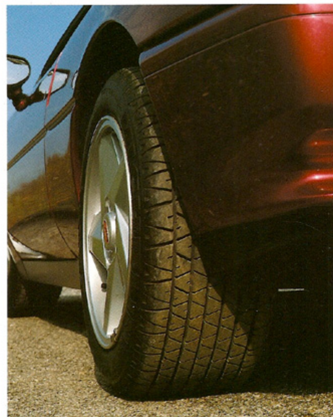
Conçus pour rouler à plus de 300 km/h, les Michelin MXX (type ZR) contribuent à la pureté des trajectoires.

Aucun de vos bagages ne sera visible de l'extérieur. A cette prévention s'ajoute, sans option, un système d'alarme.