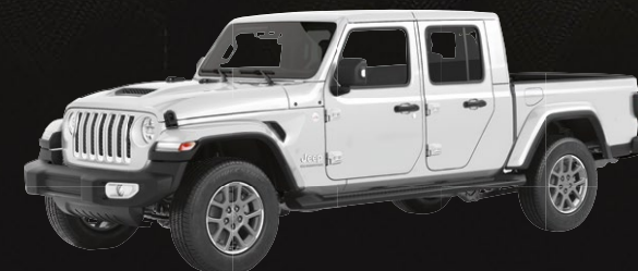
COLORIS BRIGHT WHITE*