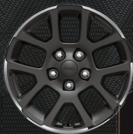
JANTES ALLIAGE 18"*