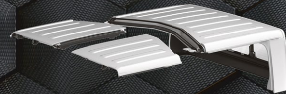
HARD TOP MODULABLE 3 PIÈCES COULEUR CARROSSERIE*