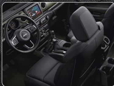
CUIR PREMIUM* Noir