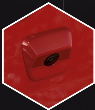
CAMÉRA DE RECU L PARKVIEW®