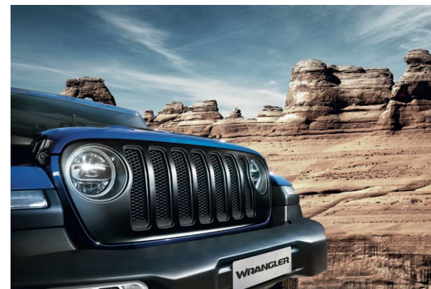
Calandre noir mat Référence : K82215114 Prix TTC : 449 €