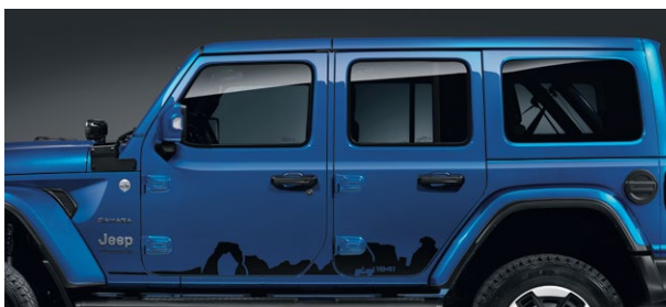
Stickers latéraux Moab Références : K82215730 (2p) / K82215732 (4p) Prix TTC : 249 €