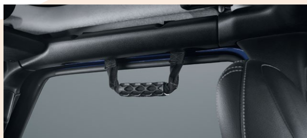
Poignées de maintien Références : K82215523 (avant) / K82215524 (arrière) Prix TTC : 79 €