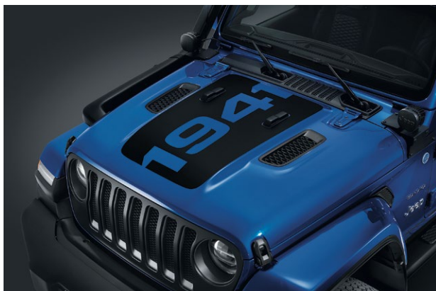
Sticker de capot 1941 Référence : K82215937 Prix TTC : 399 €

Prix maximum conseillés TTC hors pose au 2 juin 2020, TVA à 20 %.