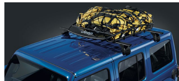
Barres de toit transversales Référence : K82215387 Prix TTC : 449 € Galerie de toit (filet K82209422AB à commander séparément) Référence : KTCCAN859 Prix TTC : 649 €