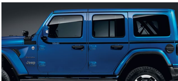
Stickers latéraux 1941 Références : K82215733 (2p) / K82215731 (4p) Prix TTC : 249 €