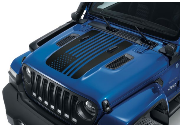
Sticker de capot Drapeau américain Référence : K82215936 Prix TTC : 399 €