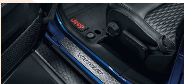
Seuils de porte en acier inoxydable Références : K82215395 (2p) / K82215396AB (4p) Prix TTC : 169 € (2p) / 269 € (4p) Surtapis caoutchouc Références : K82215202AD (2p) / K82215203AD (4p) Prix TTC : 229 € (2p) / 249 € (4p)