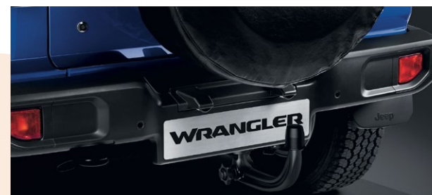
Attelage amovible et faisceau Références : K82215207AB + K82215540AD Prix TTC : 916 €