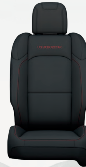
Tissu en noir avec coutures contrastantes en rouge Rubicon (de série)