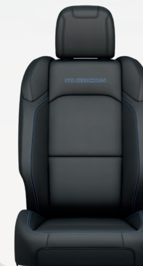
Cuir très résistant à l'usure en Nappa noir avec coutures contrastantes bleu surf (livrable en option)