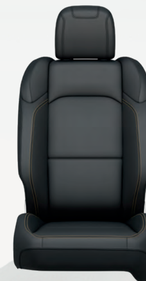
Tissu en noir Soul avec coutures contrastantes en or maya (de série)