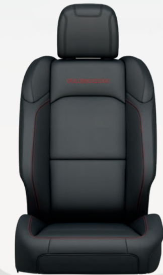
Cuir très résistant à l'usure en Nappa noir avec coutures contrastantes rouges Rubicon (livrable en option)