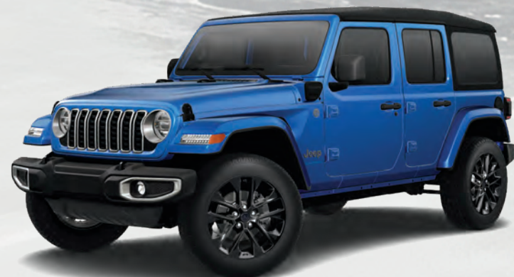
Wrangler Sahara MD 4xe à quatre portes en bleu hydro