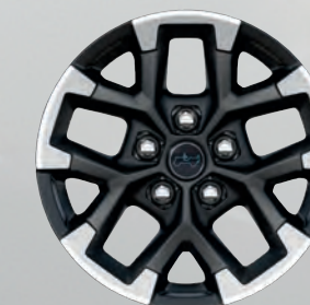
Roues de 17 po usinées avec creux noirs (de série)