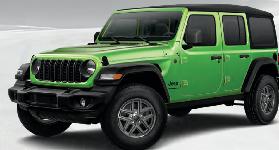
Wrangler Sport S quatre portes en mojitto