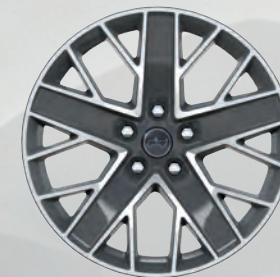
Roues de 20 po en aluminium peint gris (comprises avec l'ensemble High Altitude)