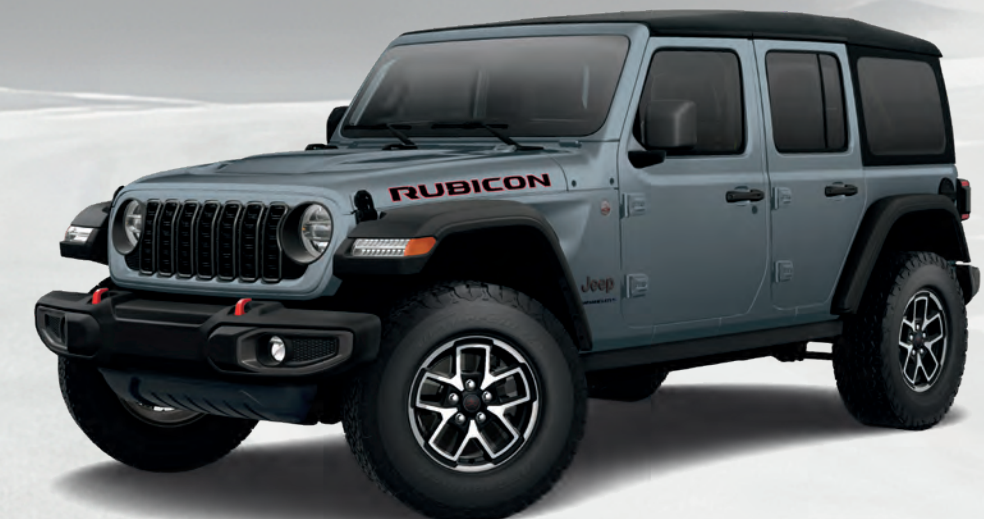
Wrangler Rubicon MD quatre portes en gris ciel