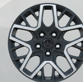
Roues de 18 po peintes en gris usinées (de série)