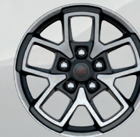
Roues de 17 po peintes en noir usinée (de série)