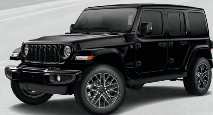
Wrangler High Altitude 4xe à quatre portes en noir