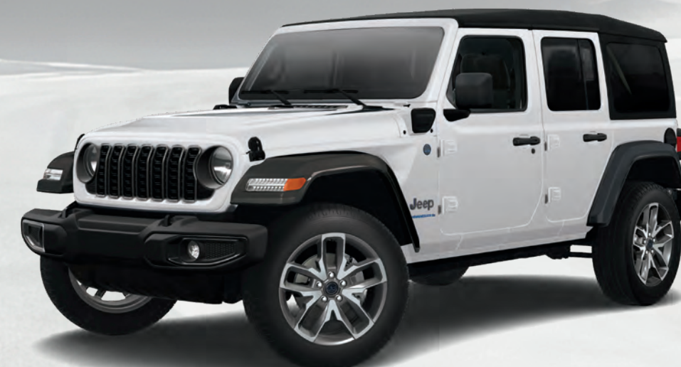
Wrangler Modèle Sport S 4xe en blanc éclatant