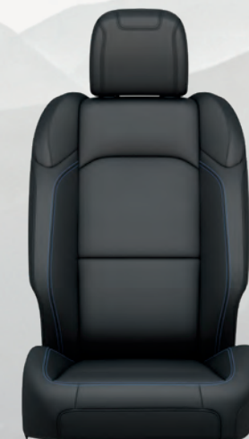
Cuir très résistant à l'usure en Nappa noir avec coutures contrastantes or maya (inclus avec l'ensemble High Altitude)