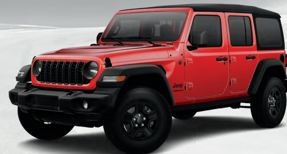
Wrangler Sport quatre portes en rouge pétard