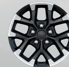
Roues de 17 po usinées avec creux noirs (livrables en option)