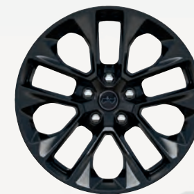
Roues de 20 po en aluminium entièrement peint (de série)