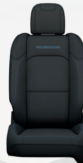
Tissu Soul noir avec relief (tissu 100 % durable) et coutures contrastantes bleu surf (de série)