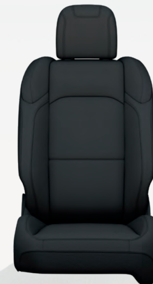
Gaufrage de pic/tissu Soul en noir avec coutures contrastantes noires (de série)