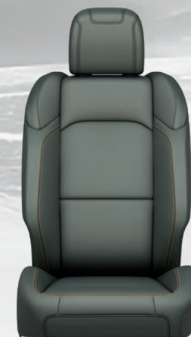
Cuir très résistant à l'usure en Nappa mante avec coutures contrastantes or maya (livrable en option avec l'ensemble High Altitude)