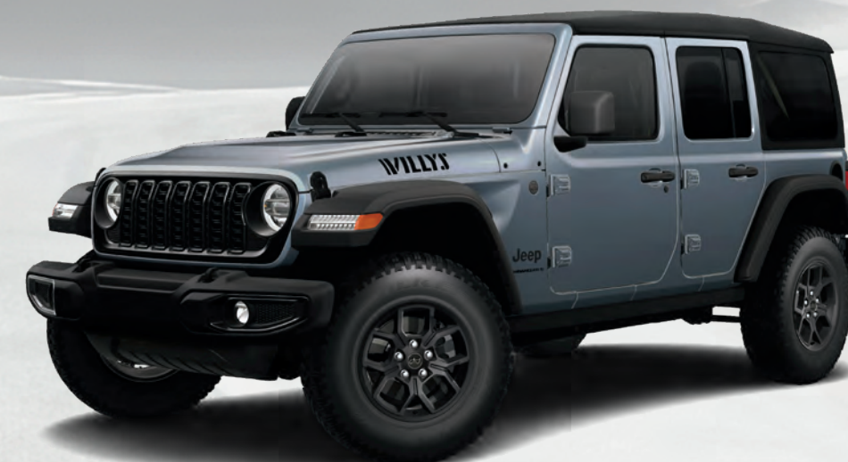
Wrangler Willys quatre portes en gris ciel