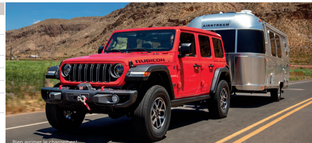
Bien arrimer le chargement. Respectez toujours la capacité de remorquage du véhicule.