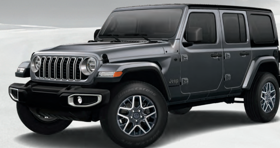
Wrangler Sahara MD en cristal granit métallisé