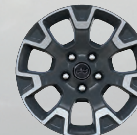
Roues de 18 po peintes en gris usinées (livrable en option)