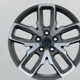
Roues de 20 po peintes en gris usinées (de série)