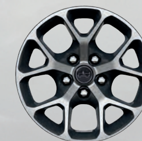
Roues de 17 po usinées avec creux noirs (livrables en option)