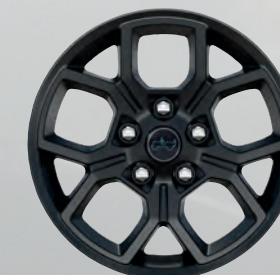
Roues de 17 po peintes en noir (de série)