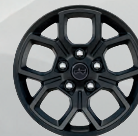
Roues de 17 po peintes en noir (de série)