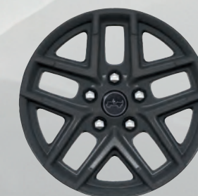
Roues de 17 po en aluminium peintes en noir usinées (de série)