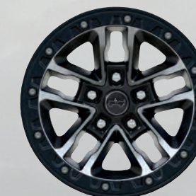
Roues de 17 po en aluminium usinées avec creux noirs (incluses avec l'ensemble de pneus 35 po Xtreme)