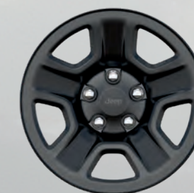
Roues de 17 po stylisées en acier noir (de série)