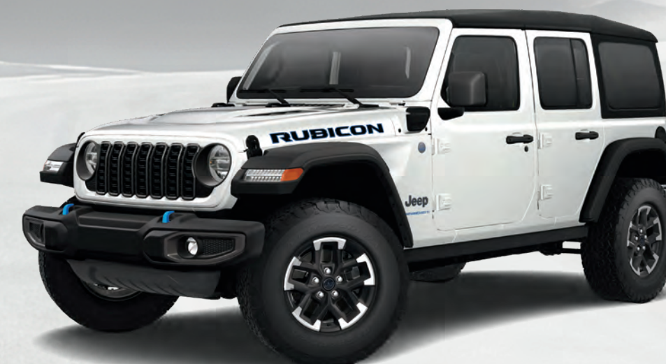
Wrangler Rubicon MD 4xe à quatre portes en blanc éclatant