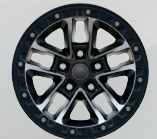
Roues de 17 po en aluminium usinées avec creux noirs (incluses avec l'ensemble de pneus 35 po Xtreme)