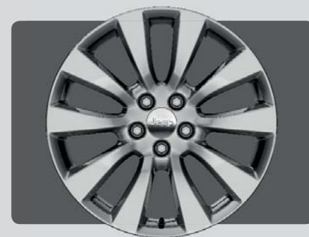
Jantes alliage 18" Overland

Le nouveau Cherokee Overland propose également de nombreux systèmes de sécurité active pour vous permettre de profiter pleinement de cette expérience de conduite unique. Cette version dispose d'une motorisation diesel 2,2l Multijet S&S 200 ch 4x4 et une boîte de vitesse automatique à 9 rapports.