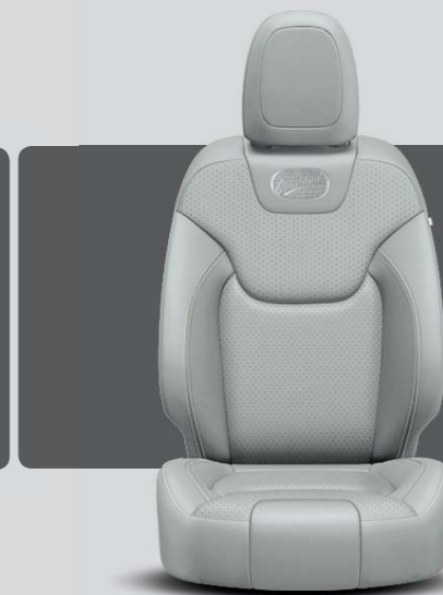
Intérieur Panama Pearl