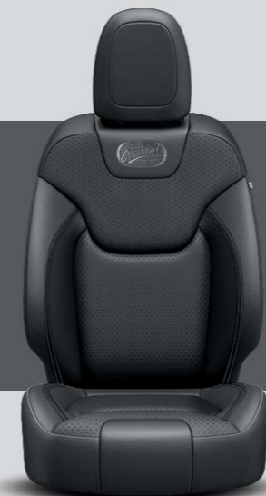
Intérieur Panama Black