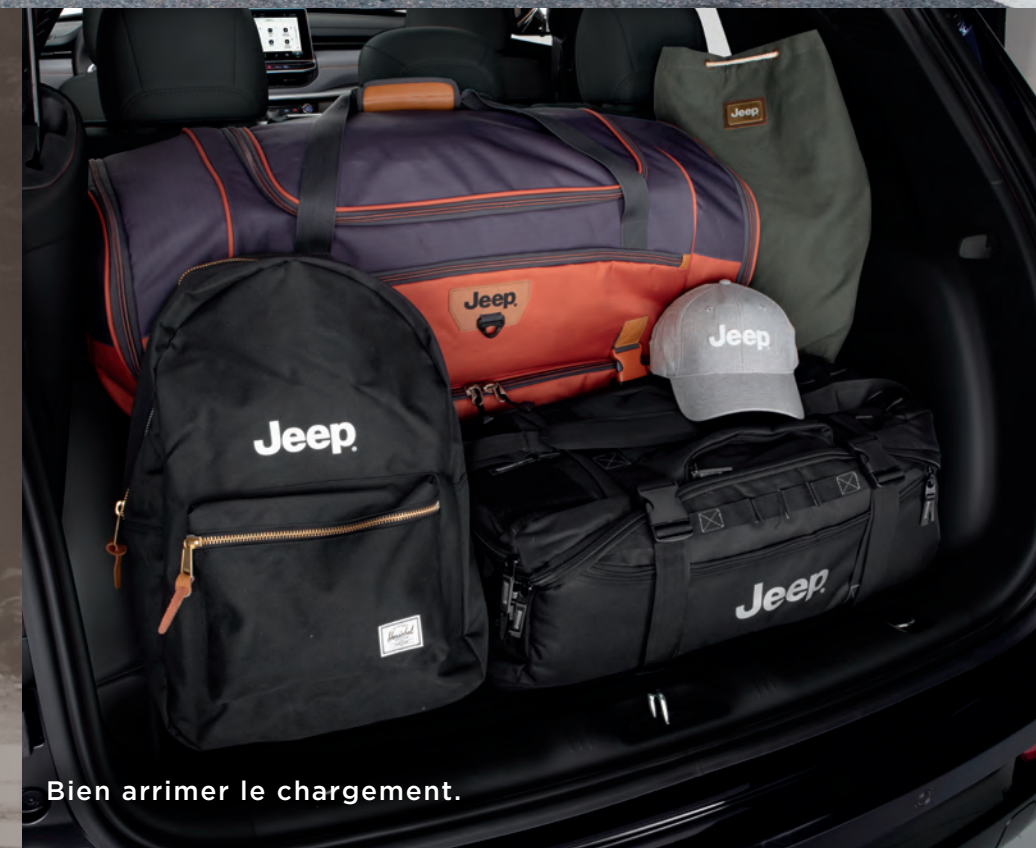
Bien arrimer le chargement.

Quels que soient vos projets, le Jeep® Compass est toujours prêt. Livrable en option, son hayon Open 'n Go activé par le mouvement s'ouvre facilement en glissant simplement votre pied sous le pare-chocs arrière, libérant ainsi vos mains pour charger des paquets, des sacs ou des boîtes dans l'espace utilitaire. Le design intérieur bien pensé comprend une banquette arrière 60-40 rabattable configurable qui peut facilement être convertie pour transporter des passagers, des marchandises ou du matériel selon vos besoins. Le plancher à hauteur ajustable de l'espace utilitaire arrière peut être abaissé pour placer de grands objets ou soulevé pour y glisser facilement vos effets personnels.