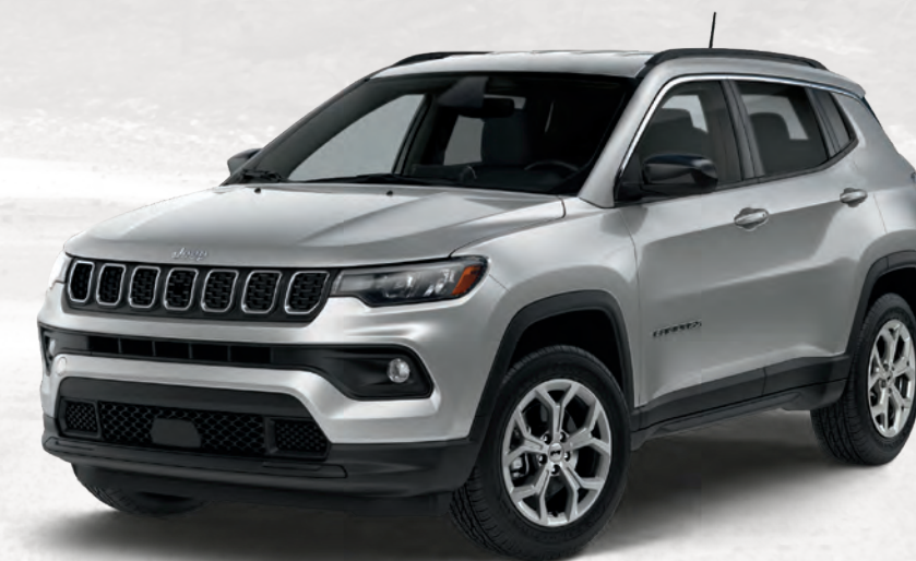
North en zénith argenté métallisé