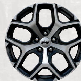
Roues de 18 po en aluminium peint à coupe diamant (de série)