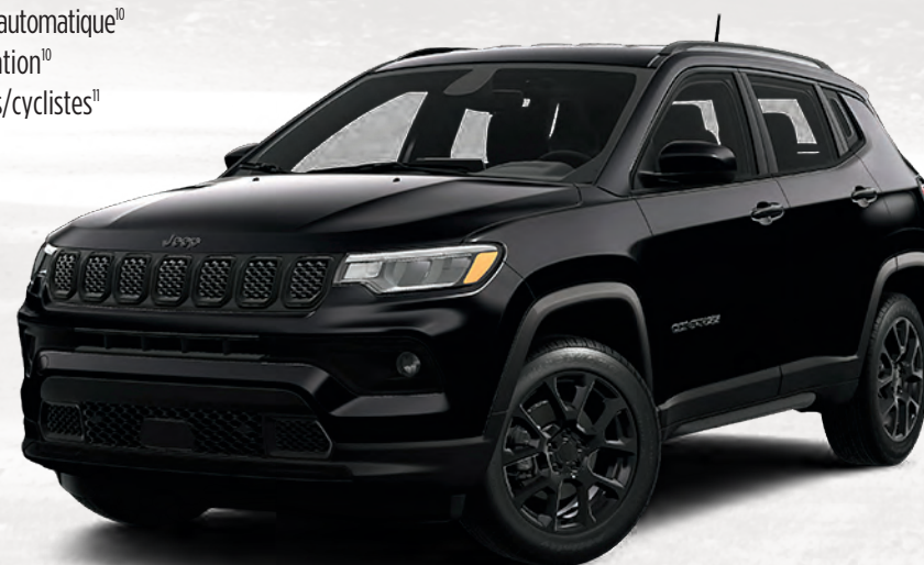
Modèle Altitude illustré en couche nacrée noir diamant