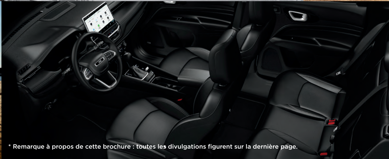
* Remarque à propos de cette brochure : toutes les divulgations figurent sur la dernière page.