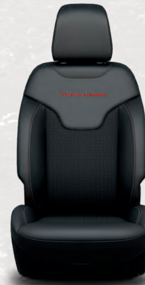
Sièges à dessus en cuir McKinley et tissu Spectre avec emblème Trailhawk MD brodé et surpiqûres contrastantes doubles rouge rubis et tungstène; noir (de série)

TRAILHAWK MD ELITE : Système d'infodivertissement Uconnect 5 Nav avec écran tactile de 10,1 po, phares projecteurs de croisement et de route à DEL, feux arrière et antibrouillards à DEL de qualité supérieure, affichage numérique avec écran couleur de 10,25 po, sièges du conducteur et du passager avant à réglage électrique, sièges à dessus en cuir, siège du conducteur à mémoire, sièges avant ventilés, ensemble attelage de remorque, tapis de recharge sans fil, régulateur de vitesse adaptatif avec fonction arrêt-reprise 10 , système d'aide sur l'autoroute 16 , reconnaissance des panneaux de signalisation 15 , système d'aide au stationnement avant et arrière Park-Sense 10 , moquette d'espace utilitaire en vinyle réversible, système de caméra panoramique sur 360 degrés 14 et système d'assistance au stationnement en parallèle et en perpendiculaire et à la sortie du stationnement 10