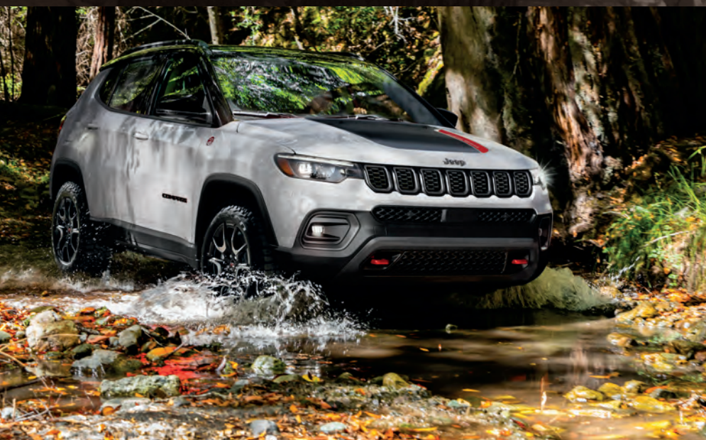
Modèle Trailhawk MD illustré en blanc éclatant