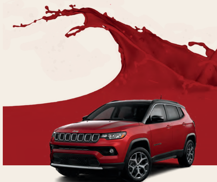
Couche nacrée rouge chaud