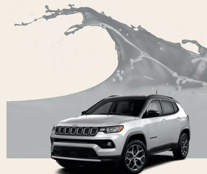
Zénith argent métallisé