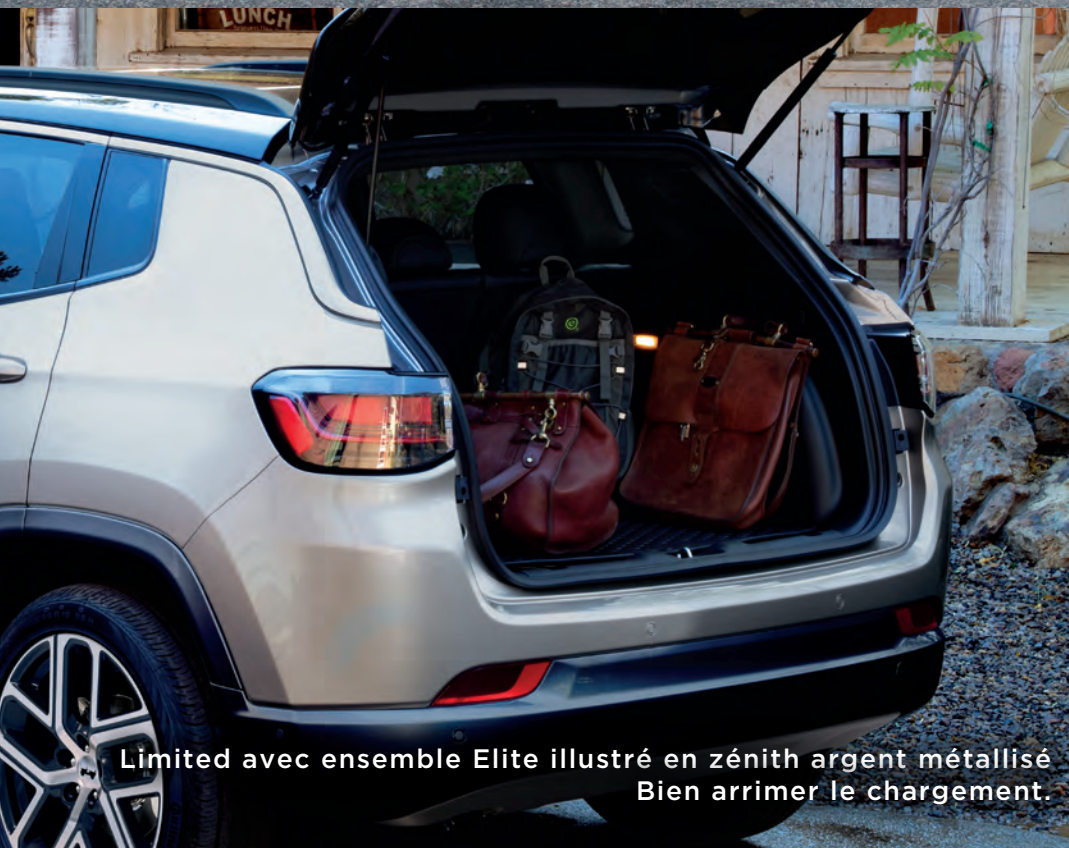
Limited avec ensemble Elite illustré en zénith argent métallisé Bien arrimer le chargement.