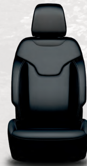
Sièges à dessus de cuir McKinley ventilés avec surpiqûres contrastantes bleu vif: noir/gris (livrable en option avec l'ensemble Elite)