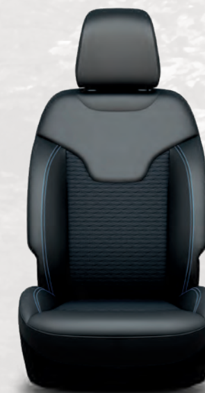
Sièges McKinley en vinyle et tissu Kimberlite; noir (de série sur le Altitude Special Edition)