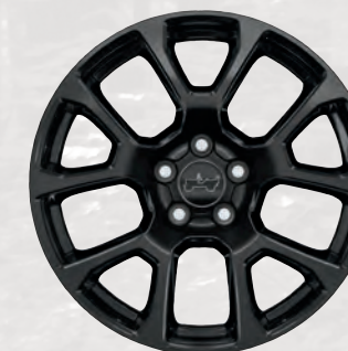
Roues de 18 po en aluminium peint noir brillant (de série sur le modèle Altitude Special Edition)