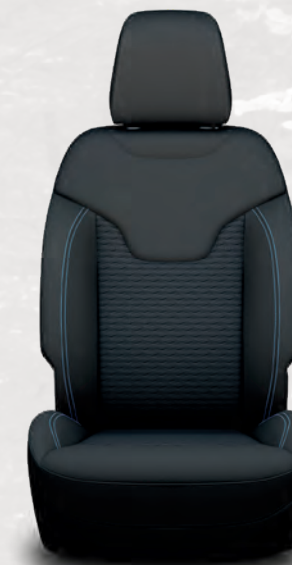
Sièges en tissu Sedoso et Kimberlite avec surpiqûres contrastantes bleu brillant; noir (de série)