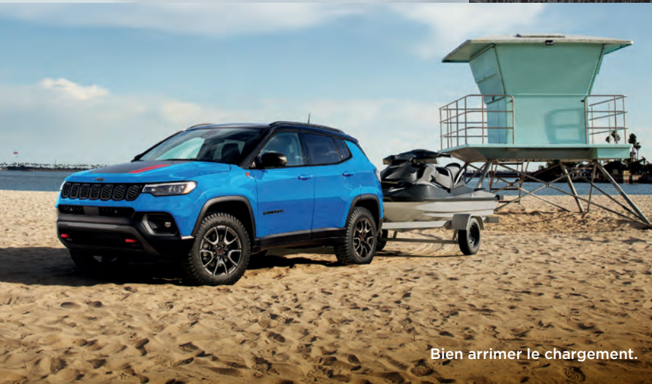
Bien arrimer le chargement.

DES COMPÉTENCES DE HAUT NIVEAU À TOUTES LES ALTITUDES