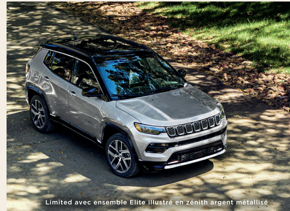
Limited avec ensemble Elite illustré en zénith argent métallisé