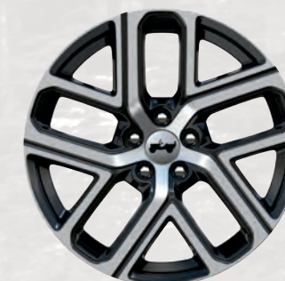
Roues de 19 po en aluminium à coupe diamant avec creux noir brillant (livrable en option avec ensemble Elite)