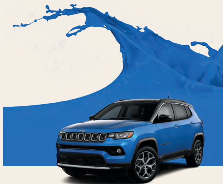
Couche nacrée bleu hydro