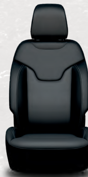
Sièges à dessus en cuir McKinley avec surpiqûres contrastantes gris acier; noir/gris et noir/sépia (de série)

ENSEMBLE D'AIDE À LA CONDUITE I : Tapis de recharge sans fil, centre d'affichage de l'information numérique avec écran couleur de 10,25 po, régulateur de vitesse adaptatif avec fonction arrêt-reprise 10 , système d'aide au stationnement avant et arrière Park-Sense 10 , système de caméra panoramique sur 360 degrés 14 , système d'assistance au stationnement en parallèle et en perpendiculaire et à la sortie du stationnement 10 , reconnaissance des panneaux de signalisation 15 , système d'aide sur l'autoroute 16