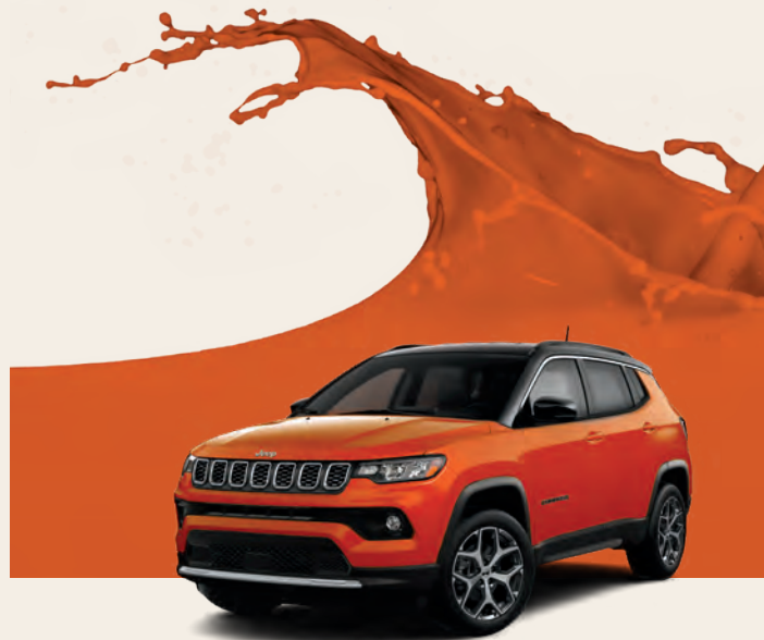
Joose (disponibilité limitée)