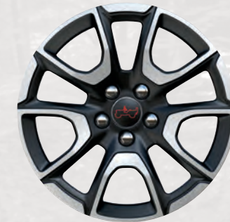
Roues de 17 po en aluminium à coupe diamant avec creux noir lustré (de série)