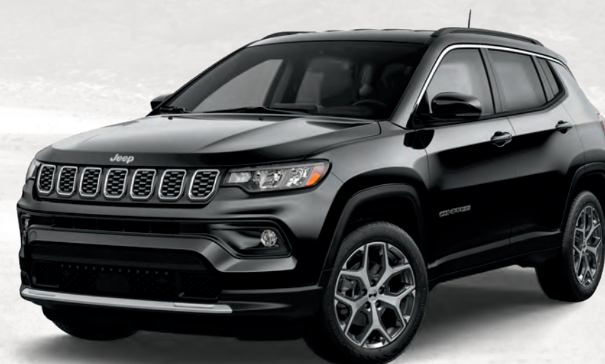
Modèle Limited illustré en couche nacrée cristal noir étincelant