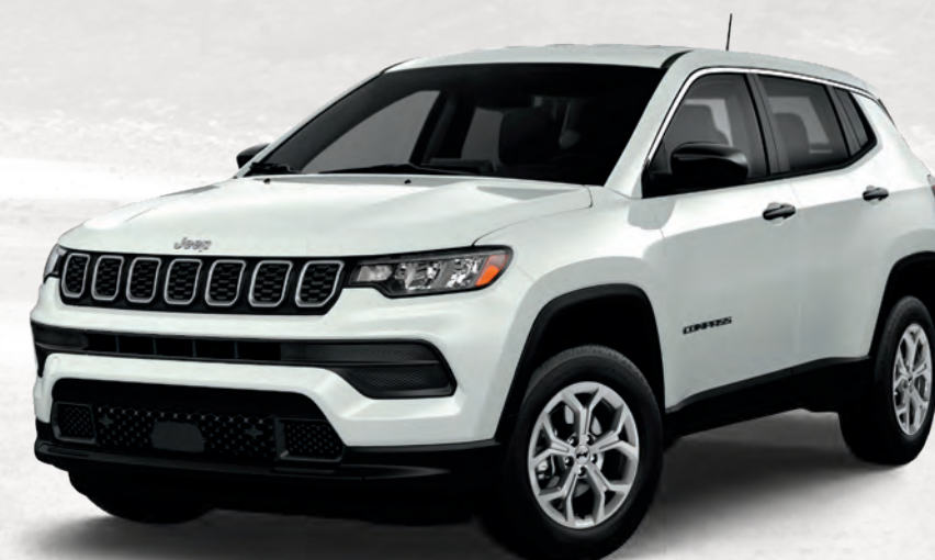
Modèle Sport illustré en blanc éclatant