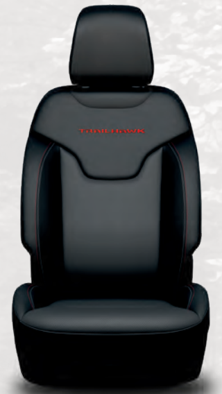
Sièges à dessus en cuir McKinley ventilé avec emblème Trailhawk MD brodé et surpiqûres contrastantes doubles rouge rubis et tungstène; noir (livrable en option avec le Trailhawk Elite)