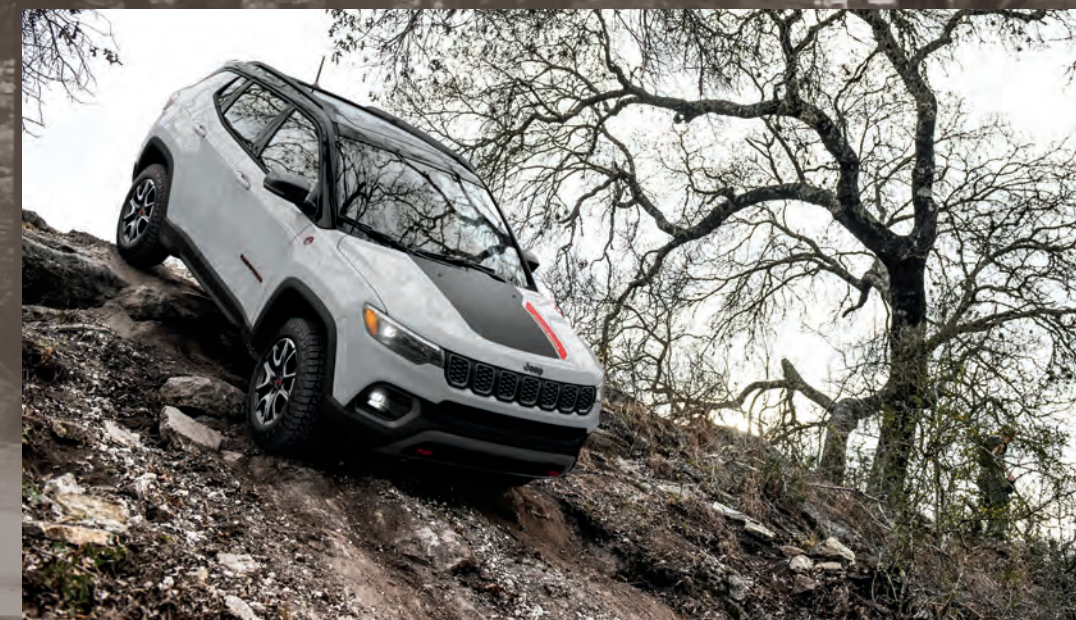
Modèle Trailhawk illustré en blanc éclatant