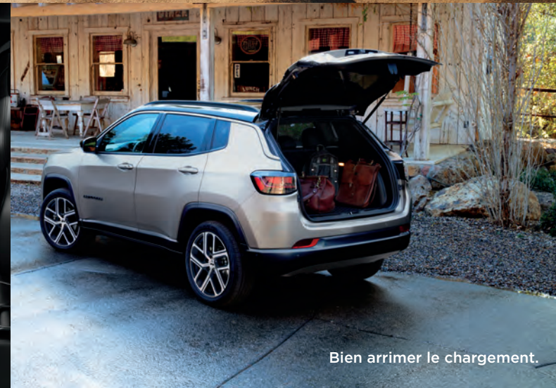
Bien arrimer le chargement.