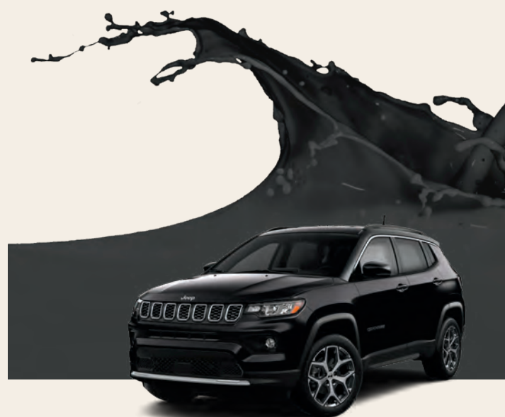
Couche nacrée noir diamant