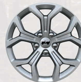
Roues de 17 po en aluminium peint argent fin (de série)