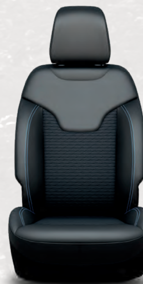
Garniture en vinyle McKinley et garniture en tissu Kimberlite avec surpiqûres contrastantes bleu brillant; noir (de série)

ALTITUDE SPECIAL EDITION : Garnitures intérieures contrastantes noir piano, écusson extérieur gris neutre, calandre noire avec anneaux gris neutre, moulures de glace noire, affichage numérique couleur de 10,25 po système d'infodivertissement Uconnect 5 Nav avec écran tactile de 10,1 po, siège conducteur à commande électrique, renfort médian de tableau de bord en vinyle Addax noir, surpiqûres intérieures contrastantes tungstène clair, roues de 18 po en aluminium peint noir brillant et pneus toutes saisons 225/55R18 à FN