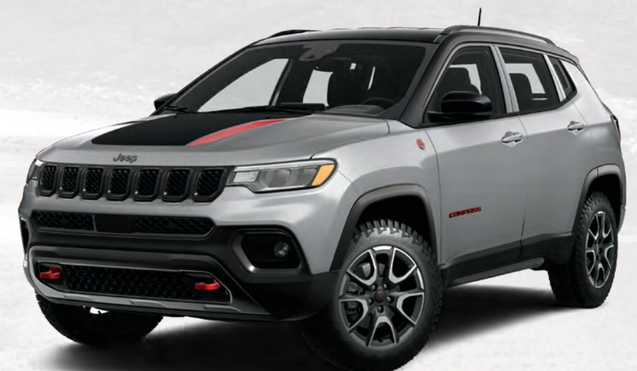
Trailhawk MD illustré en zénith argenté métallisé