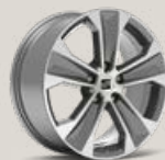
Jantes 17" Dynamic usinées