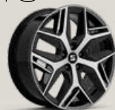
Jantes 19" FR Classic usinées