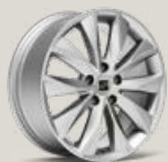
Jantes 17" Dynamic