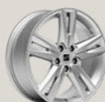
Jantes 18" FR Sport