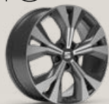
Jantes 18" Performance usinées