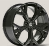
Jantes 19" Aneto noires

F Disponibles exclusivement au sein du Pack Black Edition