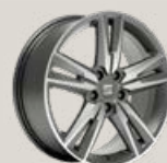
Jantes 18" FR Sport usinées