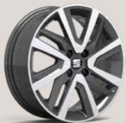
Jantes alliage 16" Pneumatiques 185/50 R16 81H