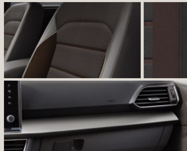
Sellerie tissu gris "Baza" avec inserts bruns Alcantara® - LM XE