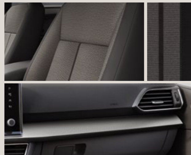
Sellerie tissu gris "Olot" avec inserts noirs Alcantara® - FG St