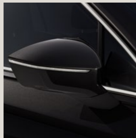
Noir Intense** St XE

Style St Xcellence XE De série ■ En option ■ *Vernie. **Métallisée. ***Personnalisée.