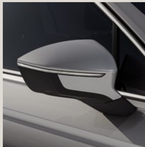
Gris Argent** St XE