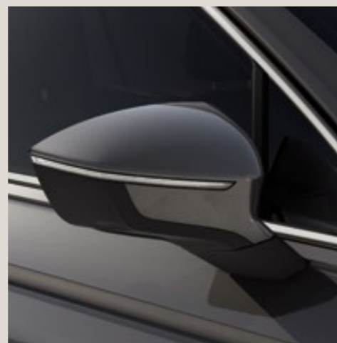
Gris Urano* St XE