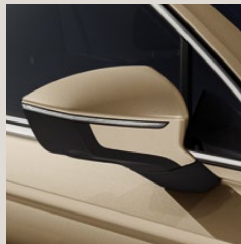
Beige Titanium** St XE