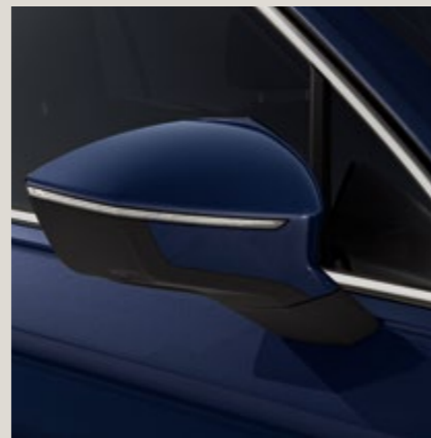
Bleu Atlantique** St XE