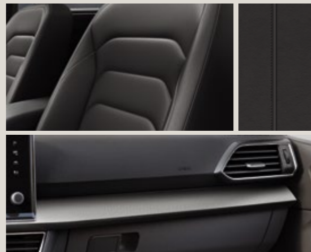
Sellerie cuir noir Vienna avec Pack Hiver - LM + PL1 XE *Disponible à partir de février 2019.