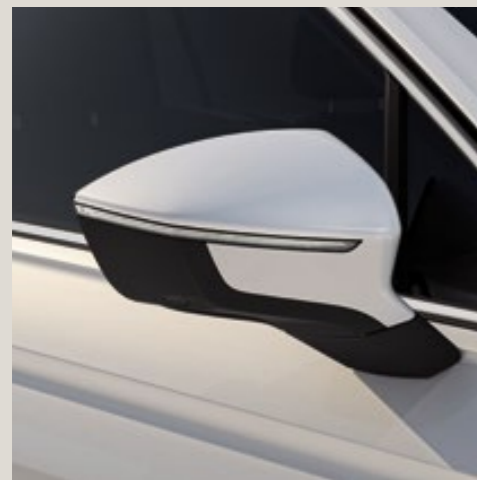
Blanc Perle*** St XE