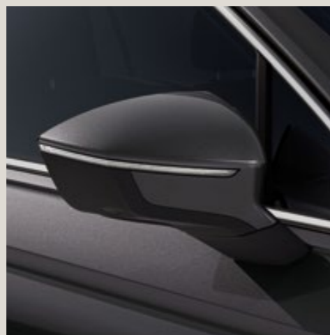
Gris Indium** St XE