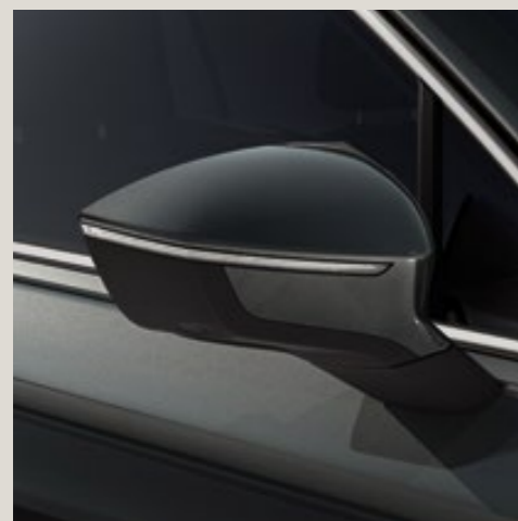
Gris Caiman*** St XE