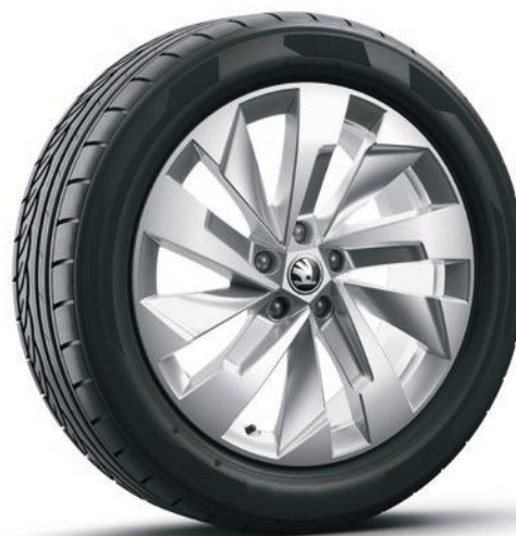
Jantes en alliage léger 19" Rapeto Aero argent