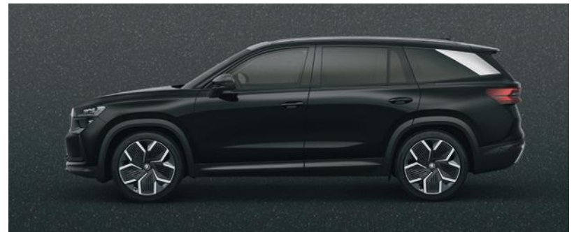
Magic Black métallisé