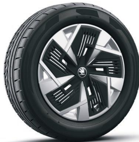
Jantes en alliage léger 18" Mazeno Aero argent avec des caches «Aero» noirs