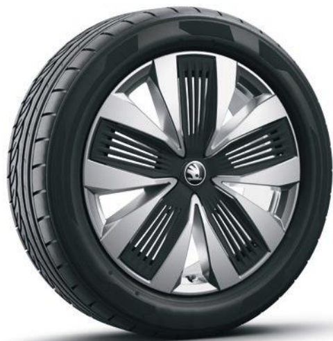
Jantes en alliage léger 19" Talgar Aero argent avec des caches «Aero» noirs