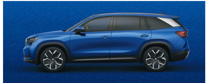
Race Blue métallisé