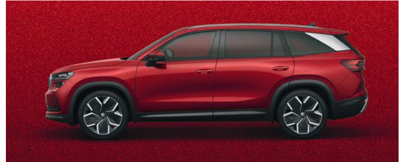
Velvet Red métallisé