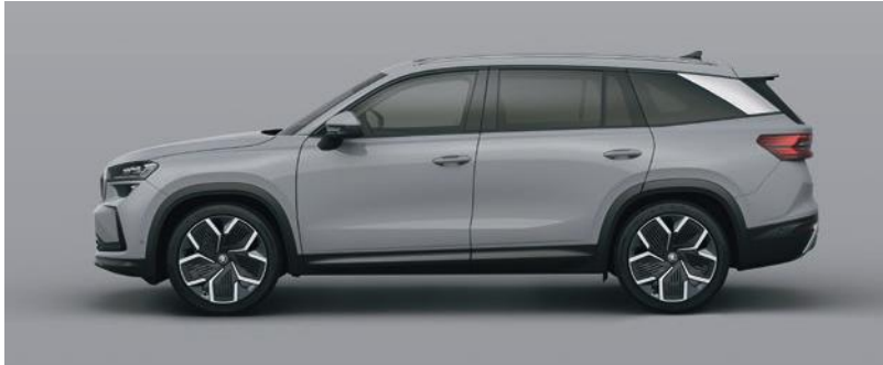
Steel Grey uni