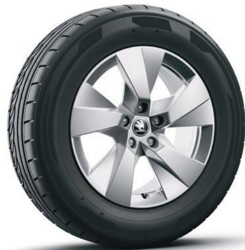
Jantes en alliage léger 17" Paget Aero argent