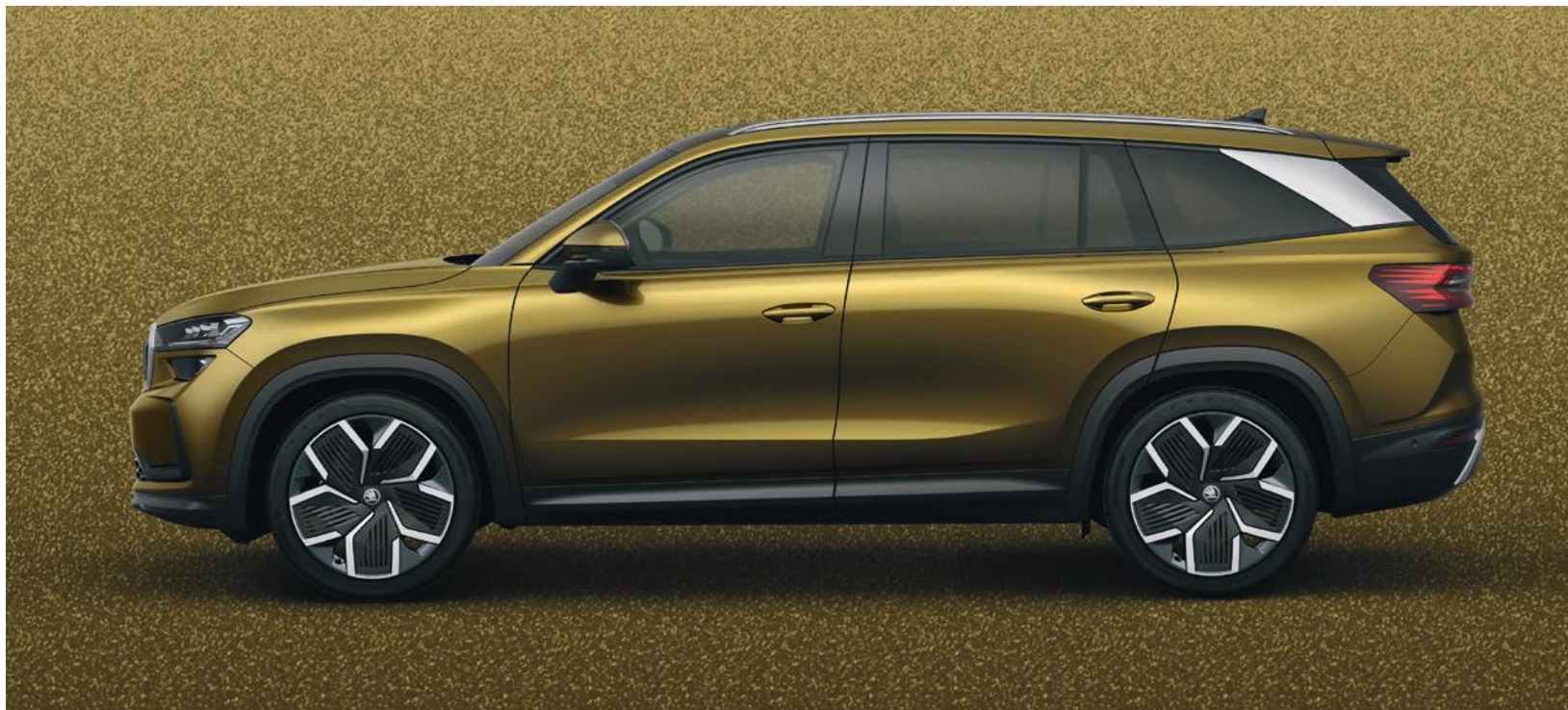
Bronx Gold métallisé