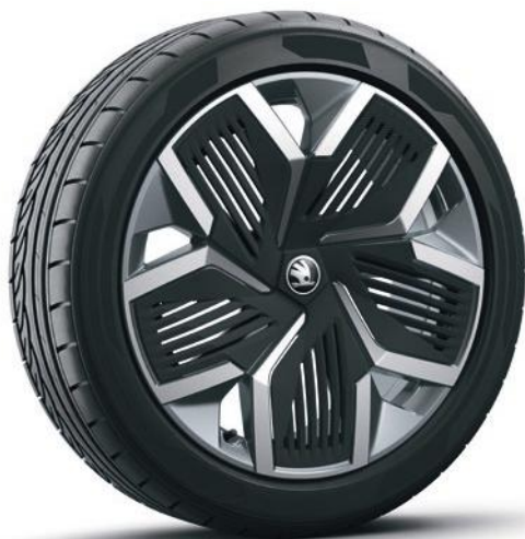
Jantes en alliage léger 20" Rila Aero anthracite avec des caches «Aero» noirs