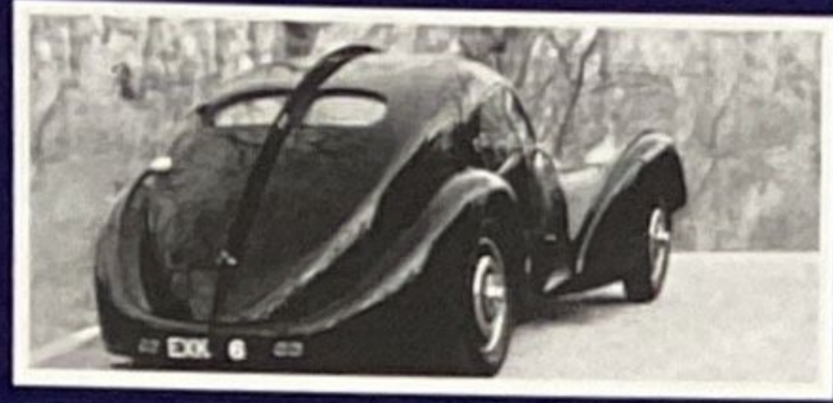
La variante la plus réussie de toutes les Bugatti 57S est l'aérodynamique Coupé «Atlantic».