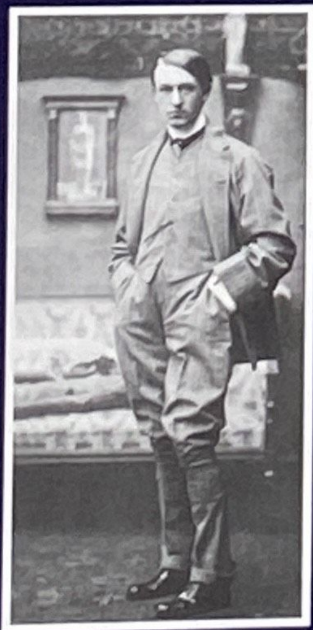
Ettore Bugatti: ses innombrables idées, sa persévérance, son sens des proportions et son goût du détail original ont donné naissance à ce que l'on peut appeler le «style Bugatti».