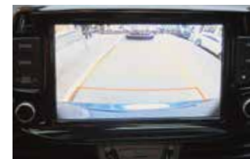
Caméra de recul