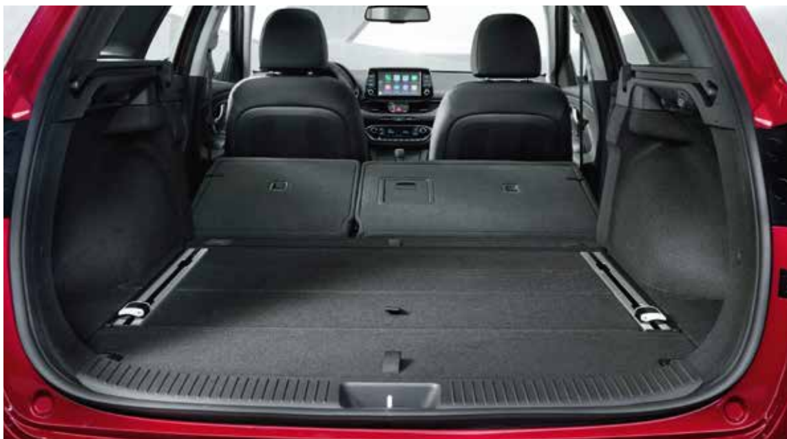
Volume sièges rabattus : 1 650 litres

L'ouverture du hayon révèle les talents cachés d'i30 Nouvelle Génération. Le coffre affiche une capacité de chargement de 395 litres sur la version 5 portes, et de 602 litres sur la version SW (break). De quoi y loger par exemple l'équivalent de 60 packs d'eau, ou encore 6 grandes valises. Rabattez les sièges arrière, et ce volume s'élèvera à un impressionnant 1 301 litres (1 650 litres sur i30 SW). Des valeurs trônant parmi les meilleures de la catégorie des compactes, faisant d'i30 le partenaire idéal pour toutes vos excursions, qu'elles soient personnelles ou professionnelles.