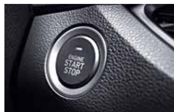
Démarrage sans clé