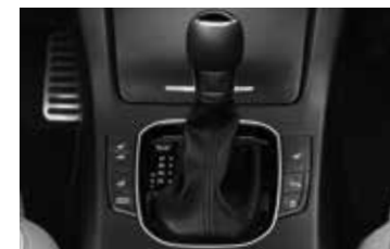
Boîte de vitesses à double embrayage 7 rapports