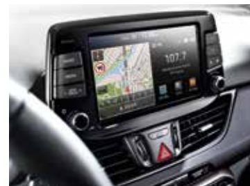
Système multimédia avec écran tactile 8"