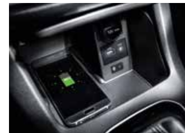
Chargeur sans fil pour smartphones compatibles