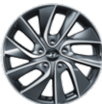
Jante alliage 17"