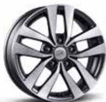
Jante alliage 16"