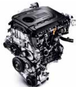
1.6 CRDi 110/136