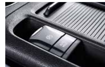
Frein de parking électrique