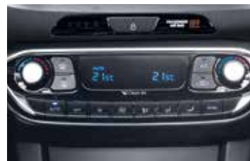
Climatisation automatique bi-zone