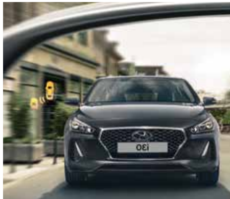
Surveillance des angles morts*

Peu d'automobiles offrent une telle sérénité au volant. i30 Nouvelle Génération se dote d'un lot complet de technologies de sécurité, comme la détection de fatigue du conducteur, le freinage d'urgence autonome, la surveillance des angles morts ou encore les feux de route intelligents.