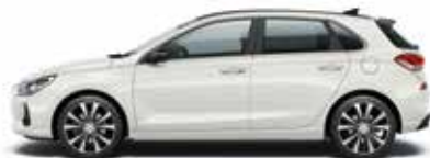
Polar White (non métallisée)