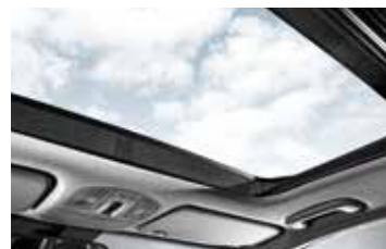
Toit ouvrant panoramique