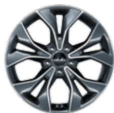
Jante alliage 18"