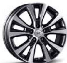
Jante alliage 17"