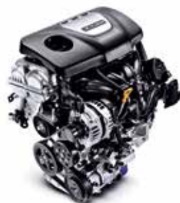
1.0 T-GDi 120