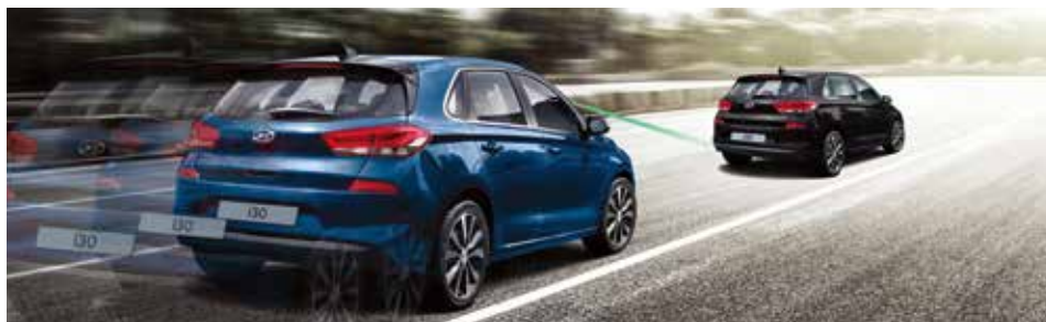
Freinage d'urgence autonome