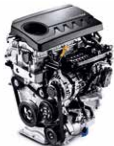
1.4 T-GDi 140