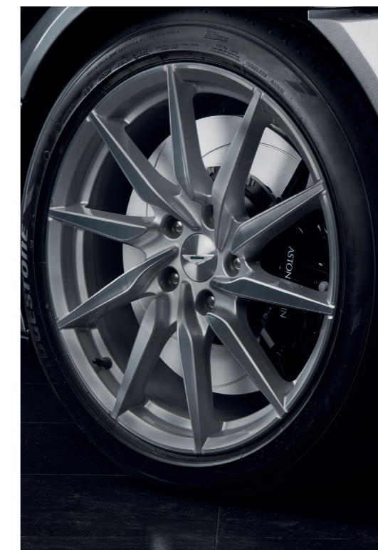
Kit jantes et pneus hiver