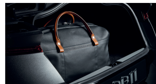
Ensemble de 4 bagages