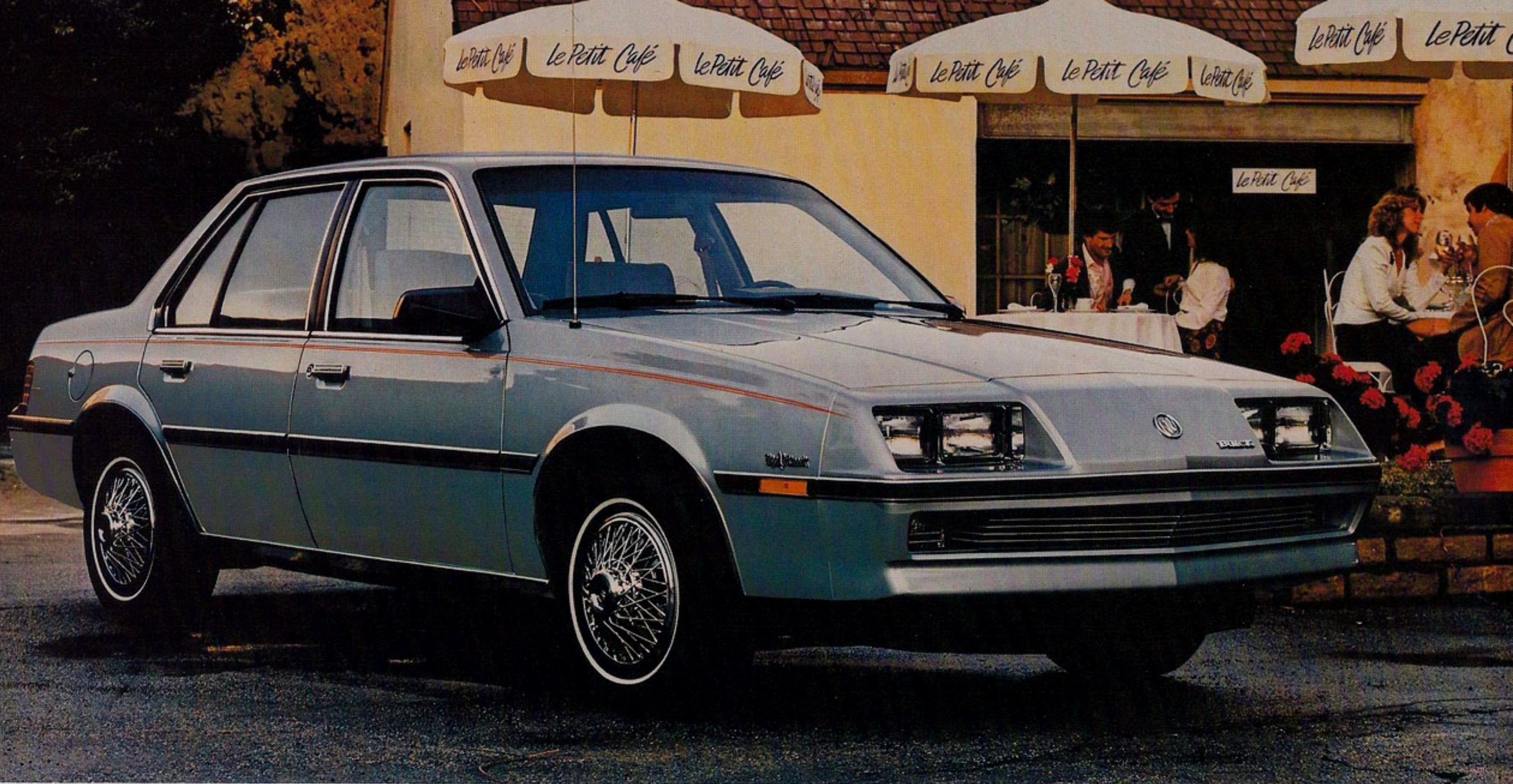
Le sedan Skyhawk Limited.

F aire l'essai de la toute nouvelle Skyhawk, c'est comme redécouvrir une vieille connaissance ou trouver un intérieur familier à l'aspect renouvelé. Cette voiture dans la tradition Buick est aussi ultra-moderne.