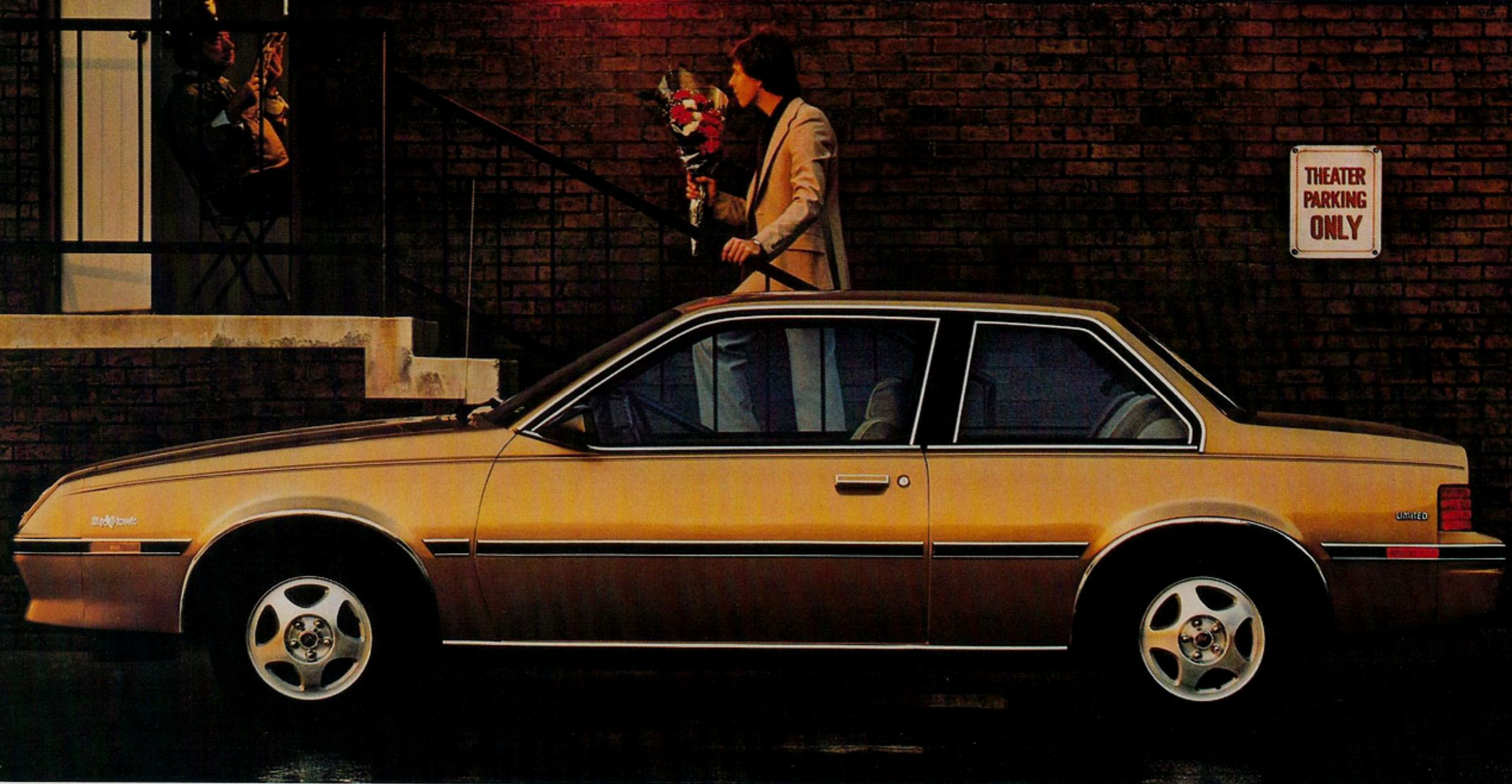
Le coupé Skyhawk Limited.

L orsqu'une petite voiture est efficace, construite avec précision, bien équipée, élégante et vraiment confortable—même luxueuse—nous l'appelons une Buick.