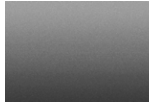
Acier satiné métallisé 1,2