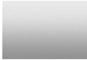
Vif-argent métallisé 1