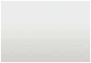
Blanc givré triple couche 1