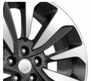
18 po en aluminium à 10 rayons, fini gris technique Exclusives au groupe caractère.