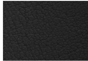
Sièges en tissu avec similicuir 3 ou sièges garnis de cuir 4 èbène

Garnitures contrastantes èbène comprises avec toutes les couleurs intérieures.