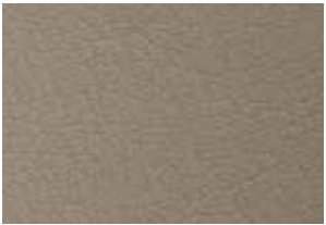
Sièges en tissu avec similicuir 3 ou sièges garnis de cuir 4 argile