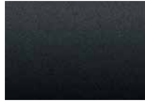
Èbène crépuscule métallisé 1