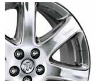
18 po en aluminium chromé à 7 rayons 6 En option avec le groupe caractère.

6 Comprises et livrables uniquement avec le groupe expérience Buick.