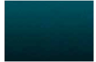
Azur foncé métallisé 1,2

1 Peinture haut de gamme moyennant supplément. 2 Non livrable au début de la production.