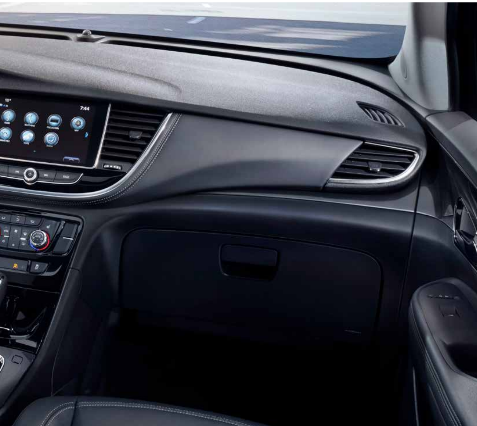
Intérieur de l'Encore groupe caractère illustré en ébène avec garnitures contrastantes ébène et équipement en option.

ÉCRAN COULEUR TACTILE DE 203 MM (8 PO) EN DIAGONALE Faites des appels mains libres, accédez à vos stations de radio SiriusXM 1 préférées au cours des trois mois de période d'essai gratuite, puis par abonnement payant, et profitez aussi des nombreuses fonctions du système d'infodivertissement 2 de Buick. Mieux encore, obtenez des indications routières et des renseignements à jour sur la circulation grâce au système de navigation intégré 3 en option.