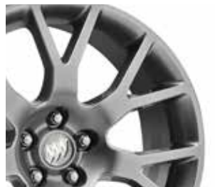
18 po en alliage d'aluminium, fini argent minuit Exclusives au groupe sport de tourisme.