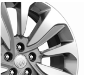
18 po en aluminium à 10 rayons, fini argent clair Exclusives au groupe privilège.