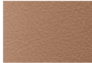
Sièges garnis de cuir brandy 4,5