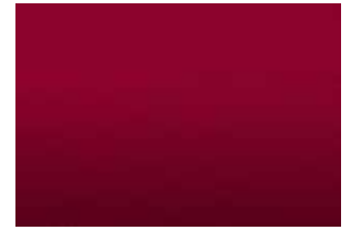
Rouge groseille métallisé 1