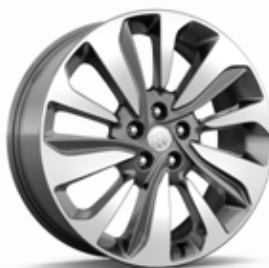
18 PO EN ALUMINIUM À 10 RAYONS, FINI ARGENT CLAIR (RDK)