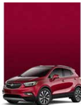
ROUGE GROSEILLE MÉTALLISÉ 1,2