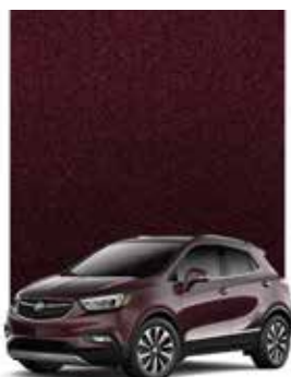
CERISE NOIRE MÉTALLISÉ 1,2