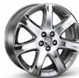
18 PO EN ALUMINIUM CHROMÉ À 7 RAYONS (RV8)