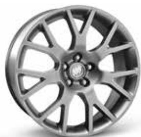
18 PO EN ALLIAGE D'ALUMINIUM, FINI ARGENT MINUIT (RSZ)