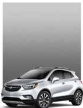
VIF-ARGENT MÉTALLISÉ 1,2