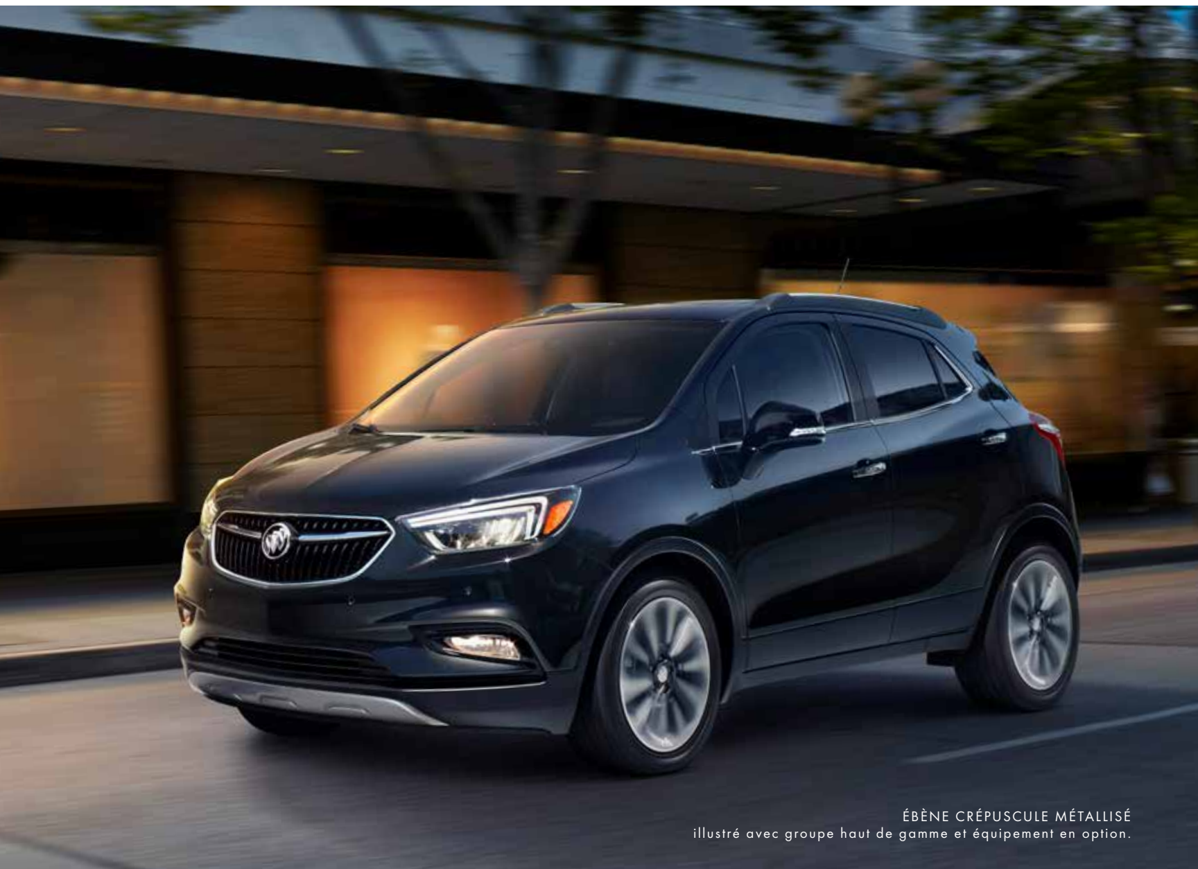
ÉBÈNE CRÉPUSCULE MÉTALLISÉ illustré avec groupe haut de gamme et équipement en option.