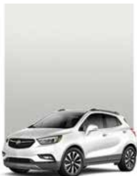
BLANC GIVRÉ MÉTALLISÉ 1,2