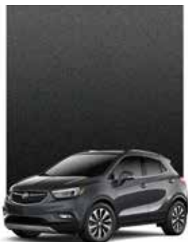
GRIS GRAPHITE MÉTALLISÉ 1,2