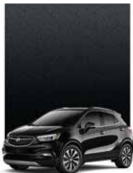
ÉBÈNE CRÉPUSCULE MÉTALLISÉ 1