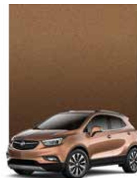
ROCHE DE RIVIÈRE MÉTALLISÉ 1,2