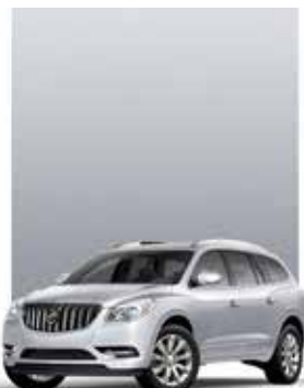
VIF-ARGENT MÉTALLISÉ 1,2