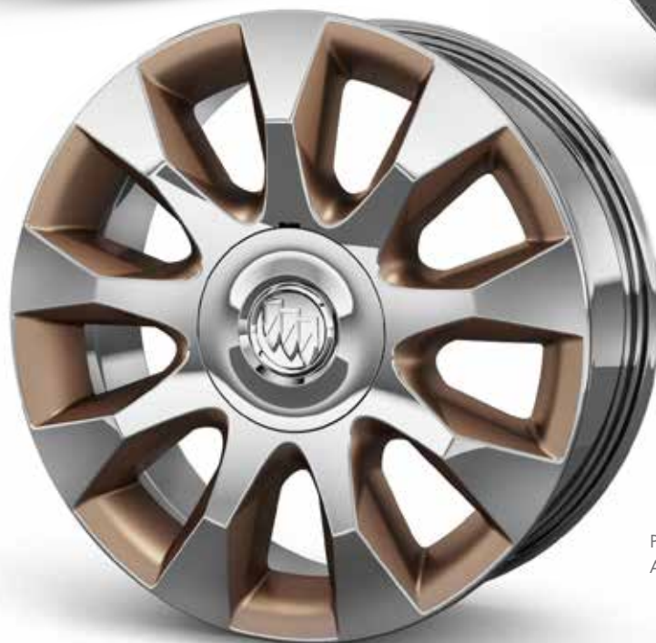
PPE 20 PO EN FONTE D'ALUMINIUM CHROMÉ AVEC ÉVIDEMENTS BRONZE