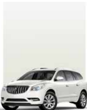
BLANC SOMMET 1,2