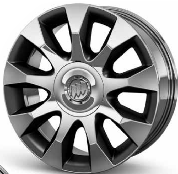
PJK 20 PO EN FONTE D'ALUMINIUM CHROMÉ AVEC ÉVIDEMENTS NOIR GLACÉ SATINÉ