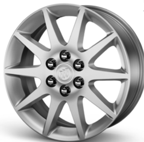
RZA 19 PO EN ALUMINIUM À 10 RAYONS