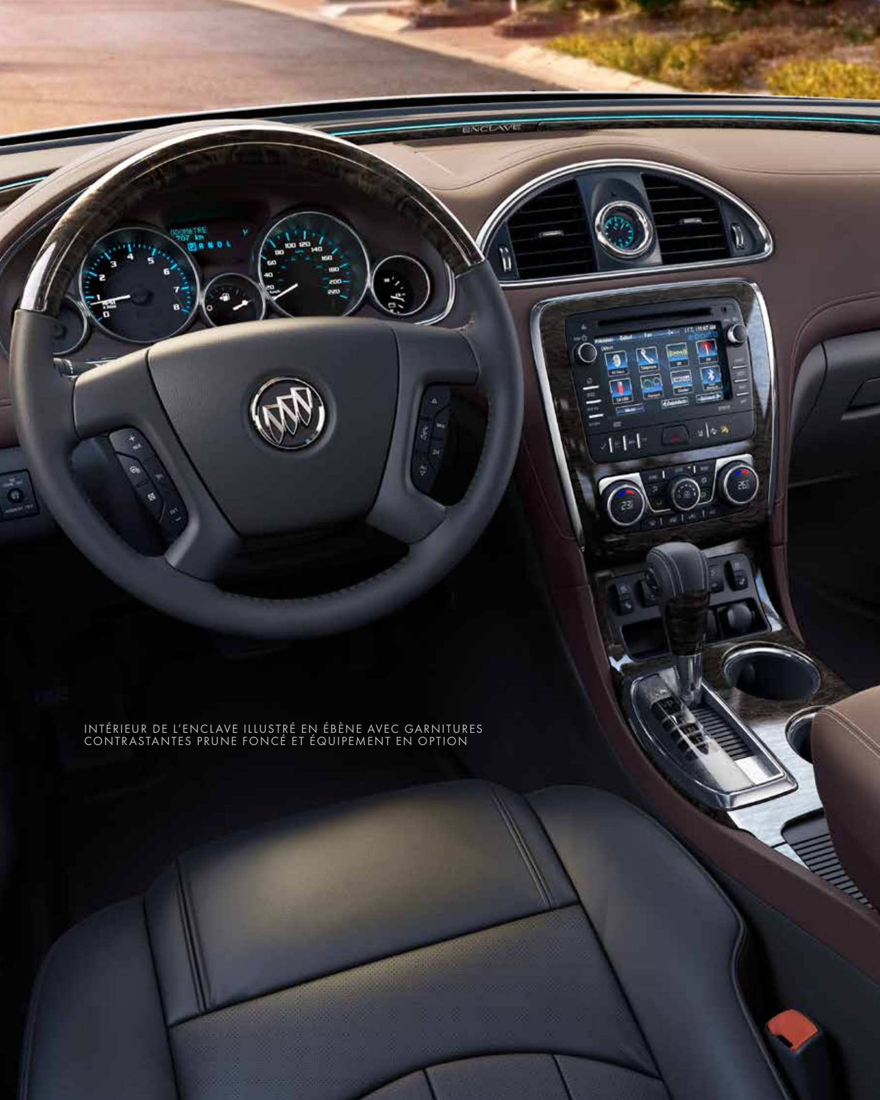
INTÉRIEUR DE L'ENCLAVE ILLUSTRÉ EN ÉBÈNE AVEC GARNITURES CONTRASTANTES PRUNE FONCÉ ET ÉQUIPEMENT EN OPTION