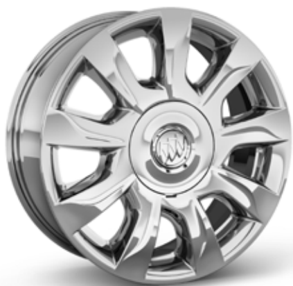
PJH 19 PO EN FONTE D'ALUMINIUM CHROMÉ