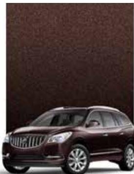
CHOCOLAT NOIR MÉTALLISÉ 2,3