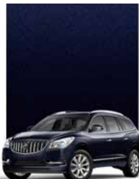
BLEU SAPHIR FONCÉ MÉTALLISÉ 1,2,3