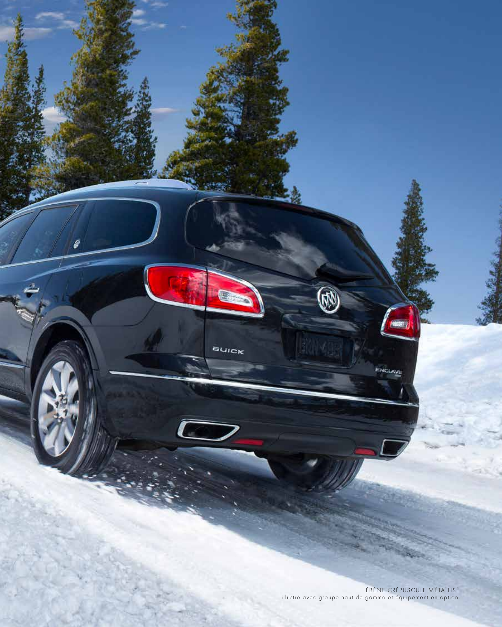
ÉBÈNE CRÉPUSCULE MÉTALLISÉ illustré avec groupe haut de gamme et équipement en option.