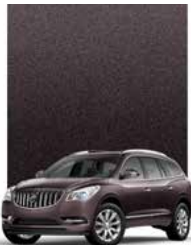
IRIDIUM MÉTALLISÉ 1,2,3