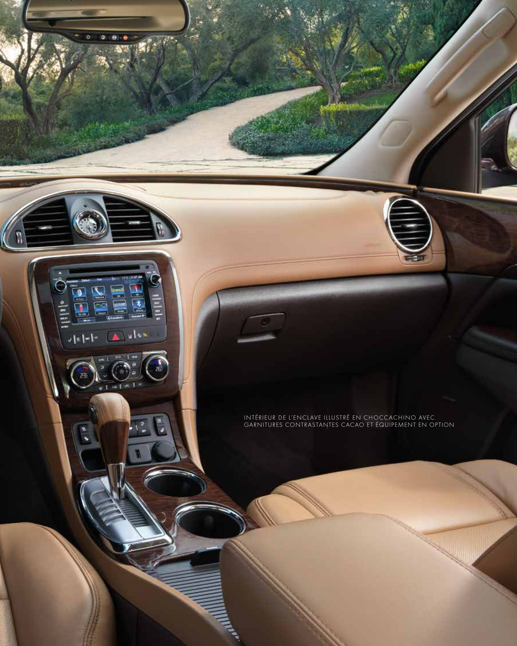
INTÉRIEUR DE L'ENCLAVE ILLUSTRÉ EN CHOCCACHINO AVEC GARNITURES CONTRASTANTES CACAO ET ÉQUIPEMENT EN OPTION