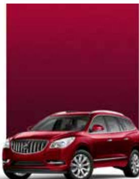
TEINTE ROUGE CRAMOISI 1,3