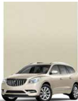
ARGENT ÉTINCELANT MÉTALLISÉ 1,2,3