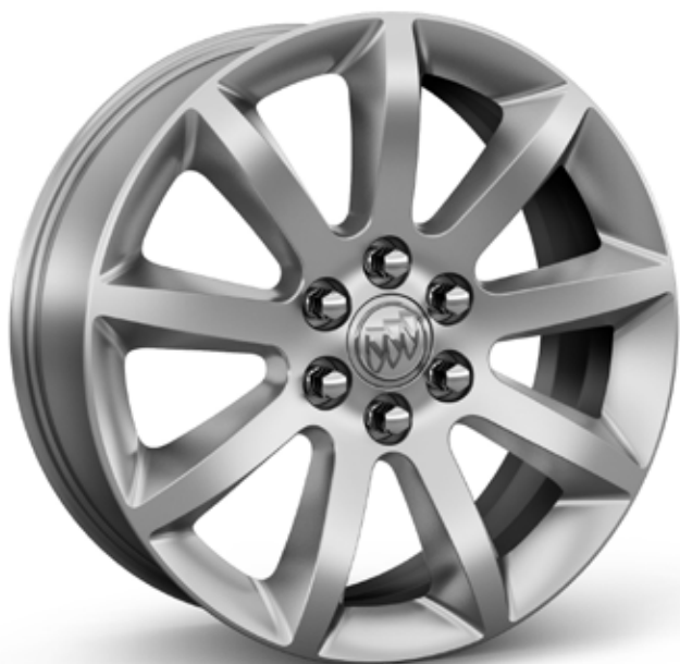
PEW 20 PO EN ALUMINIUM, FINI USINÉ BRILLANT AVEC ÉVIDEMENTS ARGENT LAME