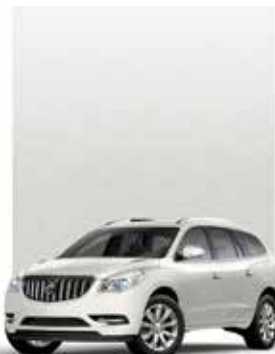
BLANC GIVRÉ TRIPLE COUCHE 3