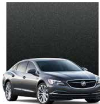
GRIS GRAPHITE MÉTALLISÉ 2