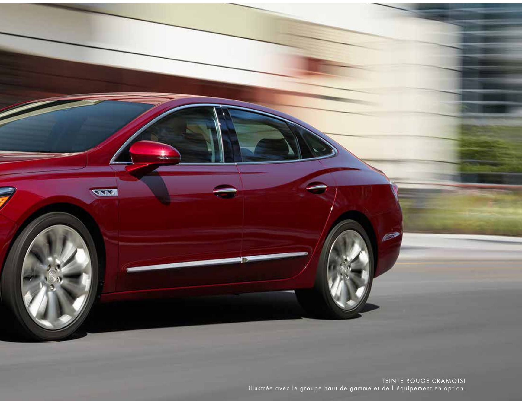
TEINTE ROUGE CRAMOISI illustrée avec le groupe haut de gamme et de l'équipement en option.