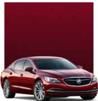
TEINTE ROUGE CRAMOISI 1,2