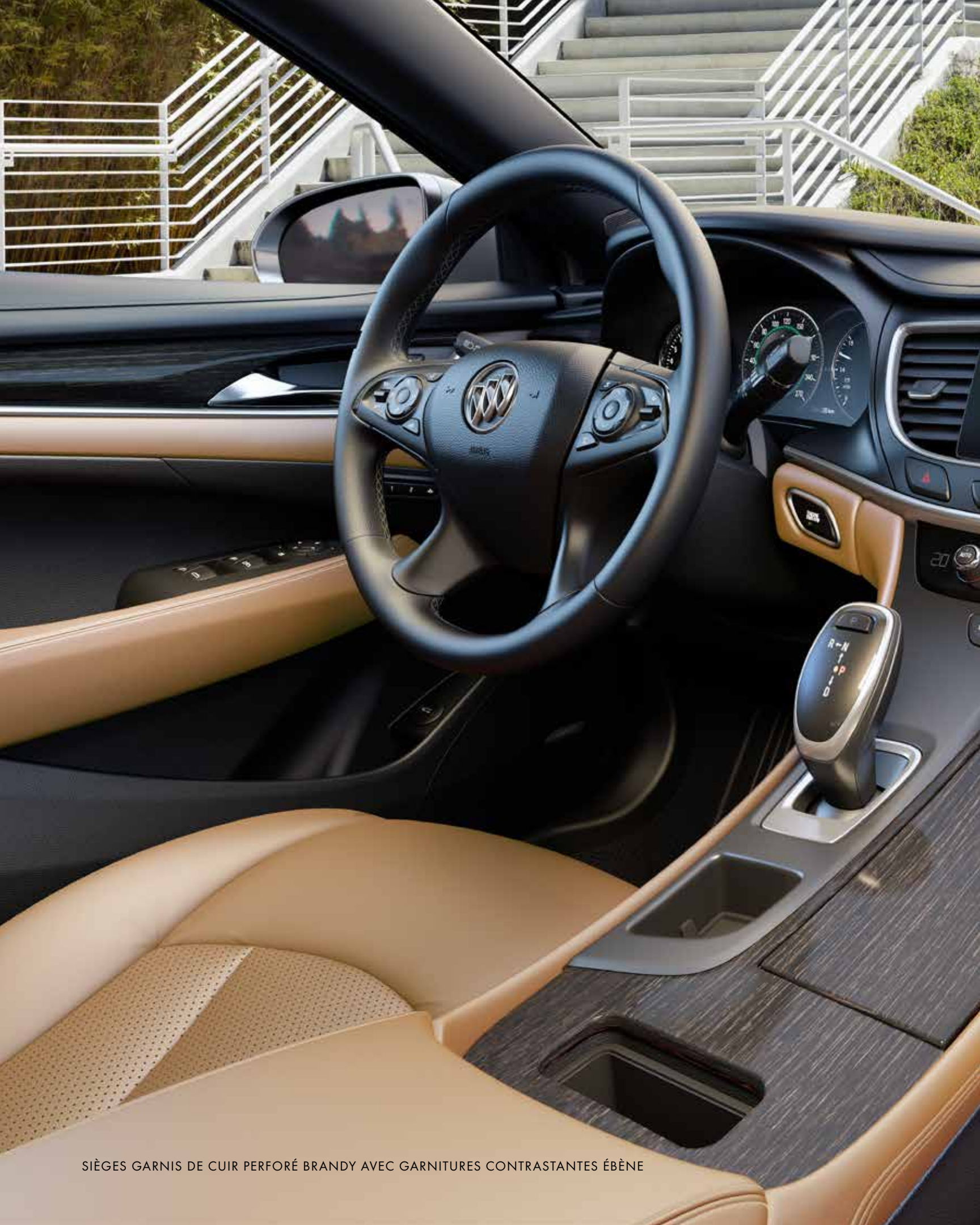
SIÈGES GARNIS DE CUIR PERFORÉ BRANDY AVEC GARNITURES CONTRASTANTES ÉBÈNE