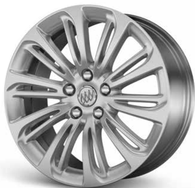
Q7A 18 PO EN ALLIAGE D'ALUMINIUM