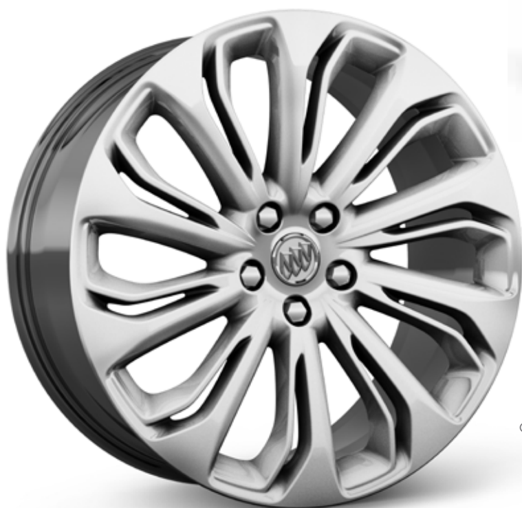
Q7Q 20 PO EN ALLIAGE D'ALUMINIUM