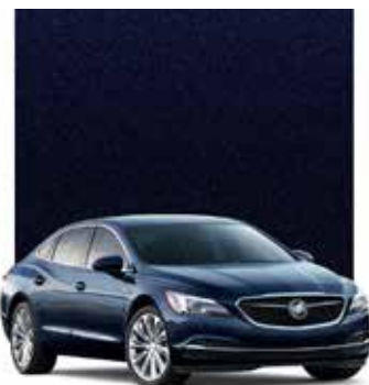
BLEU SAPHIR FONCÉ MÉTALLISÉ 1,2