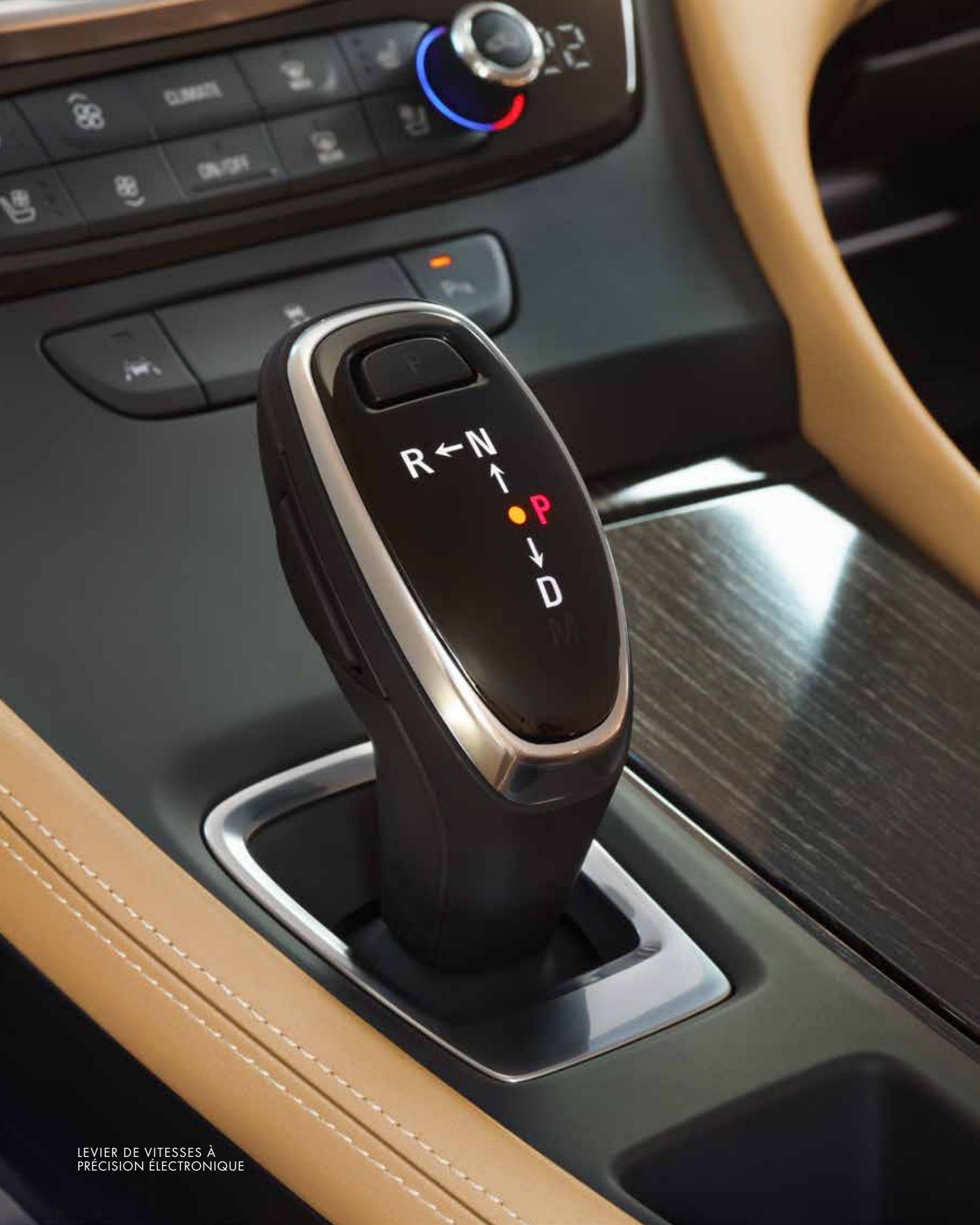
LEVIER DE VITESSES À PRÉCISION ÉLECTRONIQUE