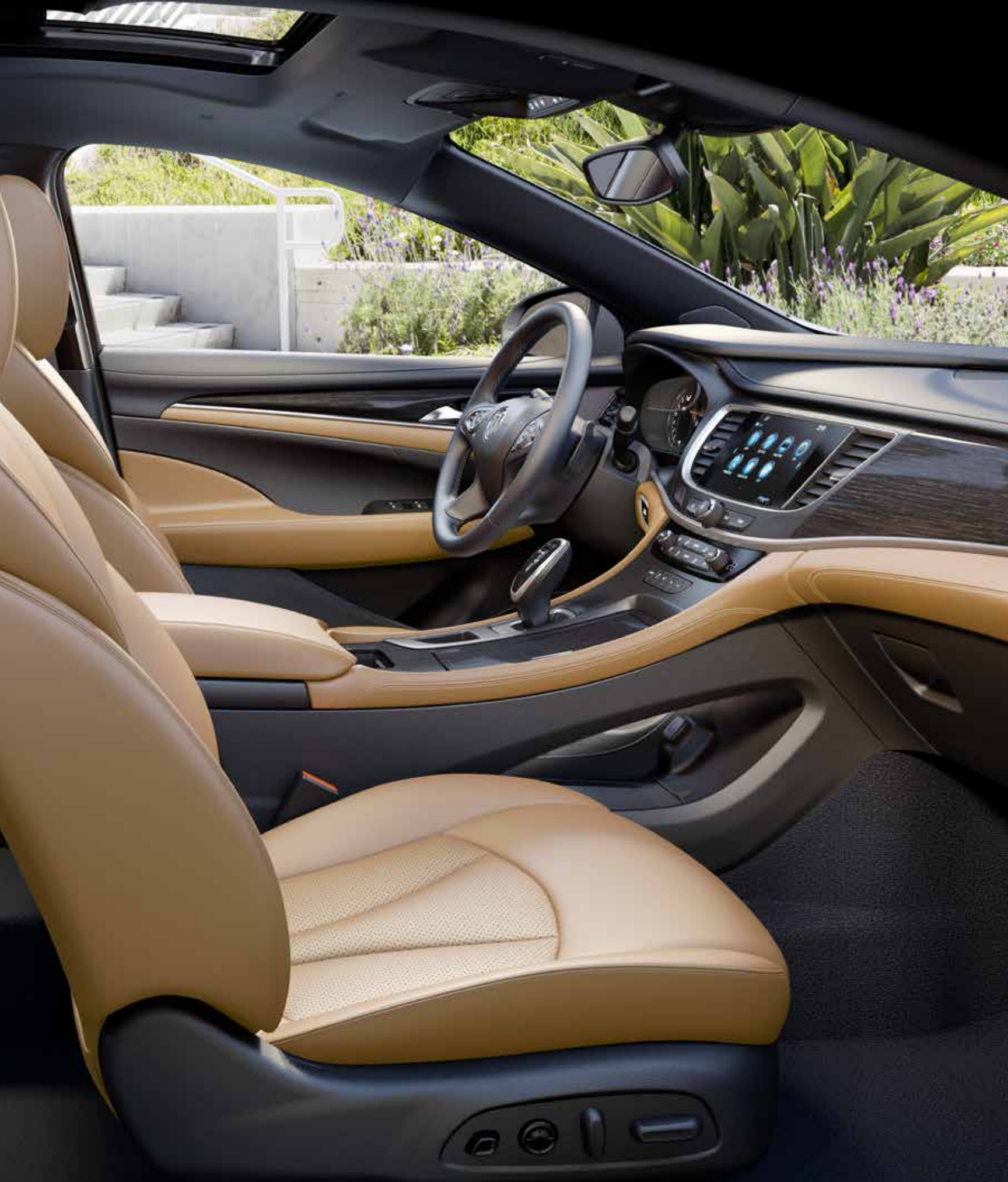
INTÉRIEUR DE LA BUICK LACROSSE ILLUSTRÉ EN BRANDY AVEC GARNITURES CONTRASTANTES ÉBÈNE