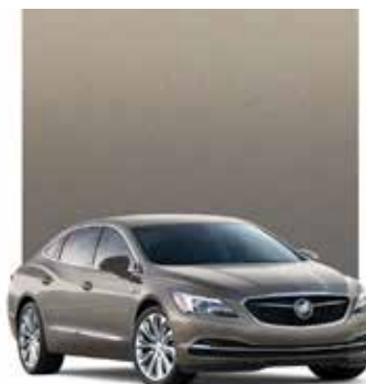
GRIS POIVRE MÉTALLISÉ 2