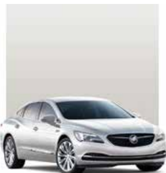
BLANC GIVRÉ TRIPLE COUCHE 1,2