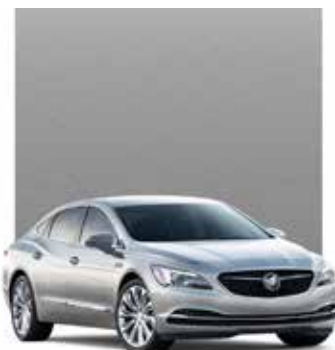
VIF-ARGENT MÉTALLISÉ 2