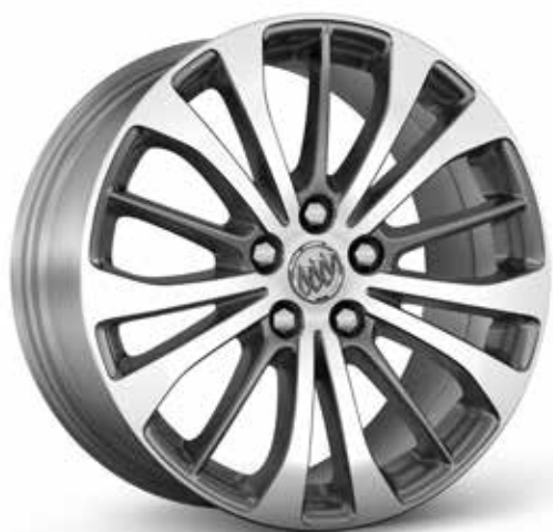
RDA 18 PO EN ALUMINIUM USINÉ, FINI ULTRA-BRILLANT