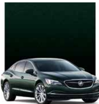
VERT FORÊT FONCÉ MÉTALLISÉ 2