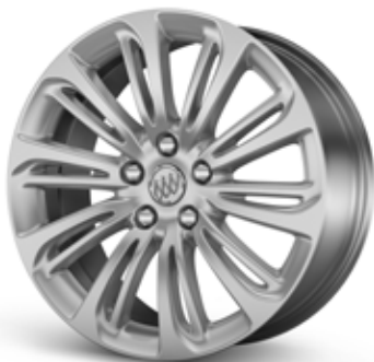
18 PO EN ALUMINIUM