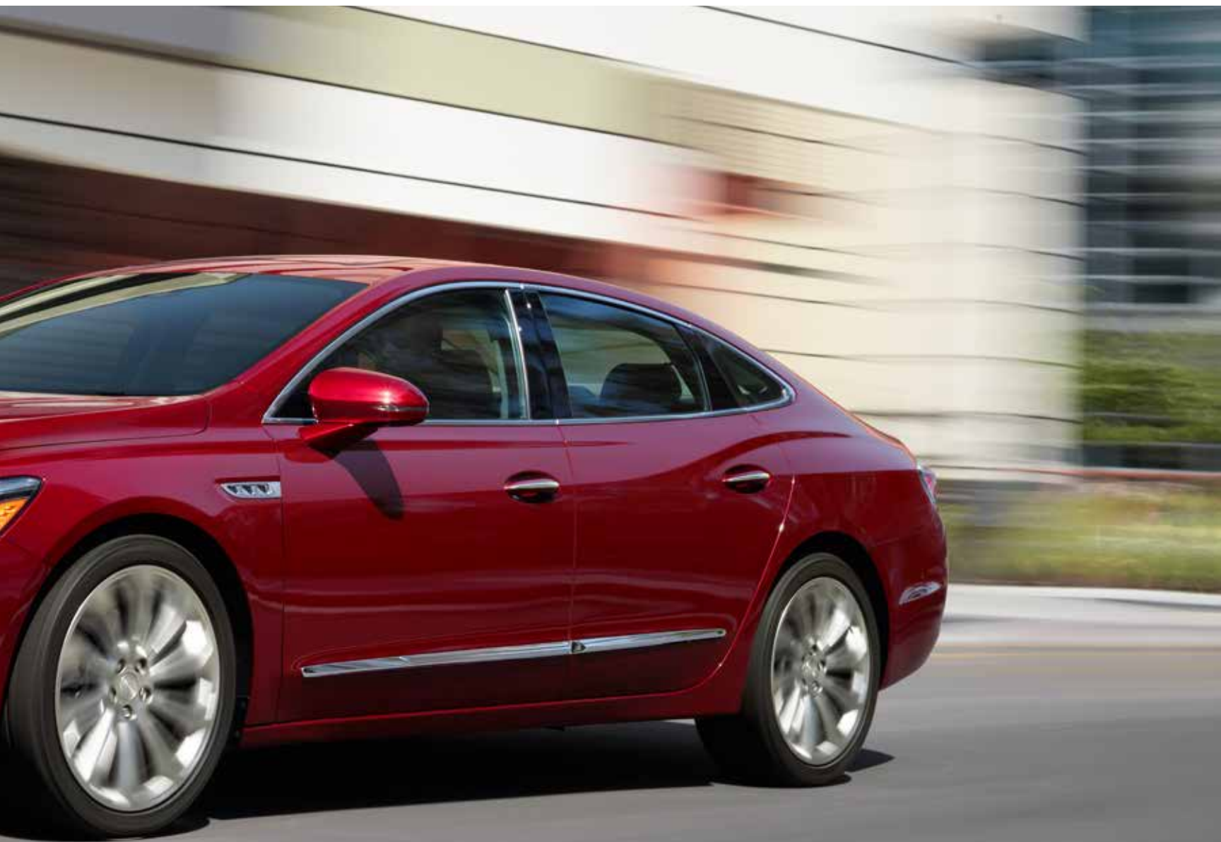
LaCrosse groupe haut de gamme illustrée en teinte rouge quartz avec équipement en option