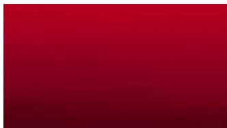
TEINTE ROUGE QUARTZ 1