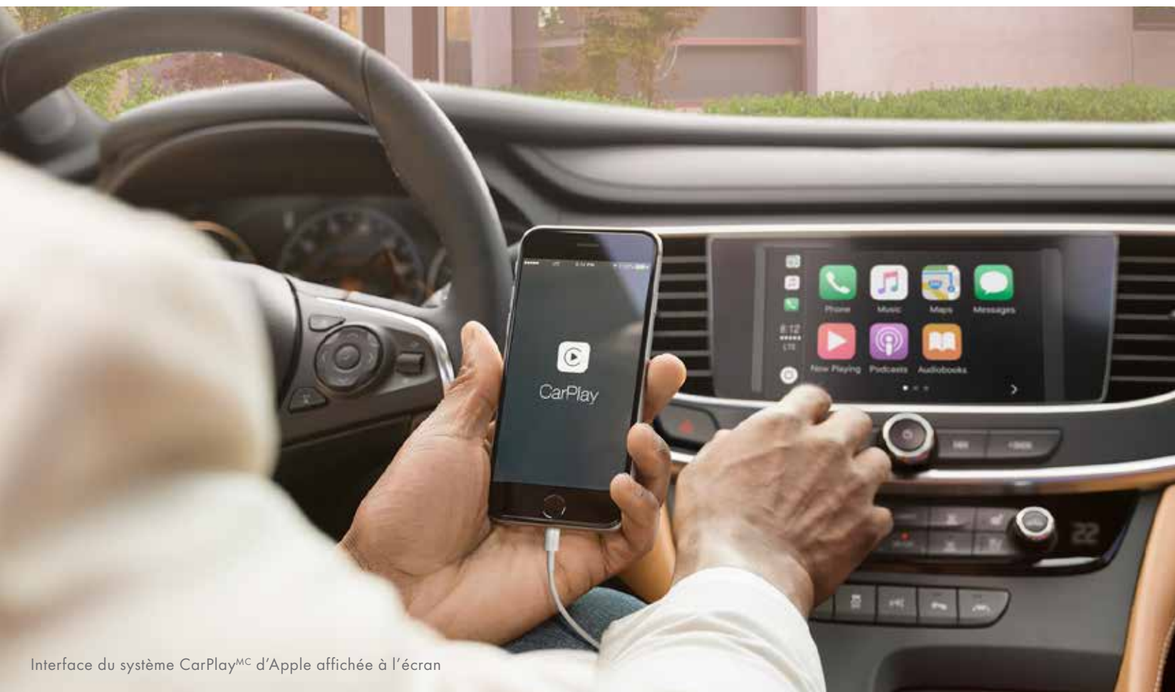
Interface du système CarPlay MC d'Apple affichée à l'écran